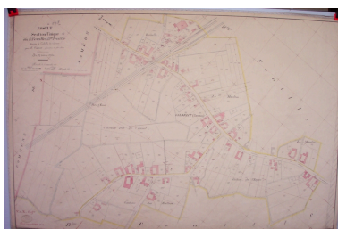
Plan de situation, extrait du cadastre de 1912 (AD Nord Série P : P31/ 624). IVR31_20055907302NUCA