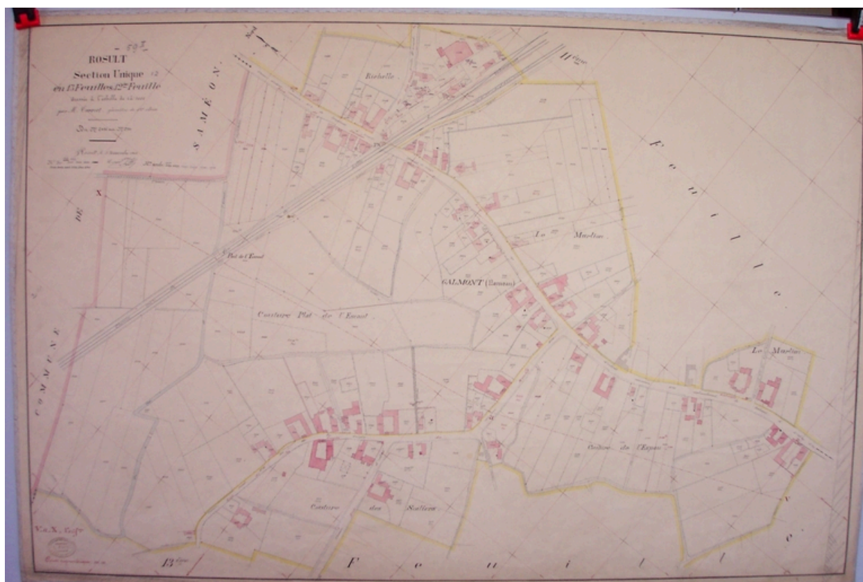
Plan de situation, extrait du cadastre de 1912 (AD Nord Série P : P31/ 624).