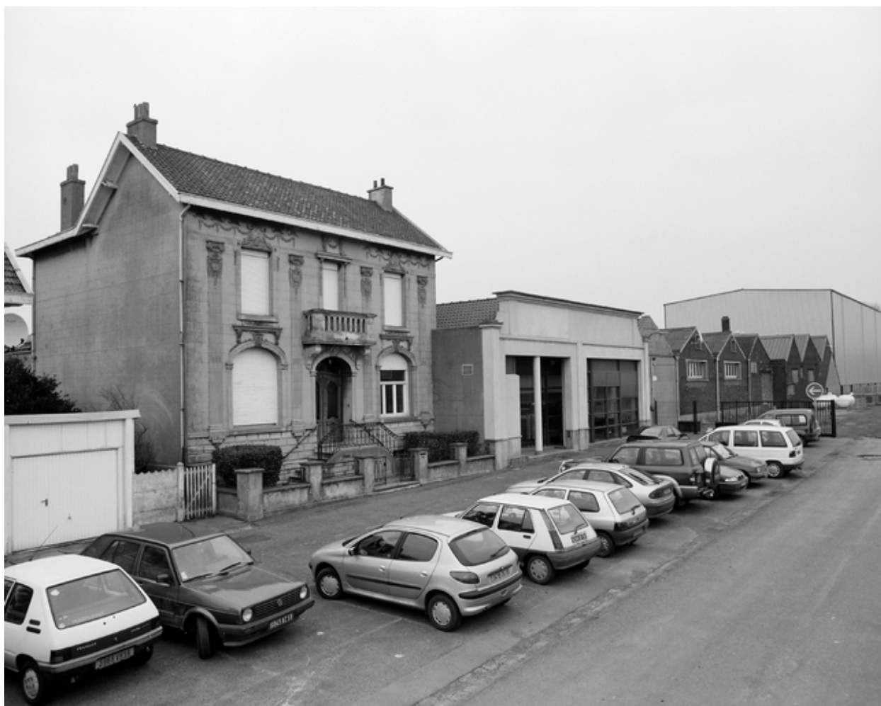
Vue générale de l'usine et de la maison patronale.