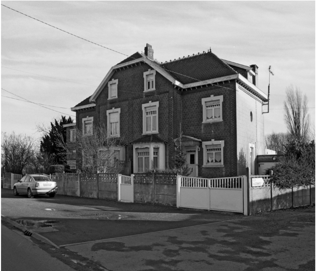
Vue générale des maisons d'ingénieur.