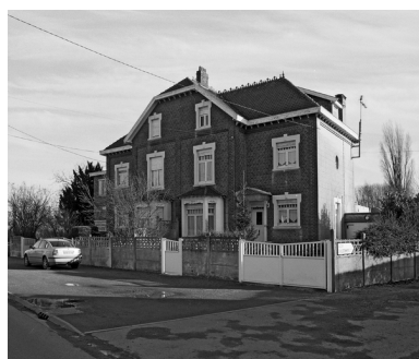
Vue générale des maisons d'ingénieur. IVR31_20055900044X