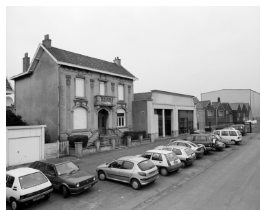
Vue générale de l'usine et de la maison patronale.