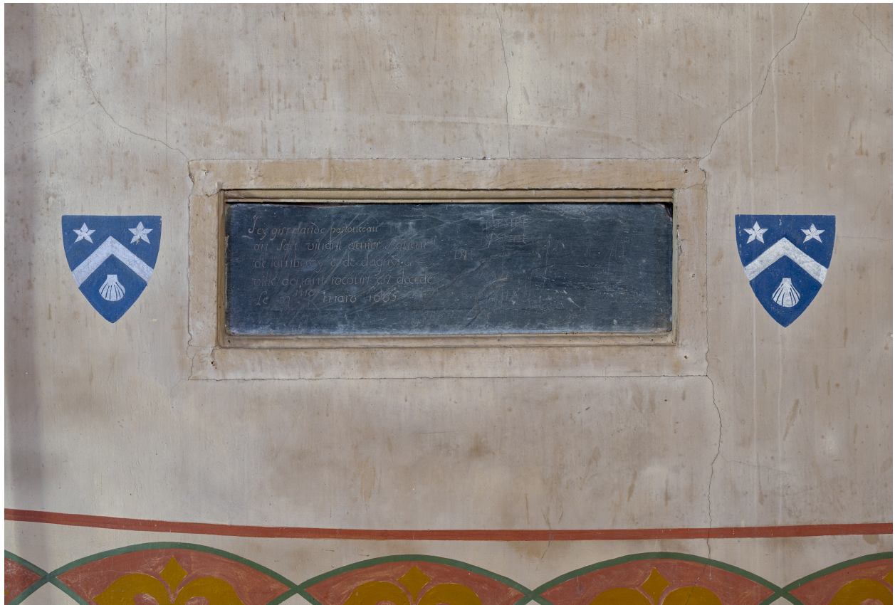
Vue de la plaque funéraire insérée dans un mur de l'église.