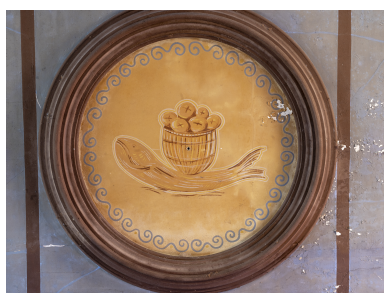
Décor peint, sur le plafond du chœur.