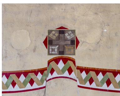
Vue partielle des peintures du décor mural.