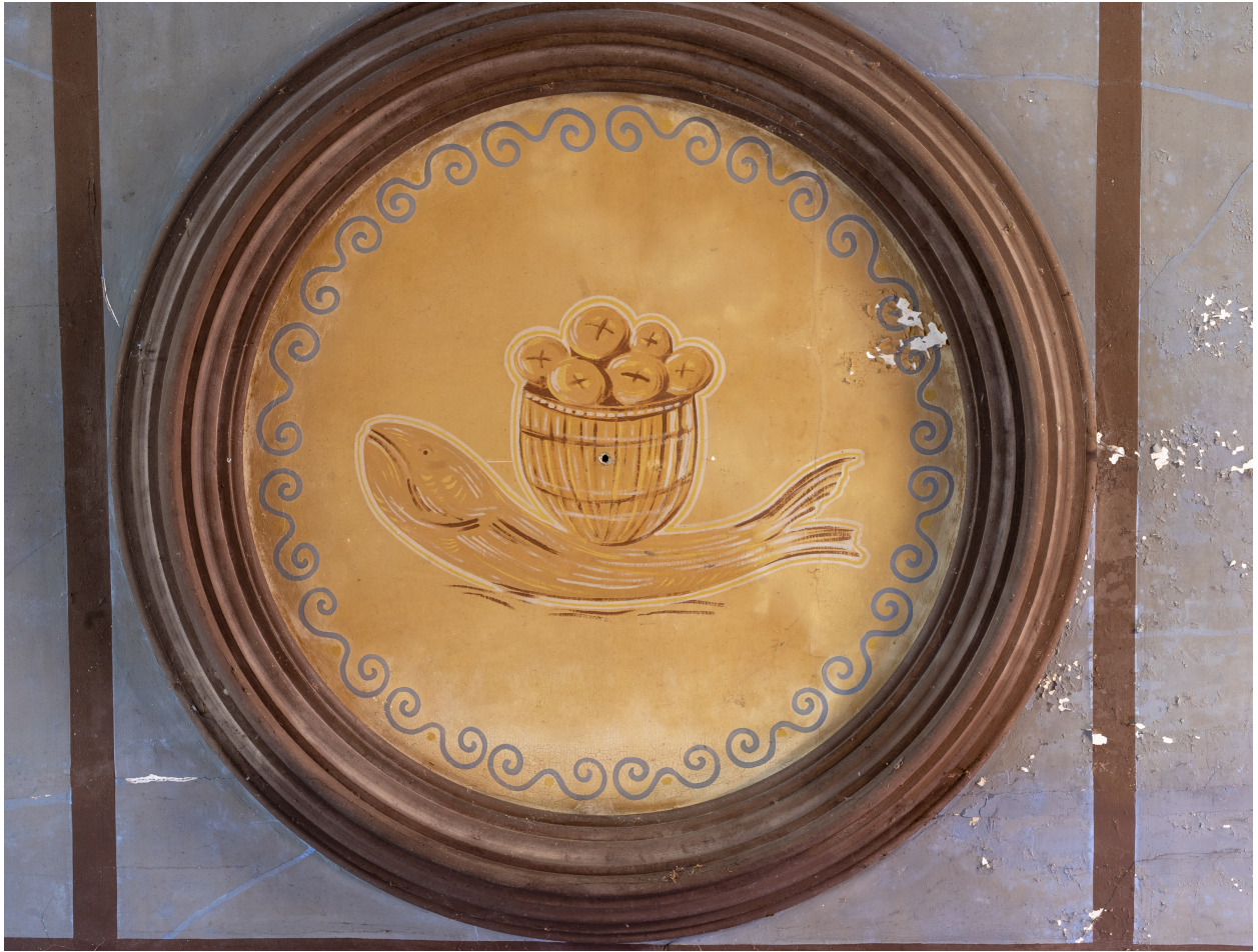
Décor peint, sur le plafond du chœur.