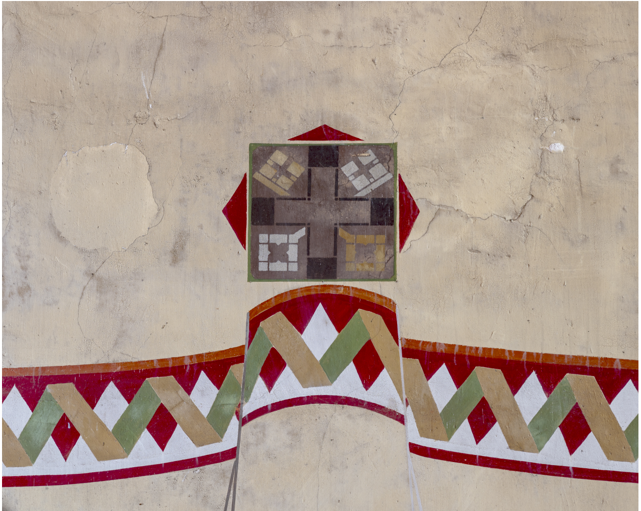
Vue partielle des peintures du décor mural.