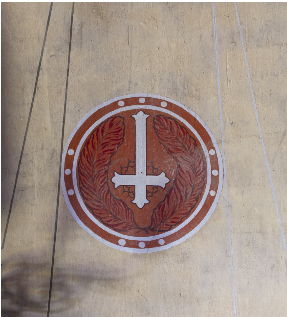
Vue partielle des peintures du décor mural.