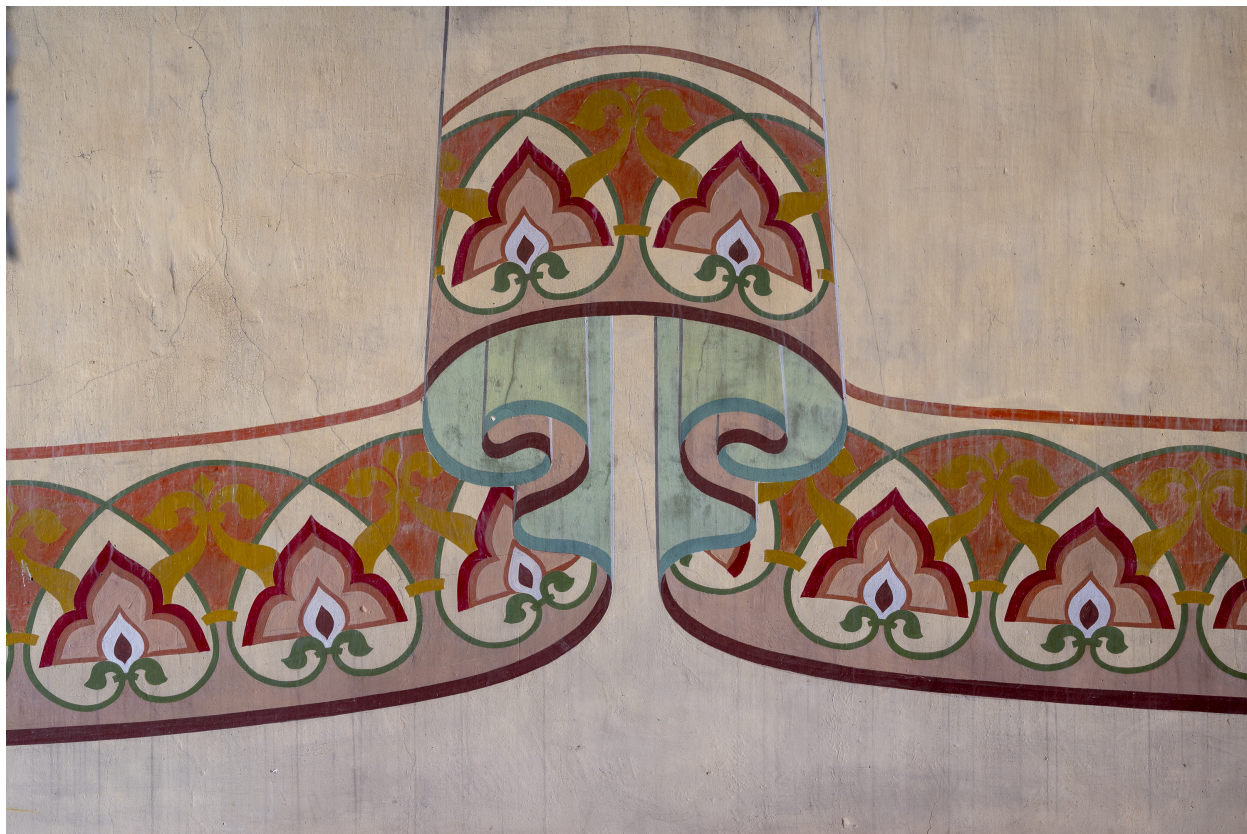
Vue partielle des peintures du décor mural.