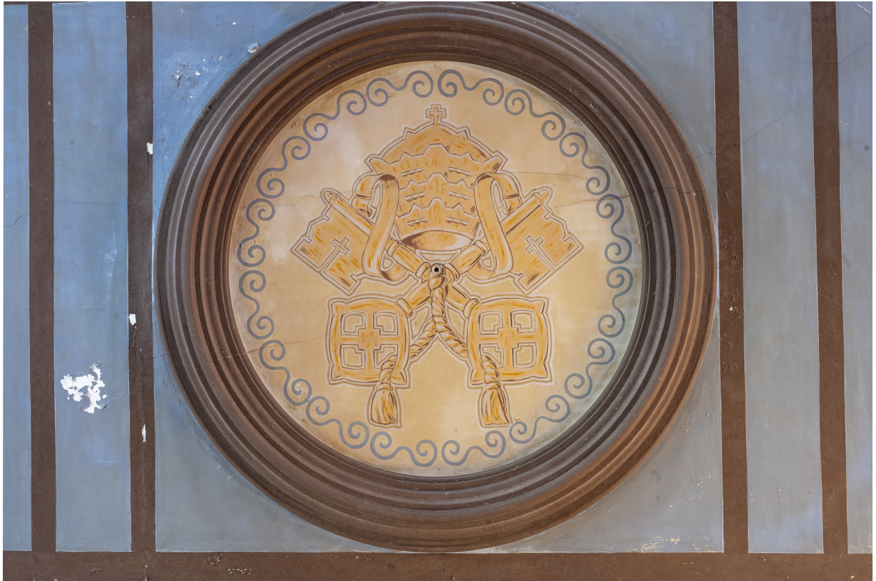
Décor peint, sur le plafond du chœur.