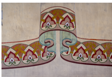
Vue partielle des peintures du décor mural.