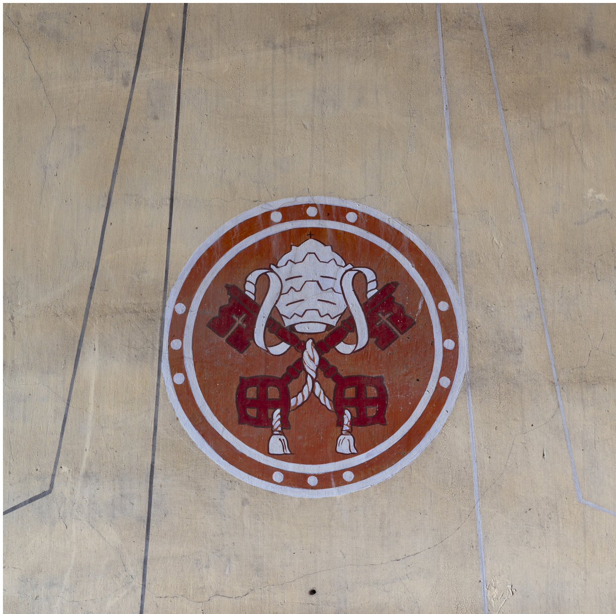
Vue partielle des peintures du décor mural.