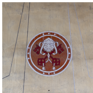
Vue partielle des peintures du décor mural. IVR32_20250200280NUCA