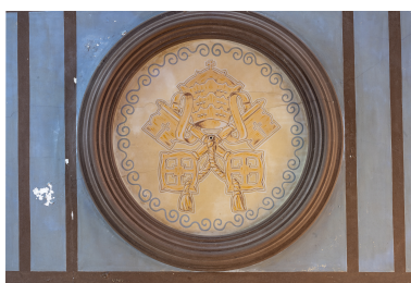
Décor peint, sur le plafond du chœur.