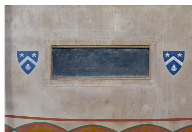
Vue de la plaque funéraire insérée dans un mur de l'église. IVR32_20250200283NUCA