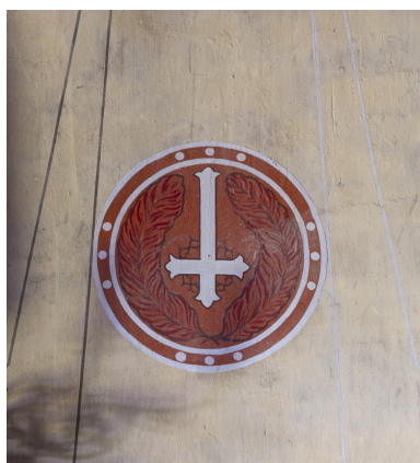
Vue partielle des peintures du décor mural. IVR32_20250200282NUCA