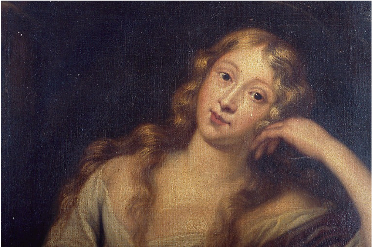
Détail : visage et buste.