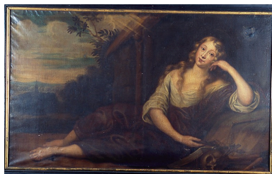
Vue générale. IVR31_20035900865ZA