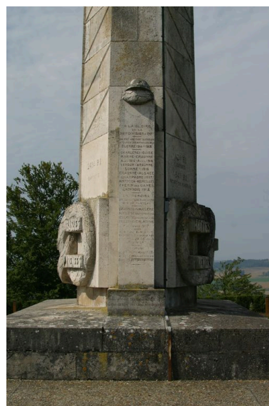
Détail de la dédicace.