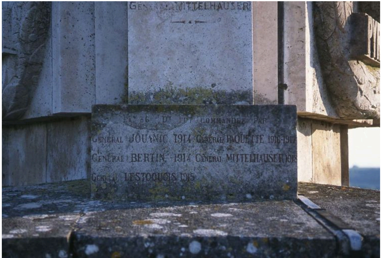
Autre détail de la dédicace.