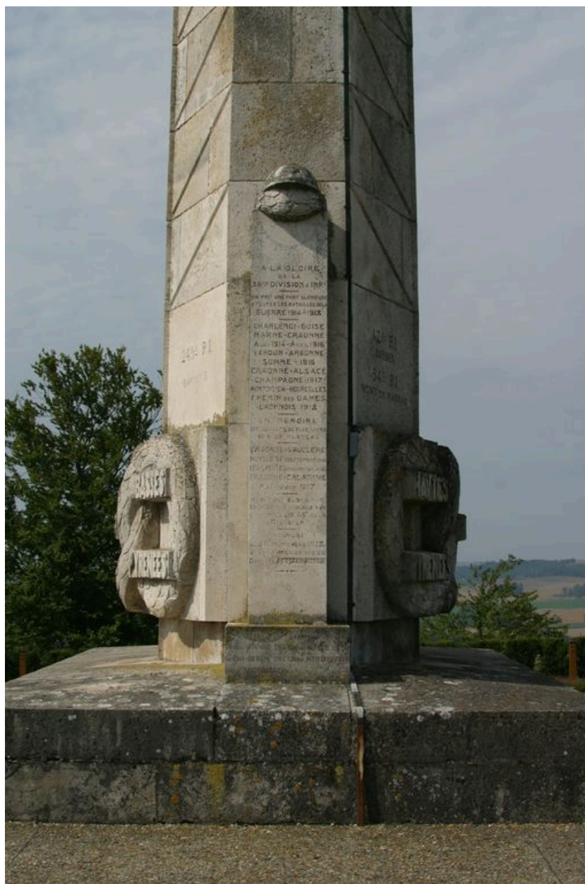
Détail de la dédicace.