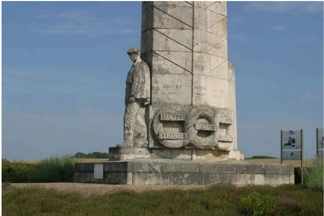
Détail de la figure du Basque.