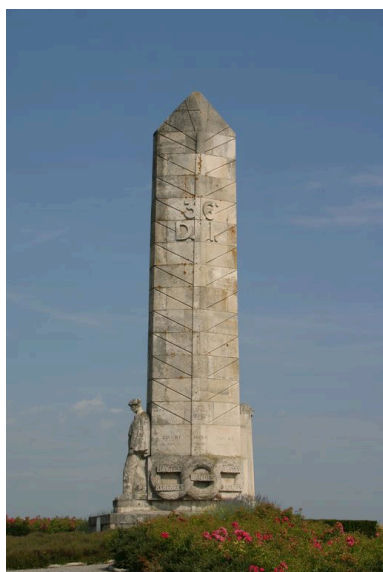
Vue générale.