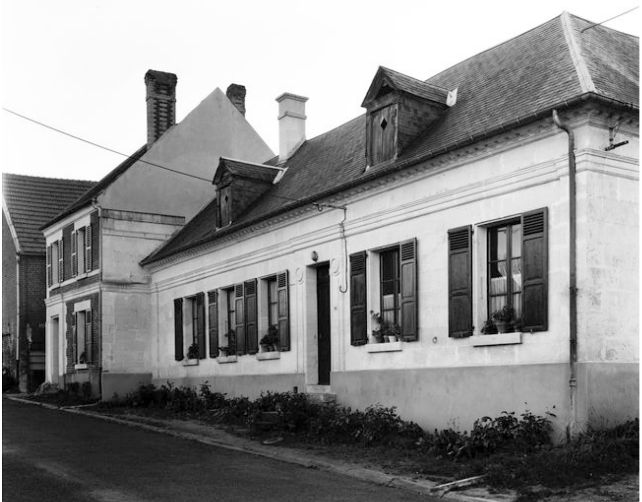
Logis. Elévation antérieure.