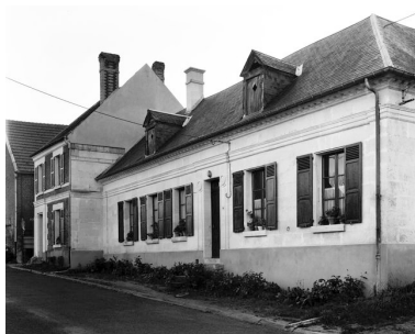
Logis. Elévation antérieure. IVR22_19846001400V

Plan de situation. Extrait du plan cadastral de 1982, section A3 512. IVR22_20096000061NUC2A