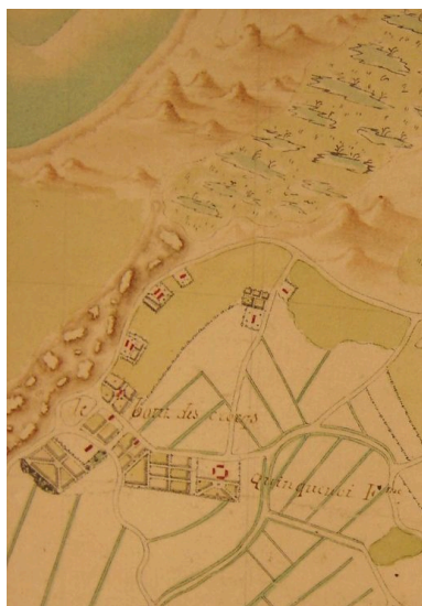
Extrait d'une carte du 18e siècle présentant la physionomie du hameau .