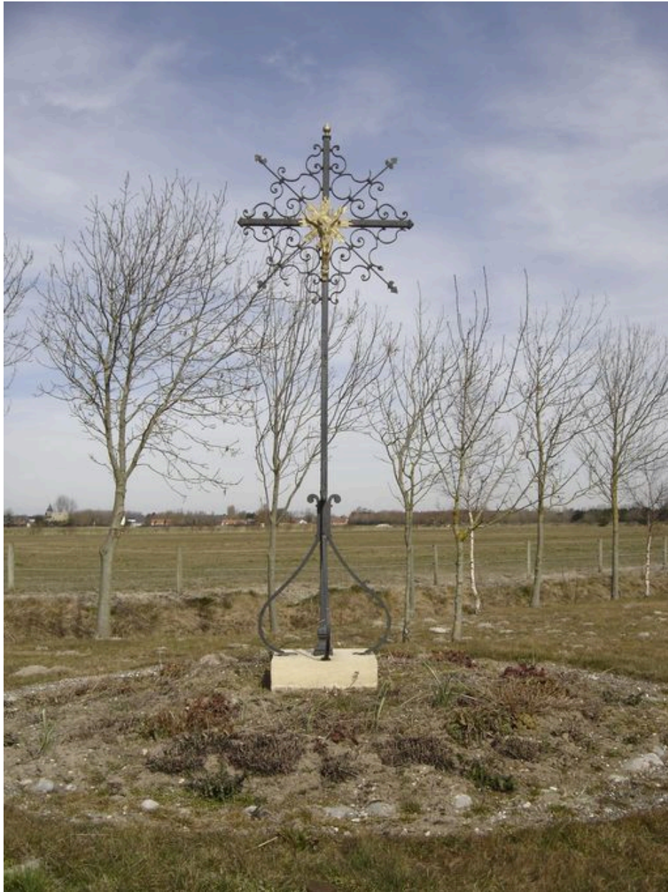
Vue générale du calvaire du hameau.