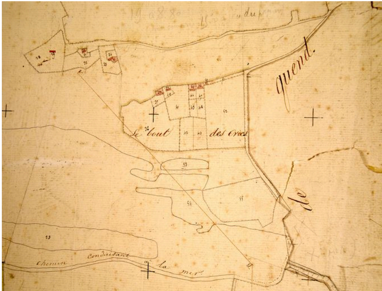
Extrait du cadastre napoléonien présentant la section du Bout des Crocs en 1826.