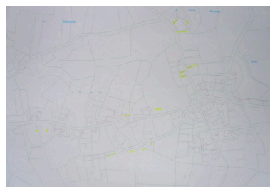
Superposition des cadastres napoléonien et actuel présentant l'évolution du bâti au cours du 19e siècle.