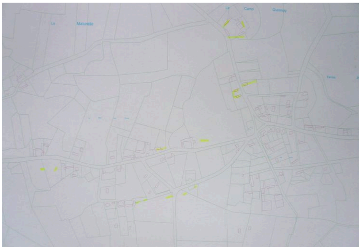
Superposition des cadastres napoléonien et actuel présentant l'évolution du bâti au cours du 19e siècle.