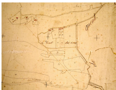
Extrait du cadastre napoléonien présentant la section du Bout des Crocs en 1826.