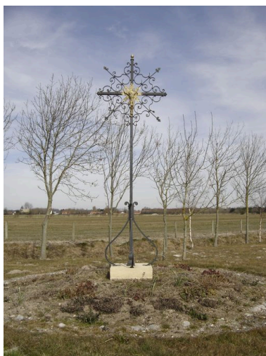
Vue générale du calvaire du hameau.