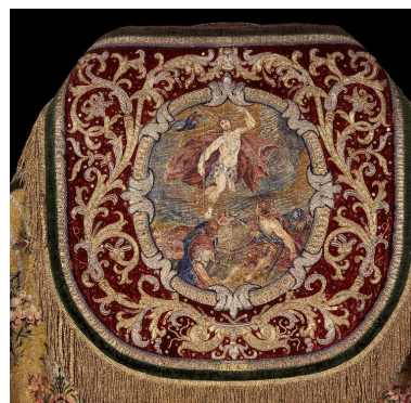
Détail du chaperon avec broderie représentant la Résurrection.