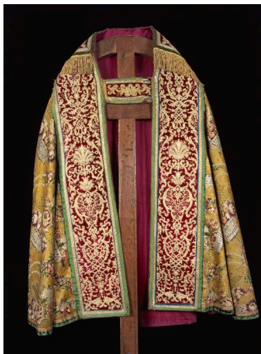
Vue du devant d'une des trois chapes.