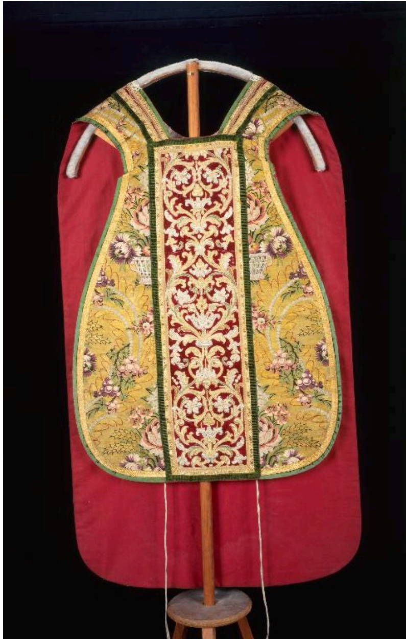
Vue du devant de la chasuble.