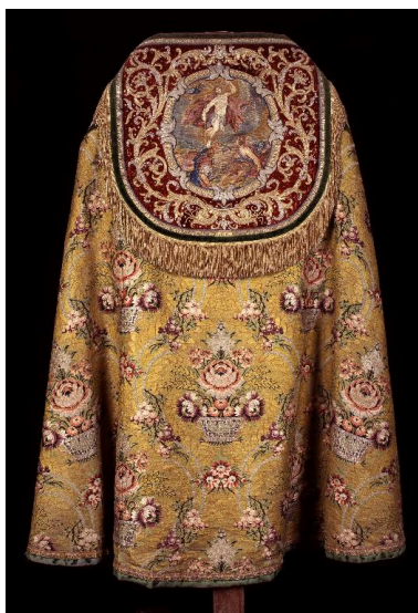
Vue du dos de la chape avec le chaperon illustrant la Résurrection.