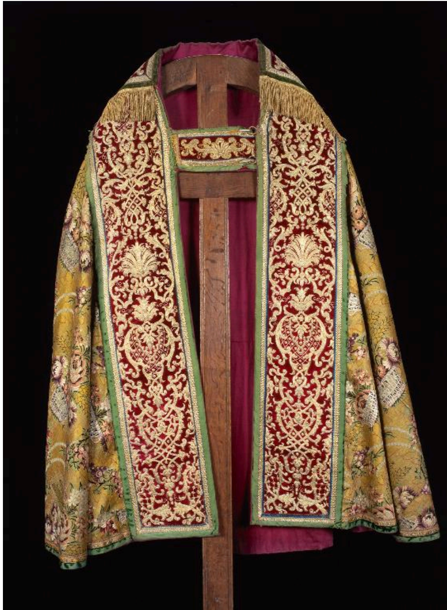
Vue du devant d'une des trois chapes.