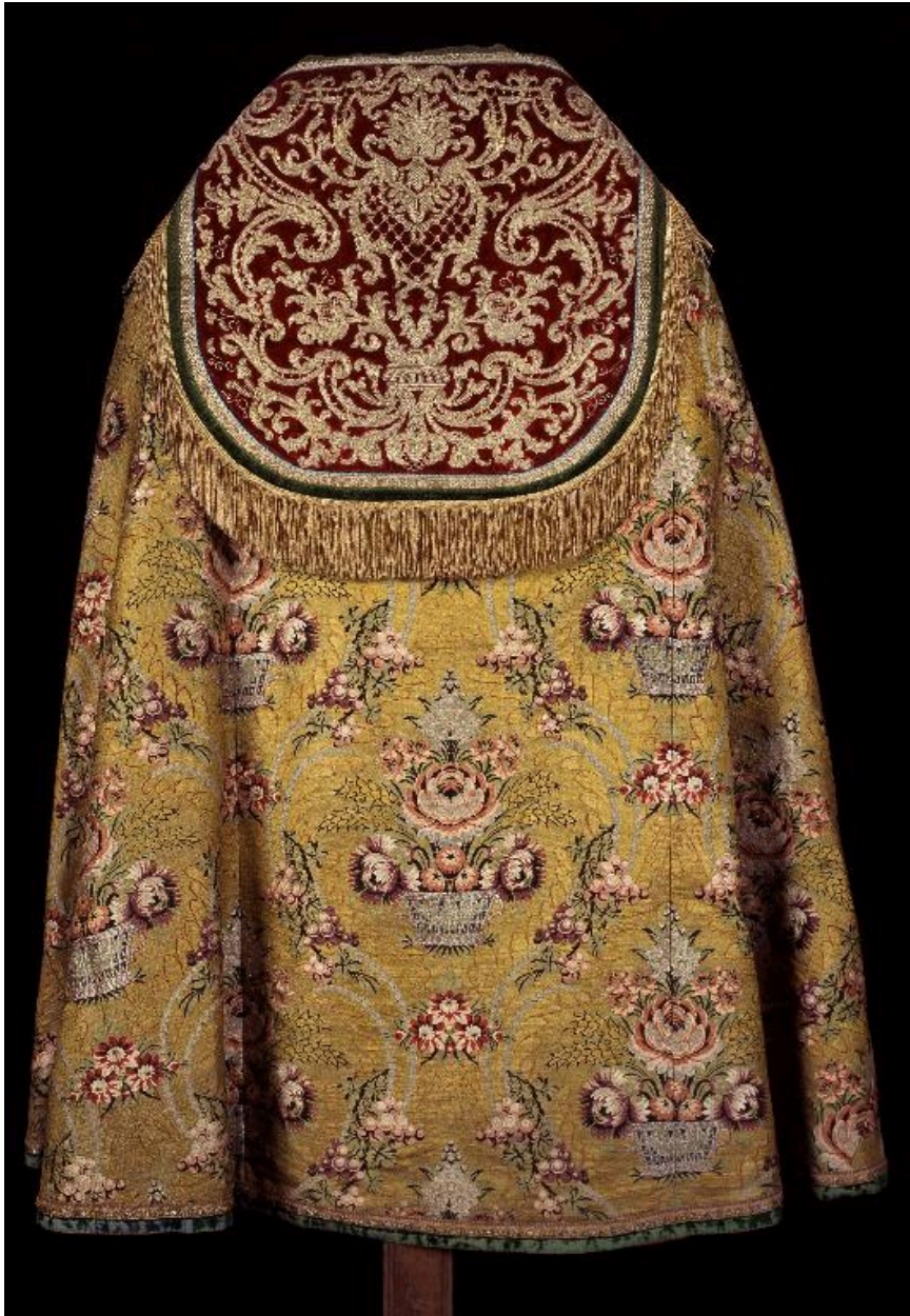
Vue du dos de la chape avec le chaperon à rinceaux.