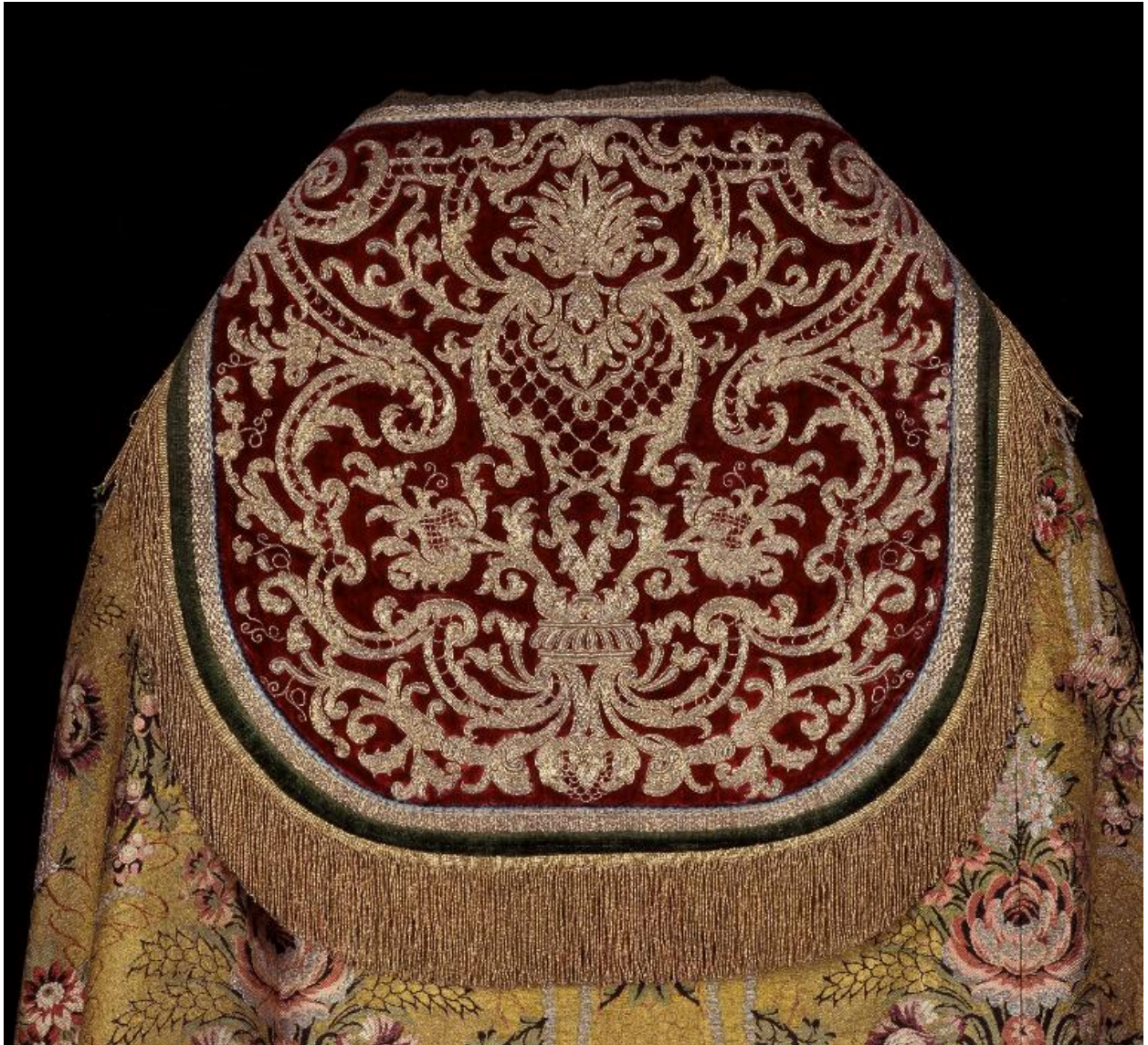
Détail du chaperon à rinceaux.