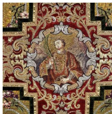
Détail du dos de la chasuble : saint Etienne dans un médaillon.