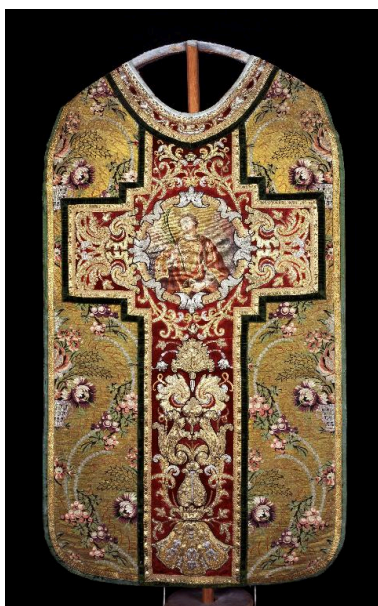
Vue du dos de la chasuble. IVR22_19956001011XA