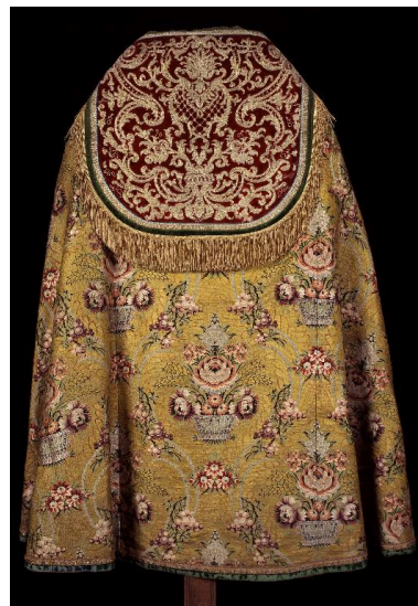
Vue du dos de la chape avec le chaperon à rinceaux.