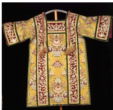
Vue de l'une des dalmatiques, de dos. IVR22_19956000997XA