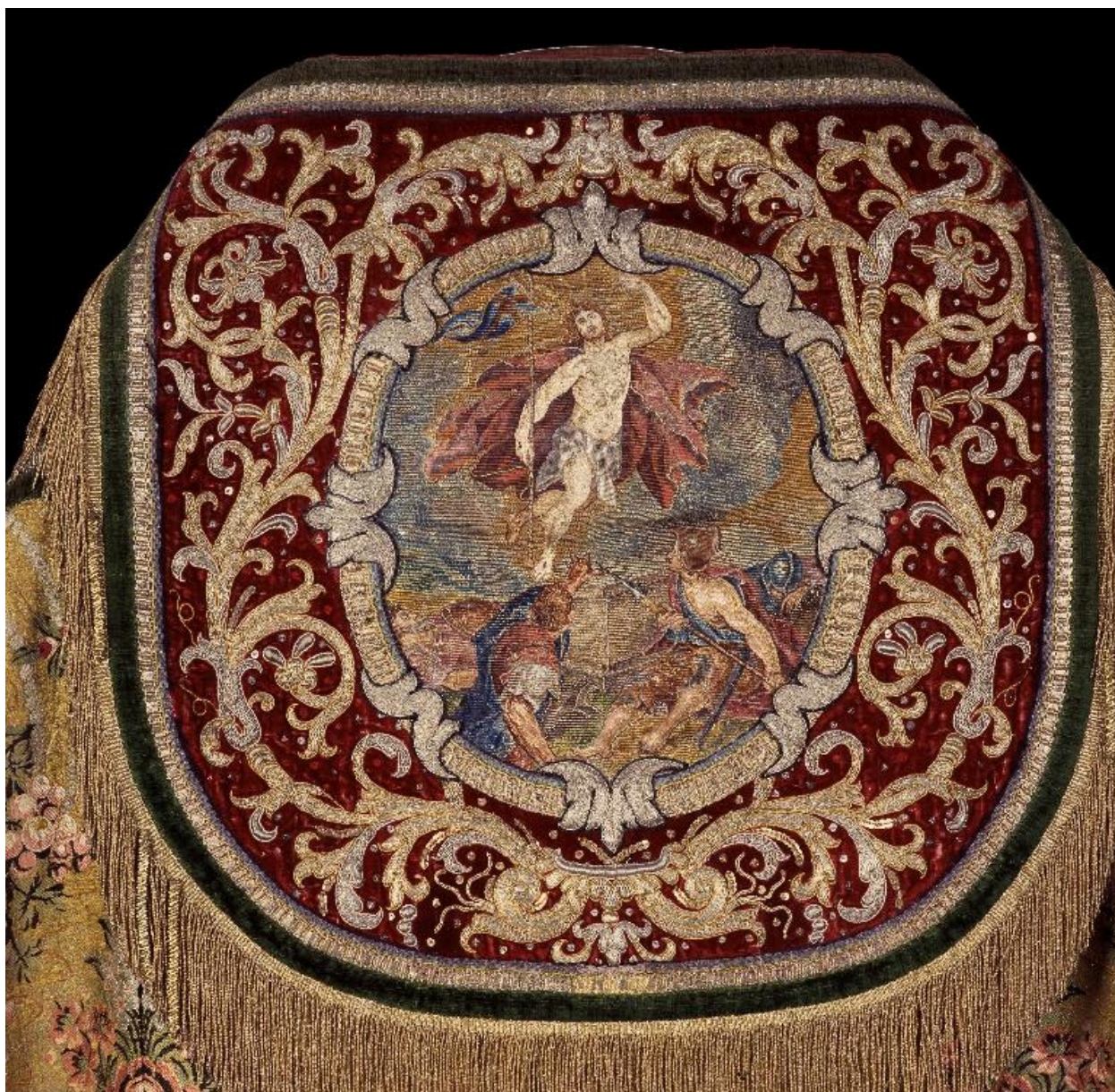
Détail du chaperon avec broderie représentant la Résurrection.