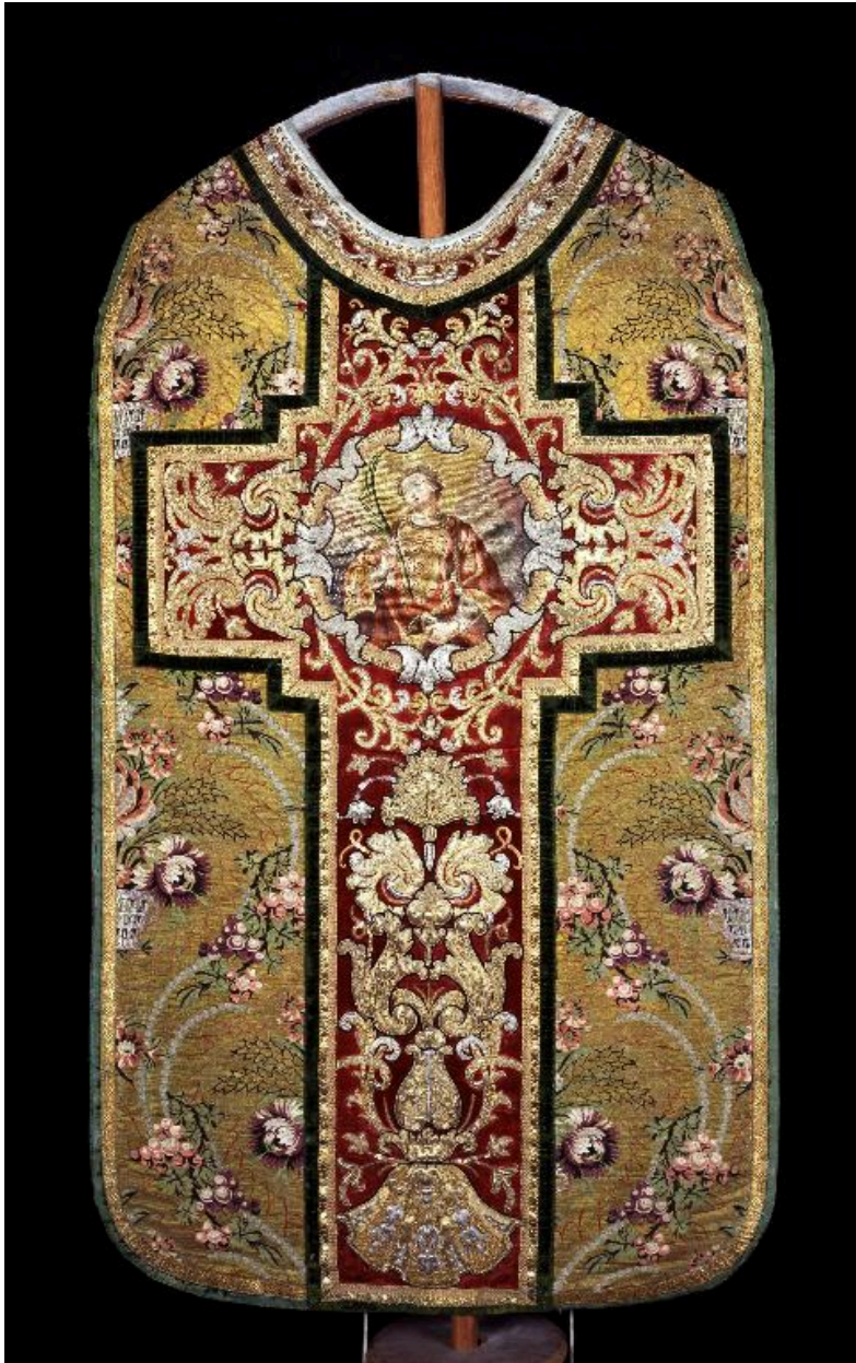
Vue du dos de la chasuble.