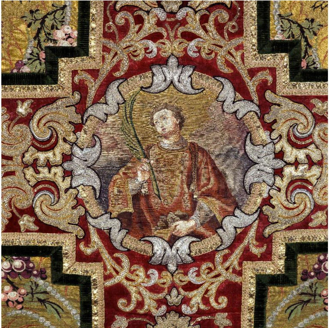
Détail du dos de la chasuble : saint Etienne dans un médaillon.