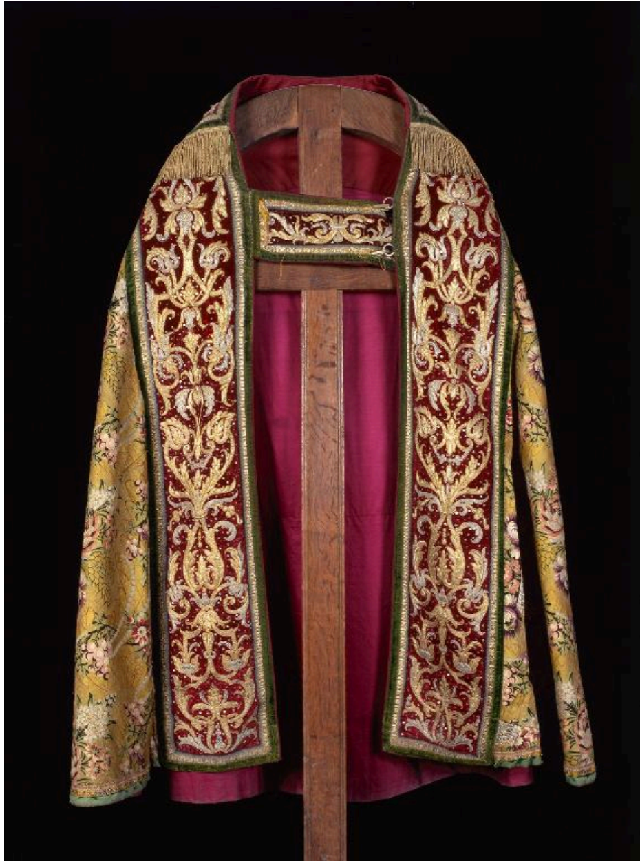
Vue du devant d'une des trois chapes.