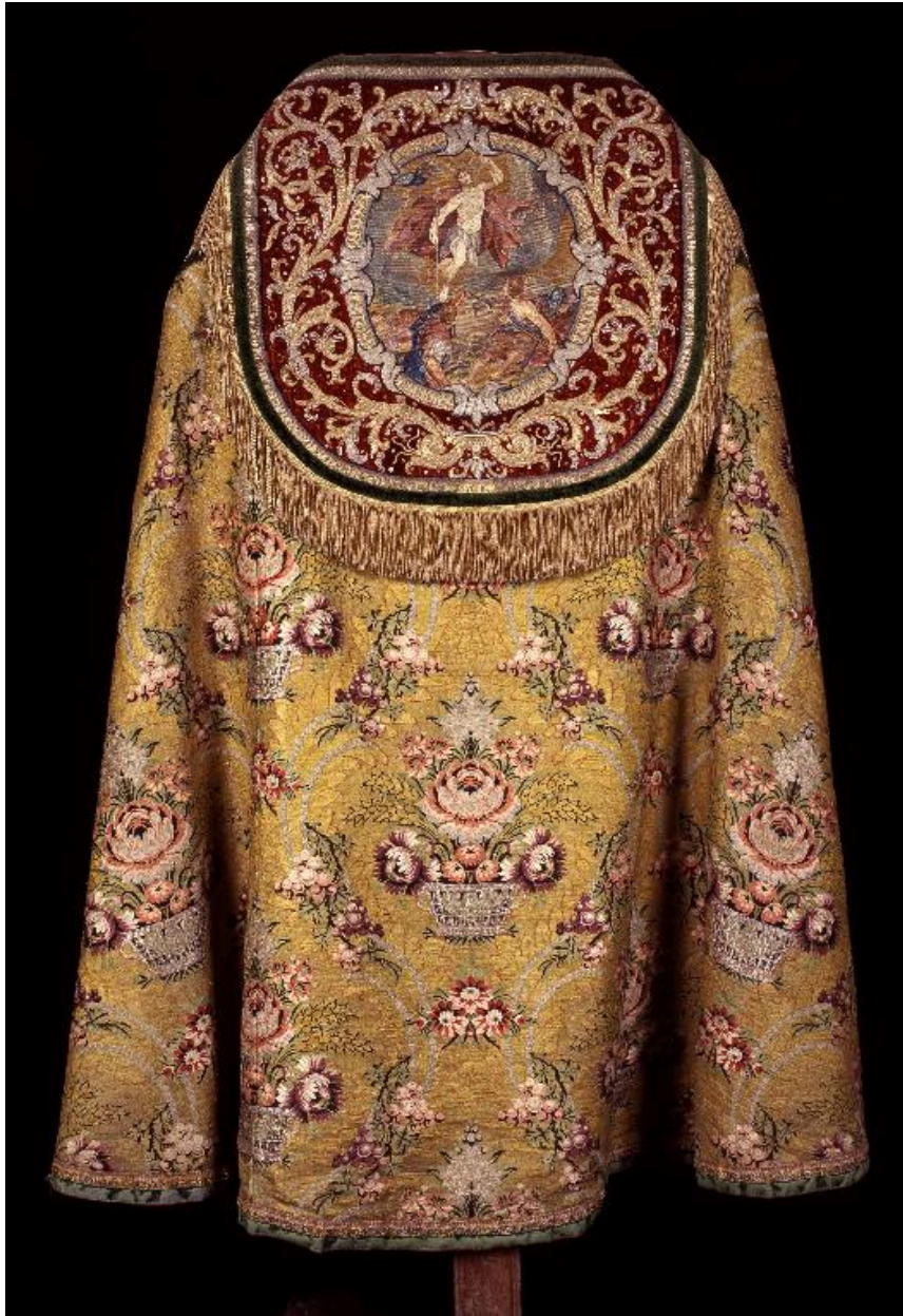
Vue du dos de la chape avec le chaperon illustrant la Résurrection.