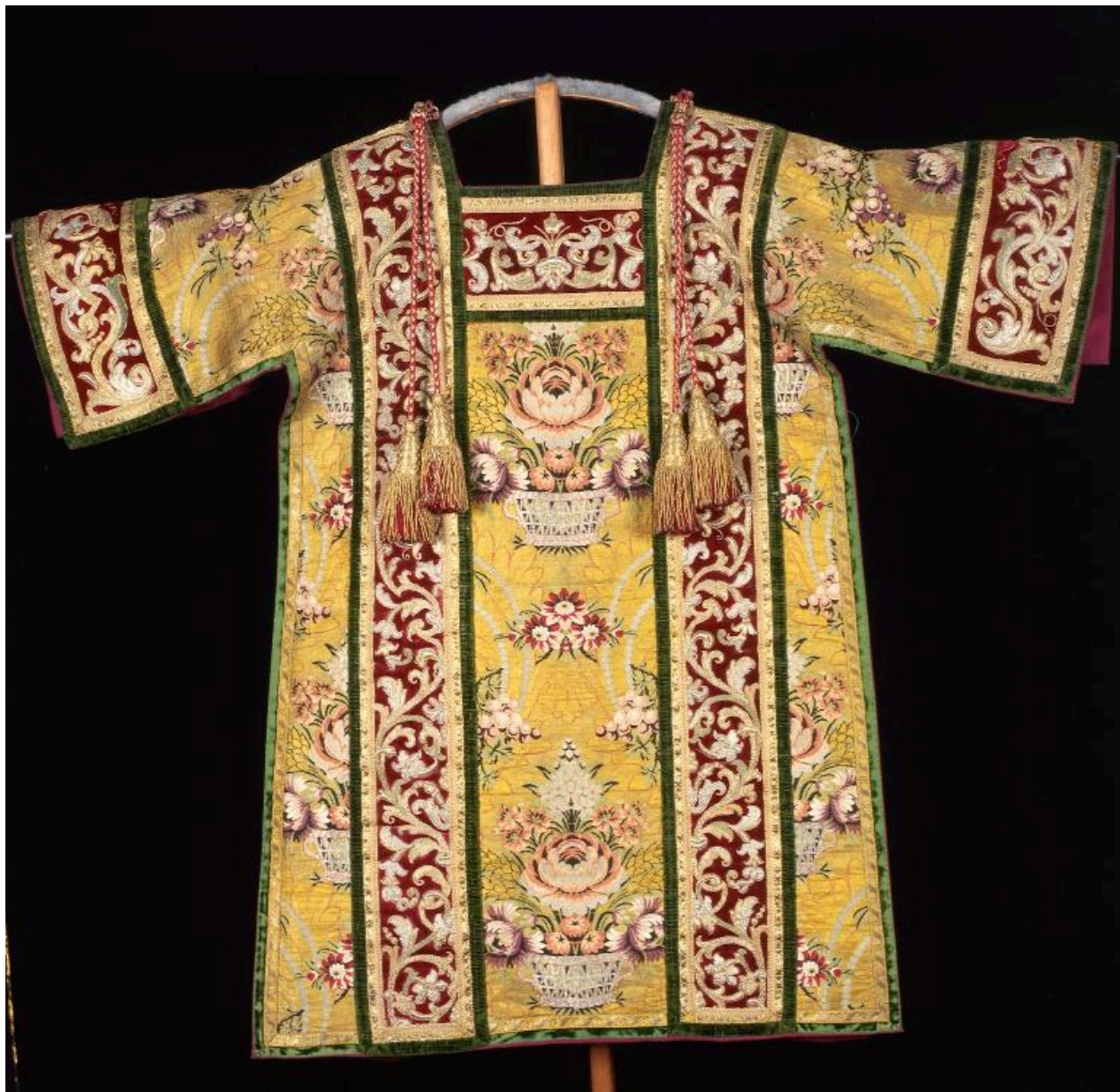
Vue de l'une des dalmatiques, de dos.