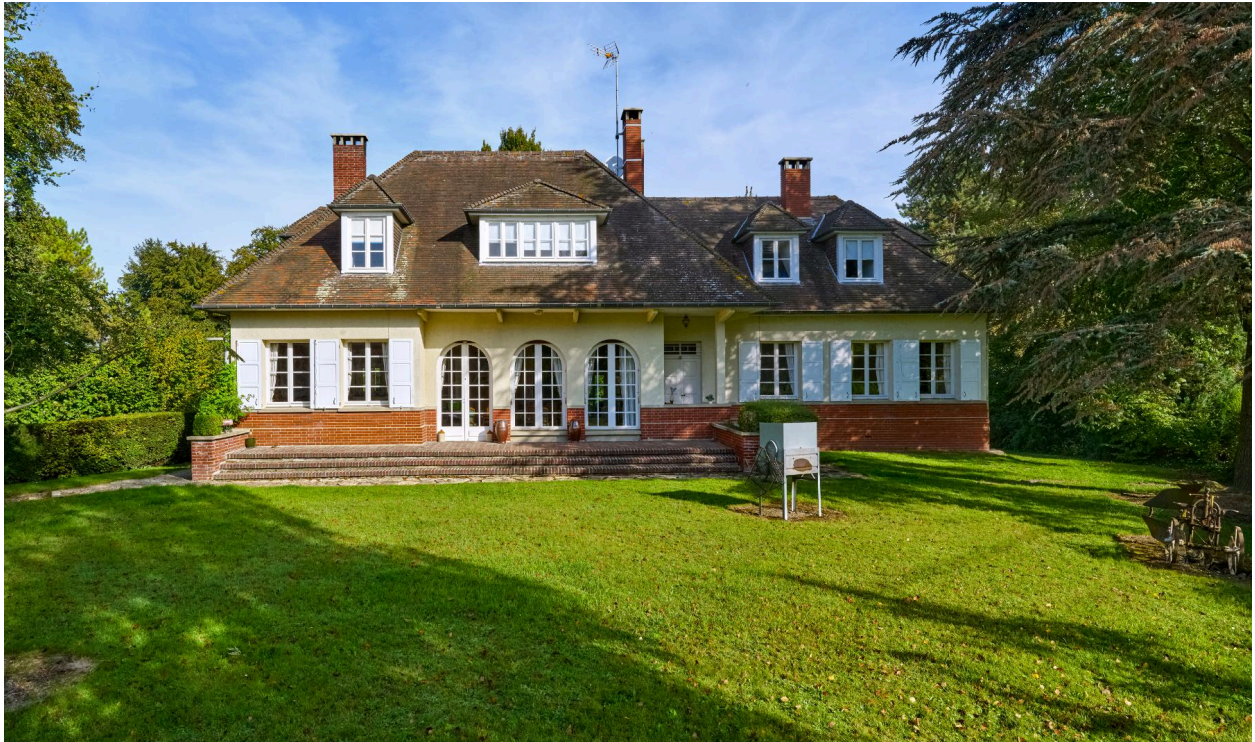
Vue sud-est de la maison.