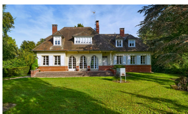
Vue sud-est de la maison.

Phot. Thierry Lefébure IVR32_20238000583NUCA