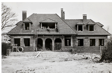
Commune de Fontaine-sur-Somme. Reconstruction de la maison De Santeul par Jean Hubert photographe à Amiens, 1er avril 1953 (AD Somme ; 1272 W 515).

Repro. Thierry Lefébure IVR32_20248000045NUCA