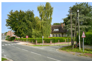
Vue de la maison dans son environnement prise depuis le sud-est.

Repro. Thierry Lefébure IVR32_20248000047NUCA