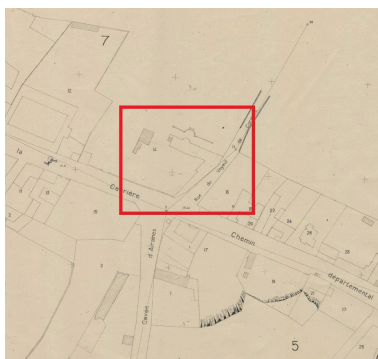
Destruction du château rue de la carrière, fond de plan de Fontaine-sur-Somme, Commissariat à la Reconstruction Immobilière, Plan des Îlots sinistrés, 1942 (AD Somme ; 70W CP 39 1 ZH323).

Repro. Archives départementales de la Somme IVR32_20238005209NUCA