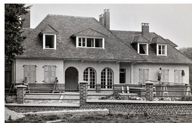
Commune de Fontaine-sur-Somme. Maison De Santeul reconstruite, par Jean Hubert, photographe à Amiens, 9 septembre 1953 (AD Somme ; 1272 W 515).

Repro. Thierry Lefébure IVR32_20248000046NUCA