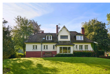
Vue nord-ouest de la maison.

IVR32_20238000585NUCA