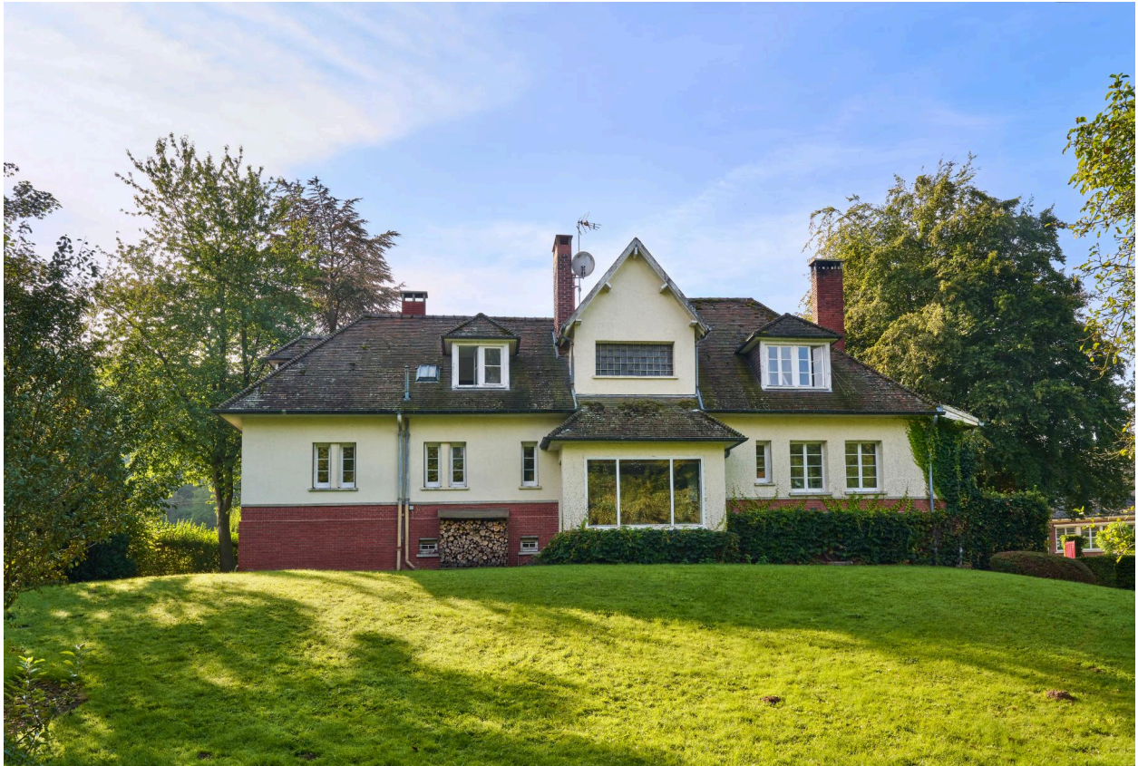
Vue nord-ouest de la maison.