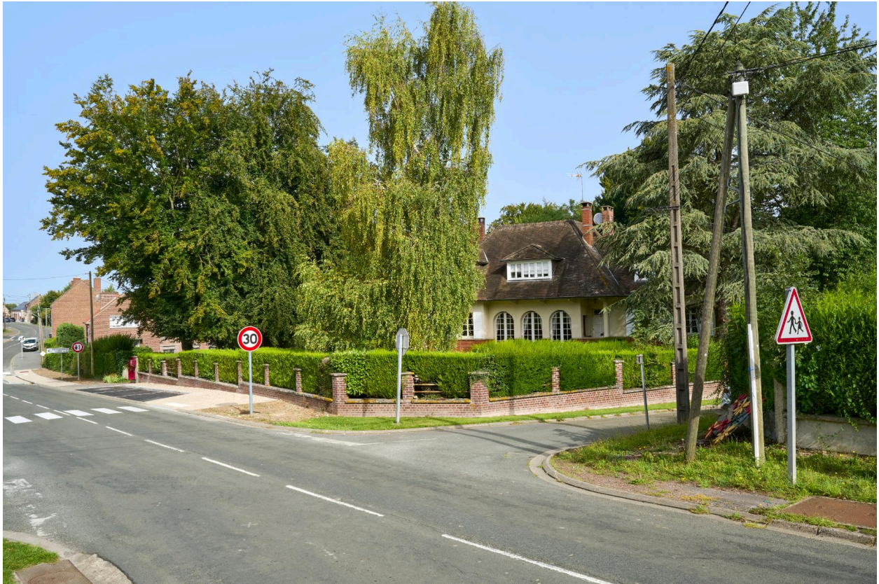
Vue de la maison dans son environnement prise depuis le sud-est.