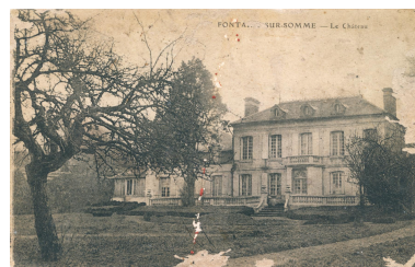
Commune de Fontaine-sur-Somme, demeure dénommée Le Château, [ca 1905] (coll. part).

Repro. Archives départementales de la Somme IVR32_20238005215NUCA