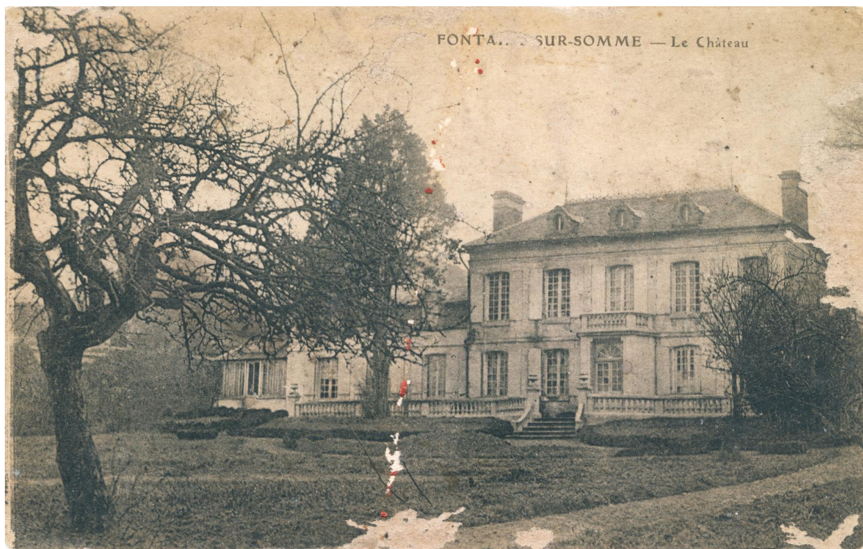
Commune de Fontaine-sur-Somme, demeure dénommée Le Château, [ca 1905].