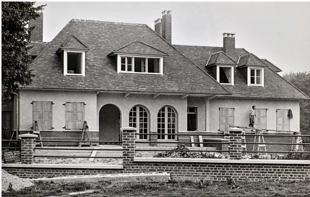
Commune de Fontaine-sur-Somme. Maison De Santeul reconstruite, par Jean Hubert, photographe à Amiens, 9 septembre 1953 (AD Somme ; 1272 W 515).