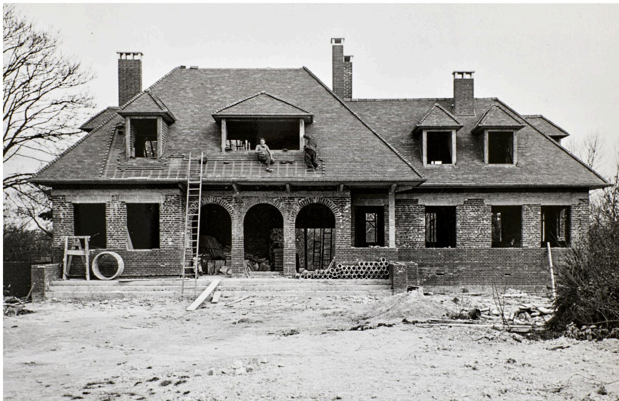
Commune de Fontaine-sur-Somme. Reconstruction de la maison De Santeul par Jean Hubert photographe à Amiens, 1er avril 1953 (AD Somme ; 1272 W 515).