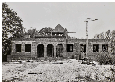
Commune de Fontaine-sur-Somme. Reconstruction de la maison De Santeul, depuis la rue de la carrière, par Jean Hubert, photographe à Amiens, 14 octobre 1952 (AD Somme ; 1272 W 515).

Repro. Thierry Lefébure IVR32_20238000282NUCA