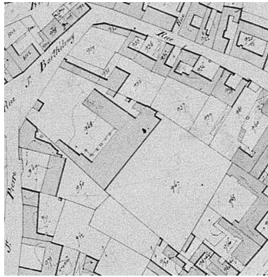
Extrait du cadastre napoléonien (DGI). IVR22_20096000555NUCA