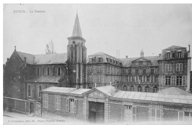
Le pensionnat, avant 1914 (AP). IVR22_19856000490XB