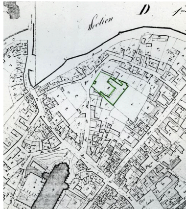
Plan de situation. Extrait du plan cadastral de 1831, section H 948. IVR22_20096000433NUCA