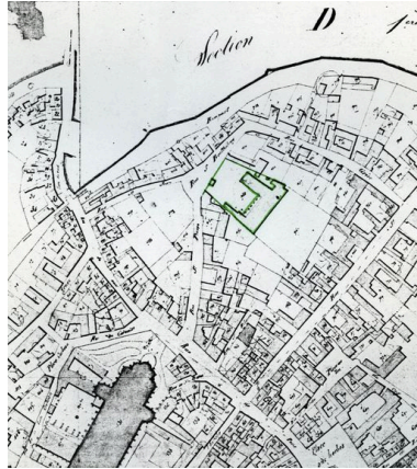
Plan de situation. Extrait du plan cadastral de 1831, section H 948.