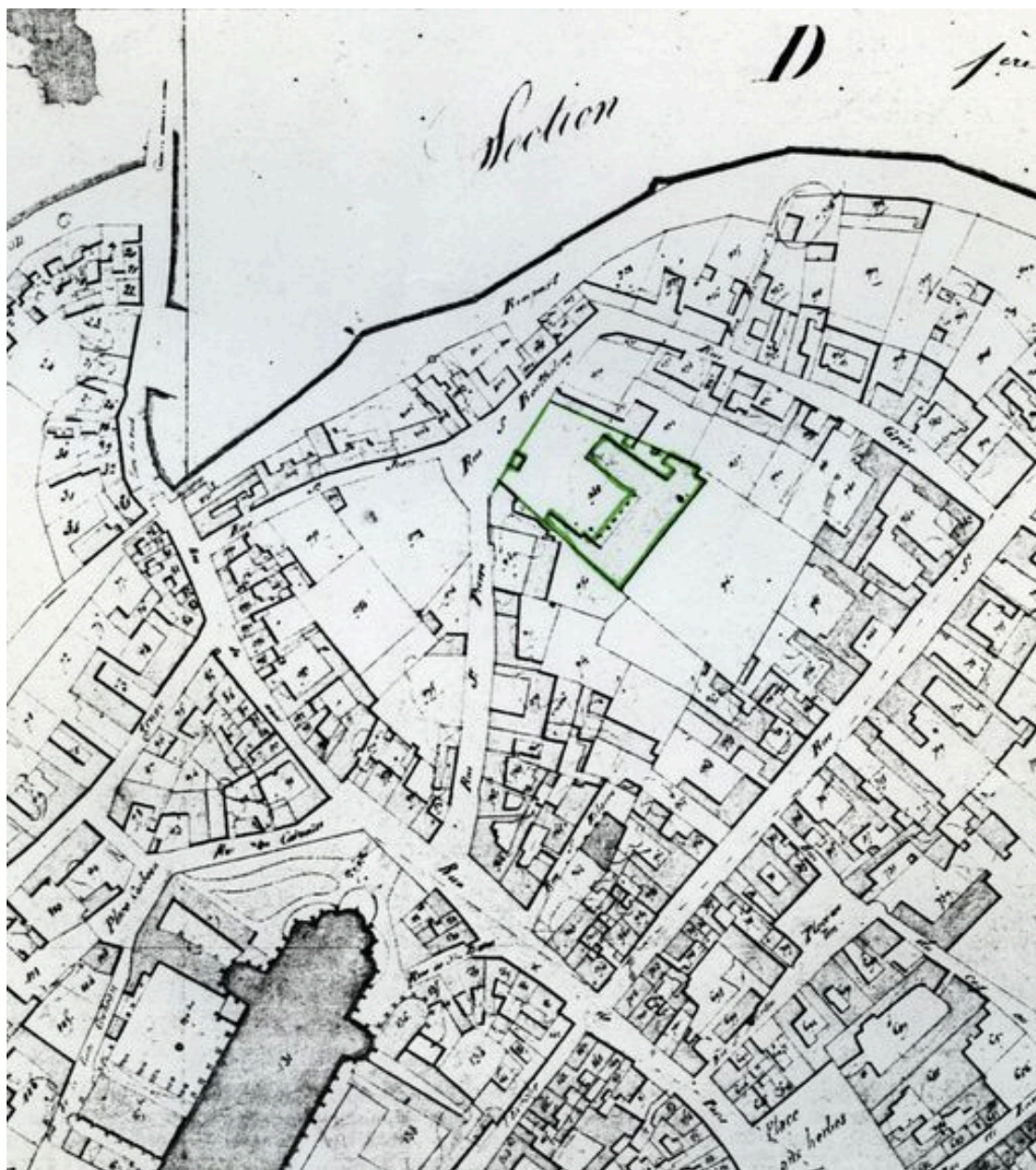
Plan de situation. Extrait du plan cadastral de 1831, section H 948.