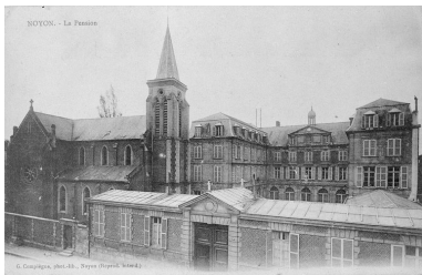
Le pensionnat, avant 1914 (AP).