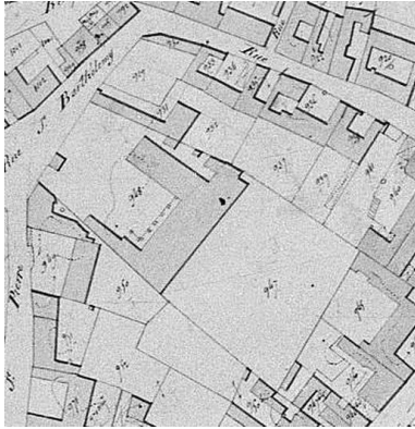
Extrait du cadastre napoléonien (DGI). IVR22_20096000555NUCA