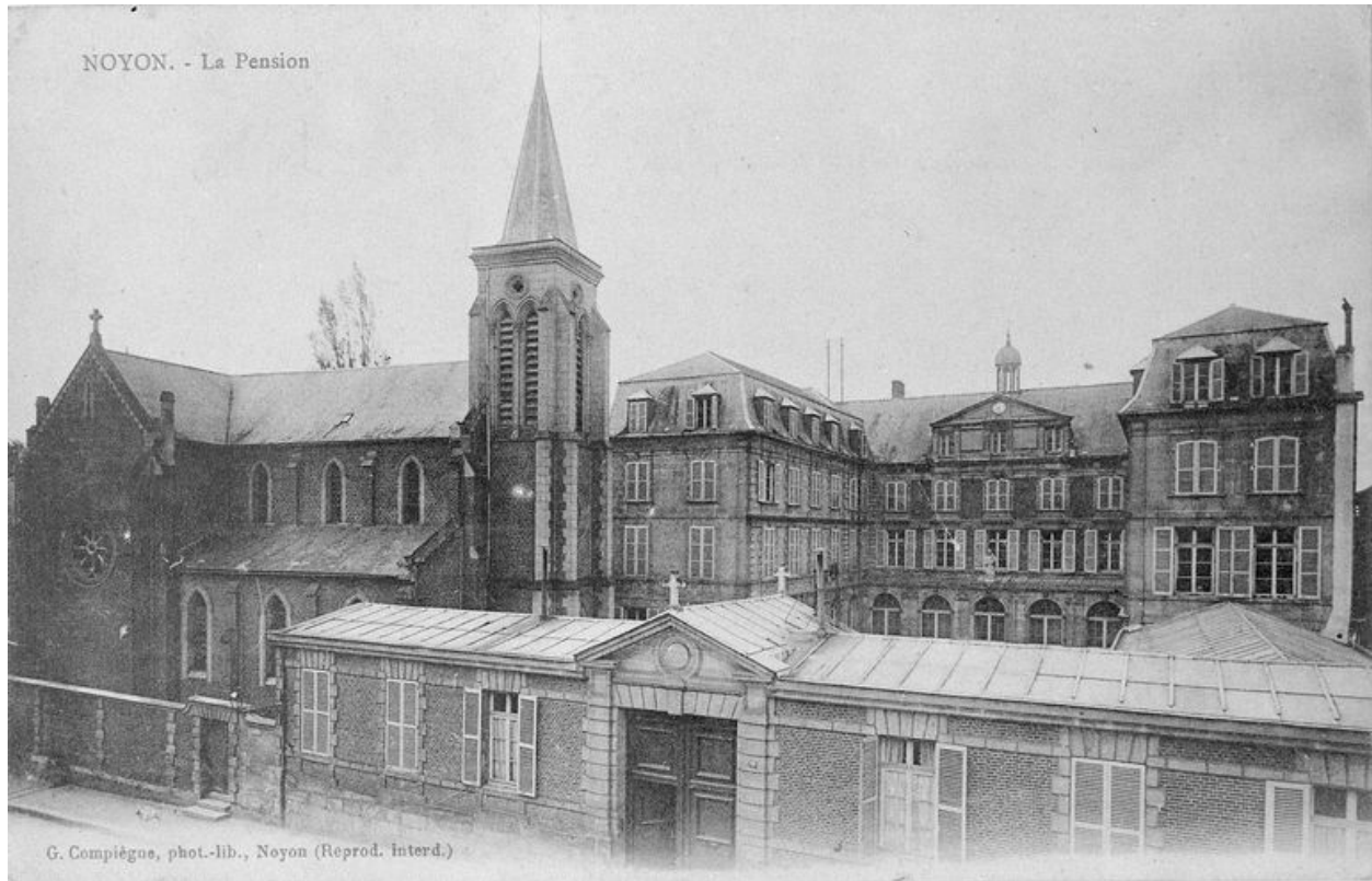
Le pensionnat, avant 1914.