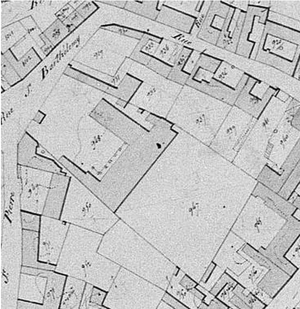
Extrait du cadastre napoléonien (DGI).