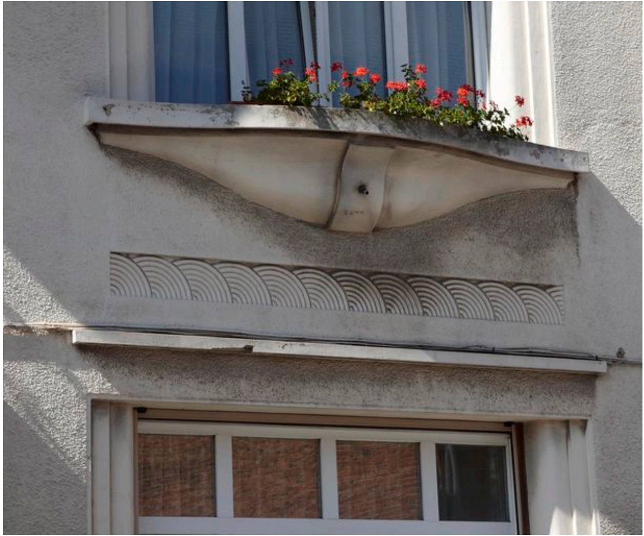
Vue sur l'allège à motifs semi-circulaires et de stries.