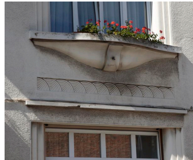
Vue sur l'allège à motifs semi-circulaires et de stries.