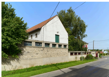
Vue est du bâtiment agricole, prise depuis la rue.

IVR32_20238000538NUCA