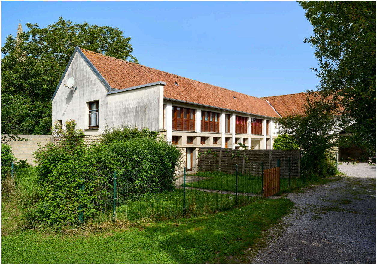
Vue sud des bâtiments agricoles, prise depuis la cour.