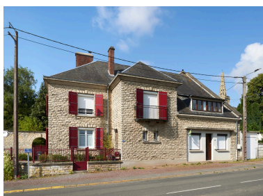
Vue nord de la maison d'habitation. IVR32_20238000535NUCA