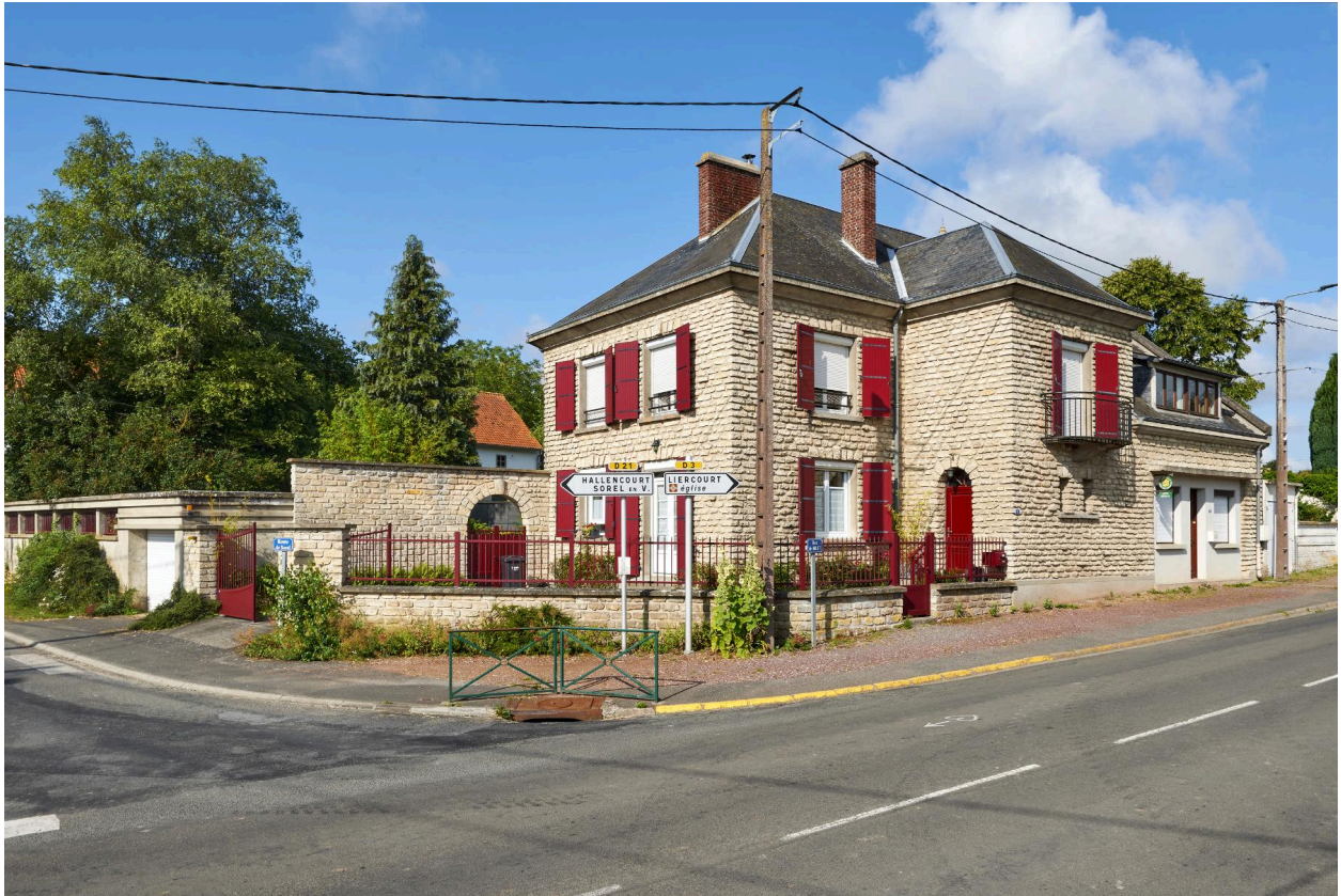
Vue nord-est de la maison d'habitation.