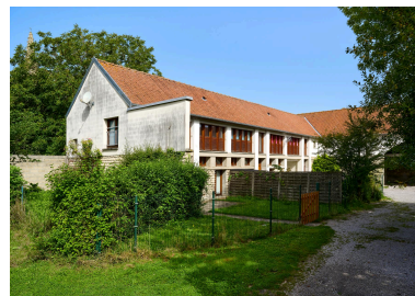
Vue sud des bâtiments agricoles, prise depuis la cour.

IVR32_20238000539NUCA