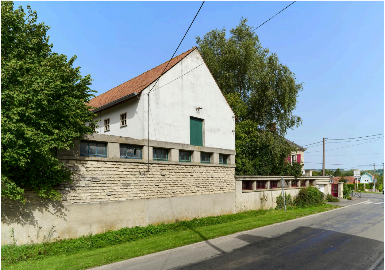
Vue est du bâtiment agricole, prise depuis la rue.