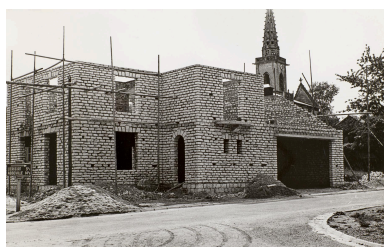
Reconstruction de la ferme Dulin, maison d'habitation, vue depuis la rue de Haut