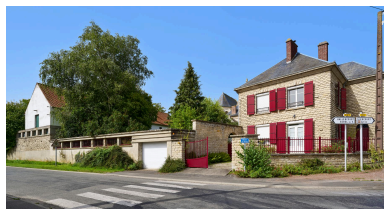
Vue est de la maison d'habitation et d'un bâtiment agricole.

IVR32_20238000538NUCA