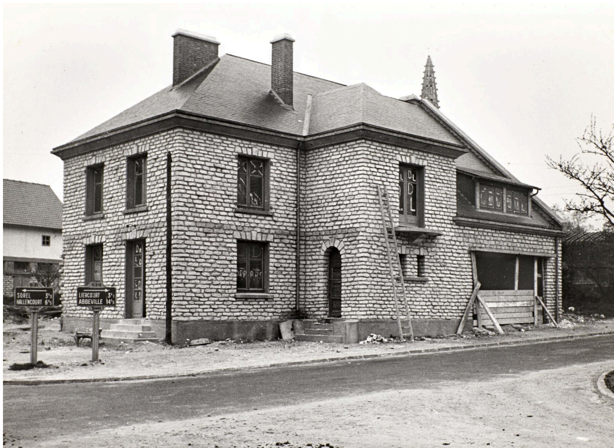
Maison de la ferme Dulin, vue depuis la rue de Haut, par Jean Hubert photographe à Amiens, 19 avril 1951 (AD Somme ; 1272 W 515).