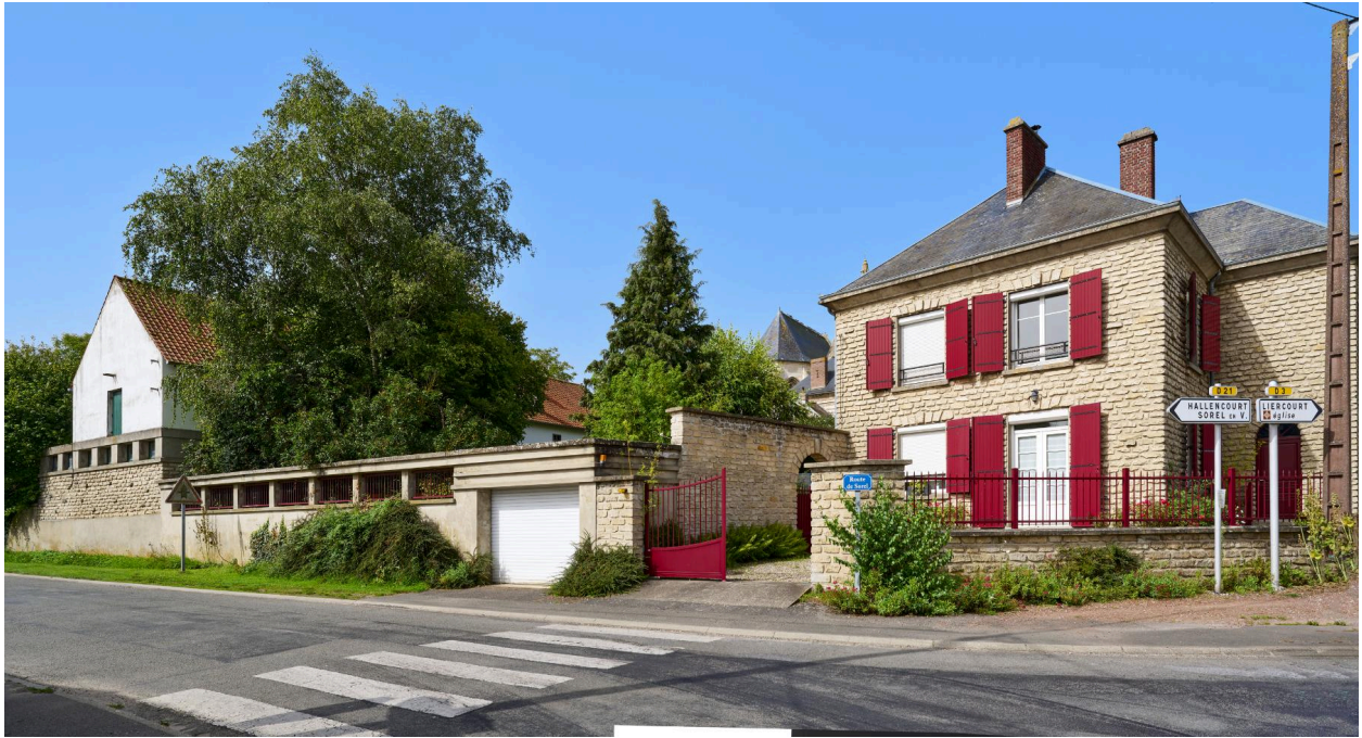
Vue est de la maison d'habitation et d'un bâtiment agricole.