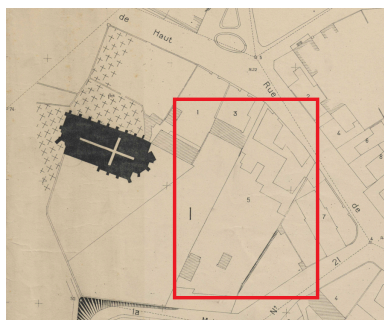
Destruction de la ferme Dulin, fond de plan, topographie, Fontaine-sur-Somme, Commissariat à la Reconstruction Immobilière, Feuille 1, 1942