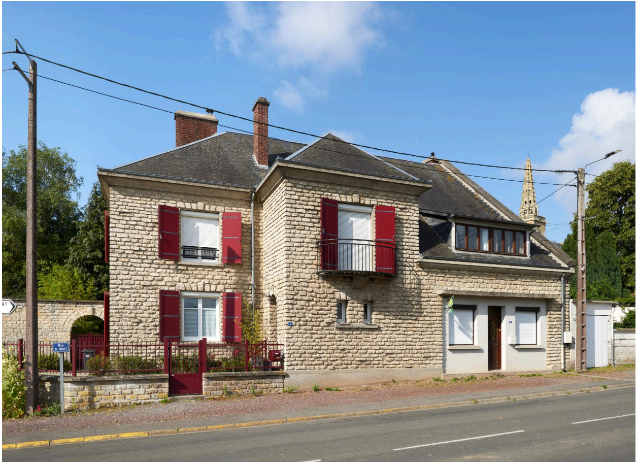
Vue nord de la maison d'habitation.