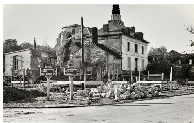
Emplacement de la ferme Dulin, entre la rue de Haut et la route de Sorel