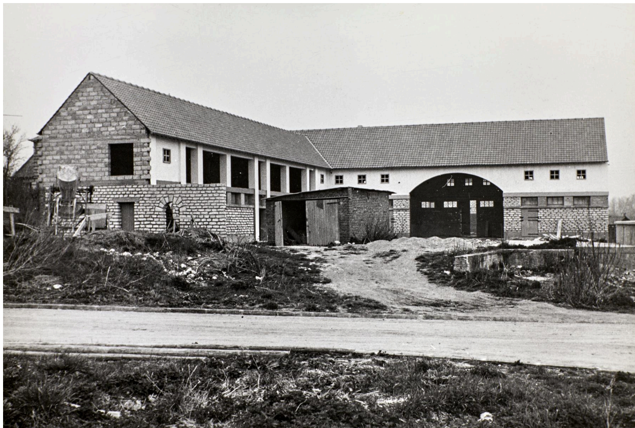
Ferme Dulin, bâtiment agricole, vue depuis la rue de la Motte, par Jean Hubert photographe à Amiens, 19 avril 1951 (AD Somme ; 1272 W 515).