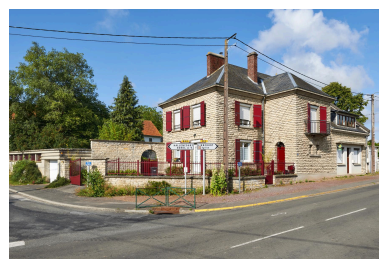
Vue nord-est de la maison d'habitation. IVR32_20238000536NUCA