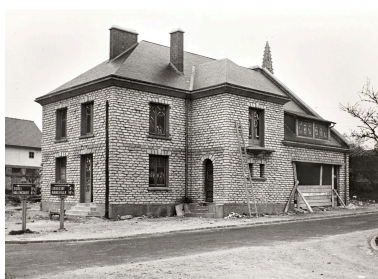
Maison de la ferme Dulin, vue depuis la rue de Haut, 19 avril 1951. IVR32_20248000017NUCA