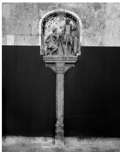
Vue de la présentation actuelle du monument.