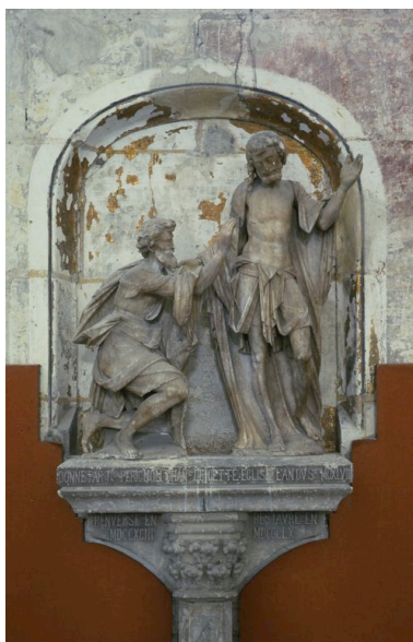
Vue générale de la partie supérieure. IVR22_20010202732XA