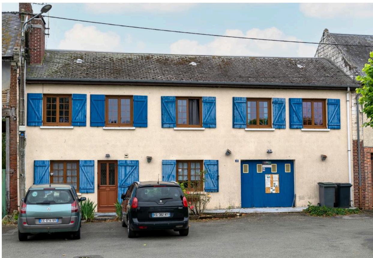
Ancien café Patte-Liger, n°48 rue Principale, vue depuis l'est.