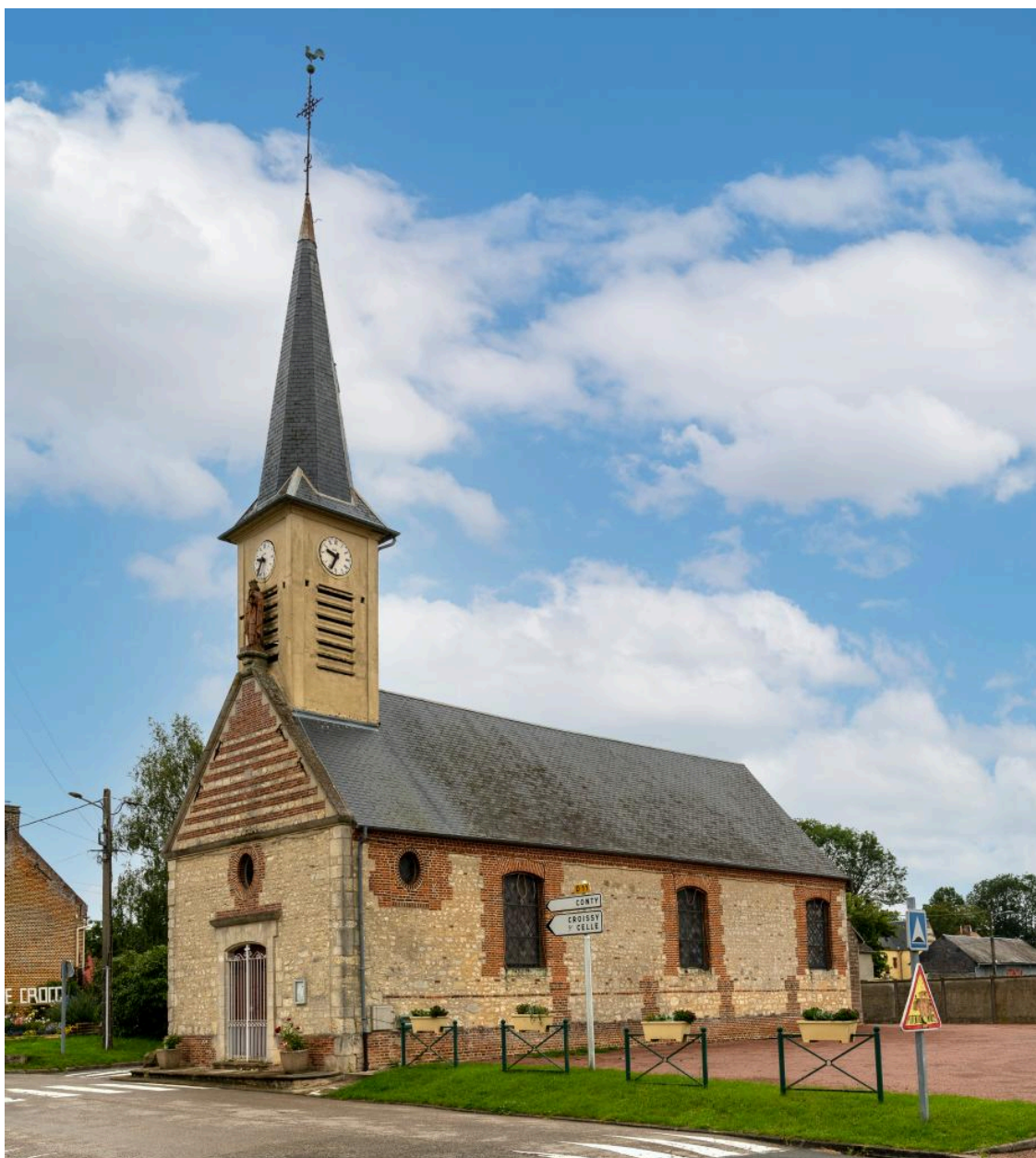
Église Saint-Louis, vue depuis le sud-est.