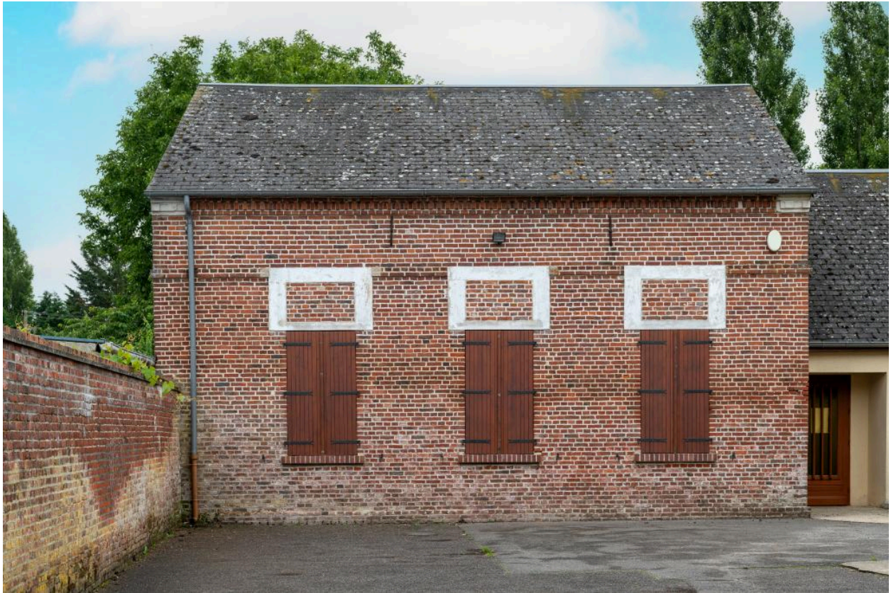
Bâtiment d'école derrière la mairie, 2e moitié 19e siècle, vue depuis l'est.