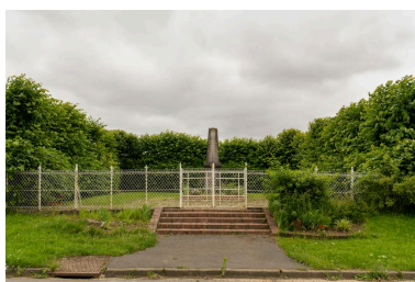
Vue générale depuis l'ouest de l'enclos du monument aux morts de la guerre 1914-1918.