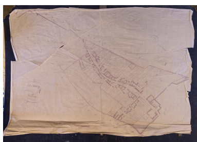
Calque du cadastre dit napoléonien, milieu 19e siècle (coll. communale). IVR32_20216000840NUCA