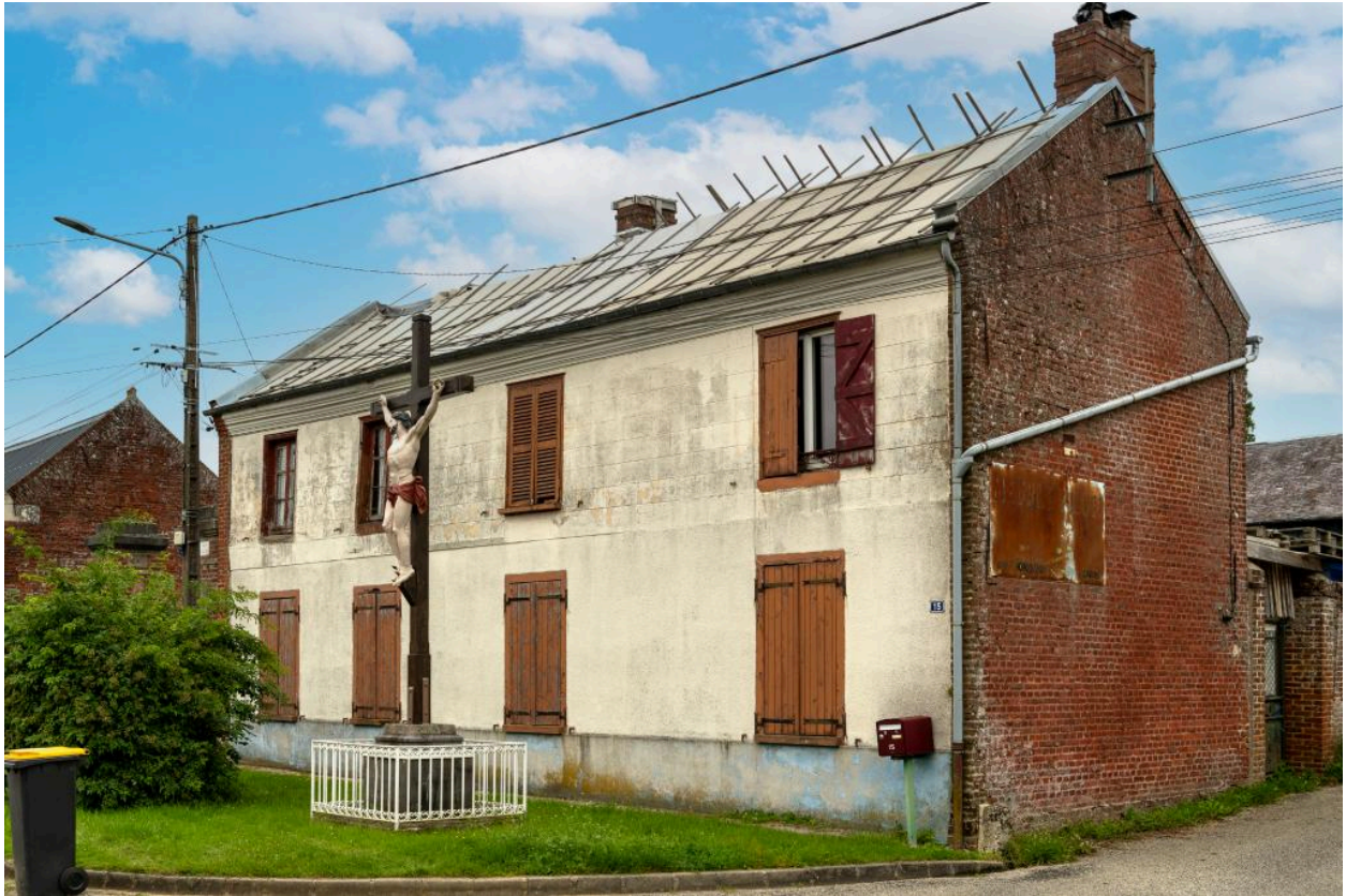
Logis n°3 rue Principale avec Christ en Croix érigé en 1900 au décès d'Emile Lecomte, propriétaire de l'usine de tissage, vue depuis le sud ouest.