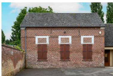
Bâtiment d'école derrière la mairie, 2e moitié 19e siècle, vue depuis l'est.