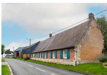
Logis ayant pu appartenir à l'ancien château (ferme?), 18e siècle, n°1 rue de l'Église, vue depuis le sud-est.