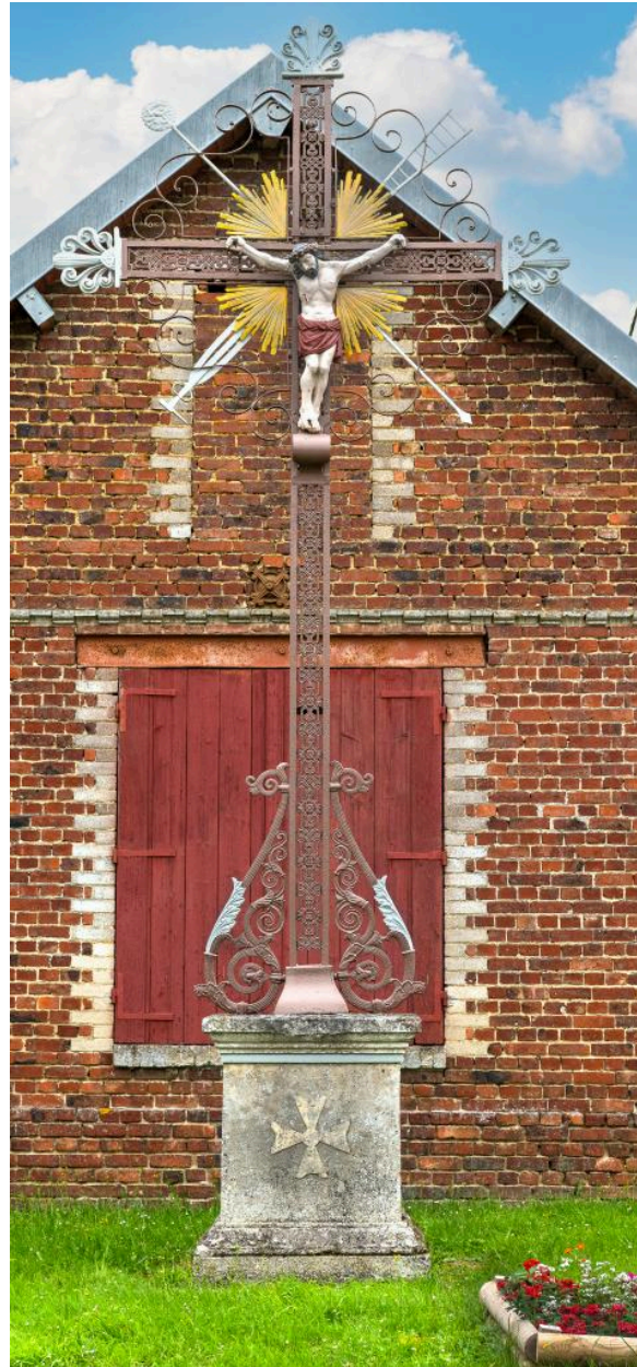
Croix de chemin en face du n°52 rue Principale, fer et fonte, milieu 19e siècle.