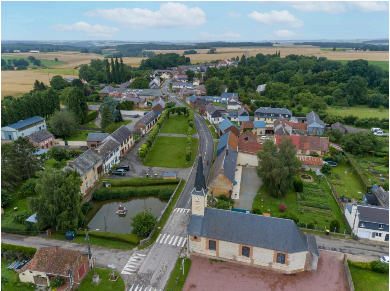
Vue générale du village depuis la partie sud de la rue Principale.