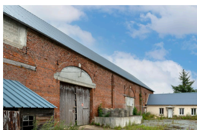
Grange ayant abrité le théâtre aux armées pendant la Première Guerre Mondiale, construite en 1853 (date portée), vue depuis le sud-ouest.