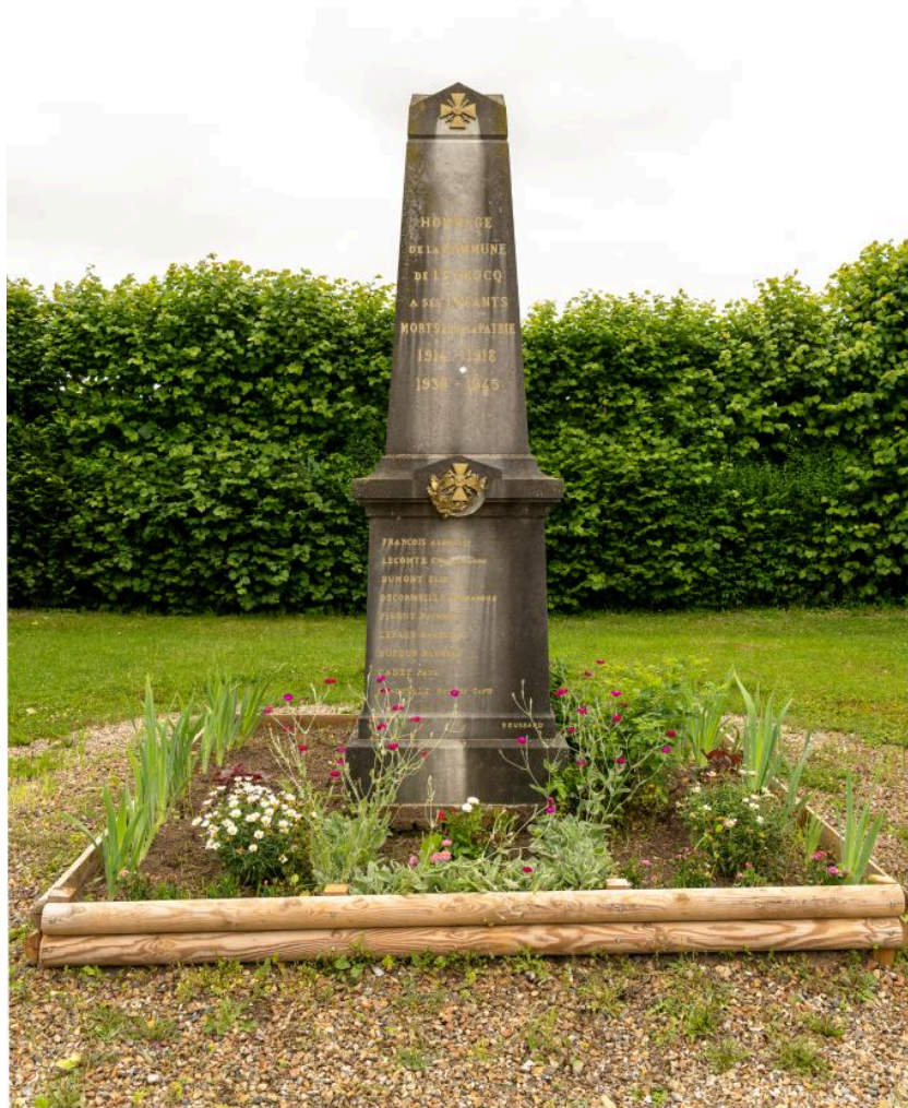
Monument aux morts de la guerre 1914-1918, érigé vers 1920, en face du n°54 rue Principale, vue depuis l'ouest.