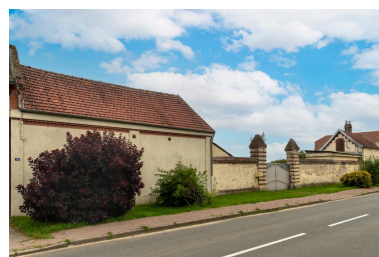
Entrée et anciens bâtiments de l'usine Lecomte, vue depuis le sud-est. IVR32_20216000876NUCA