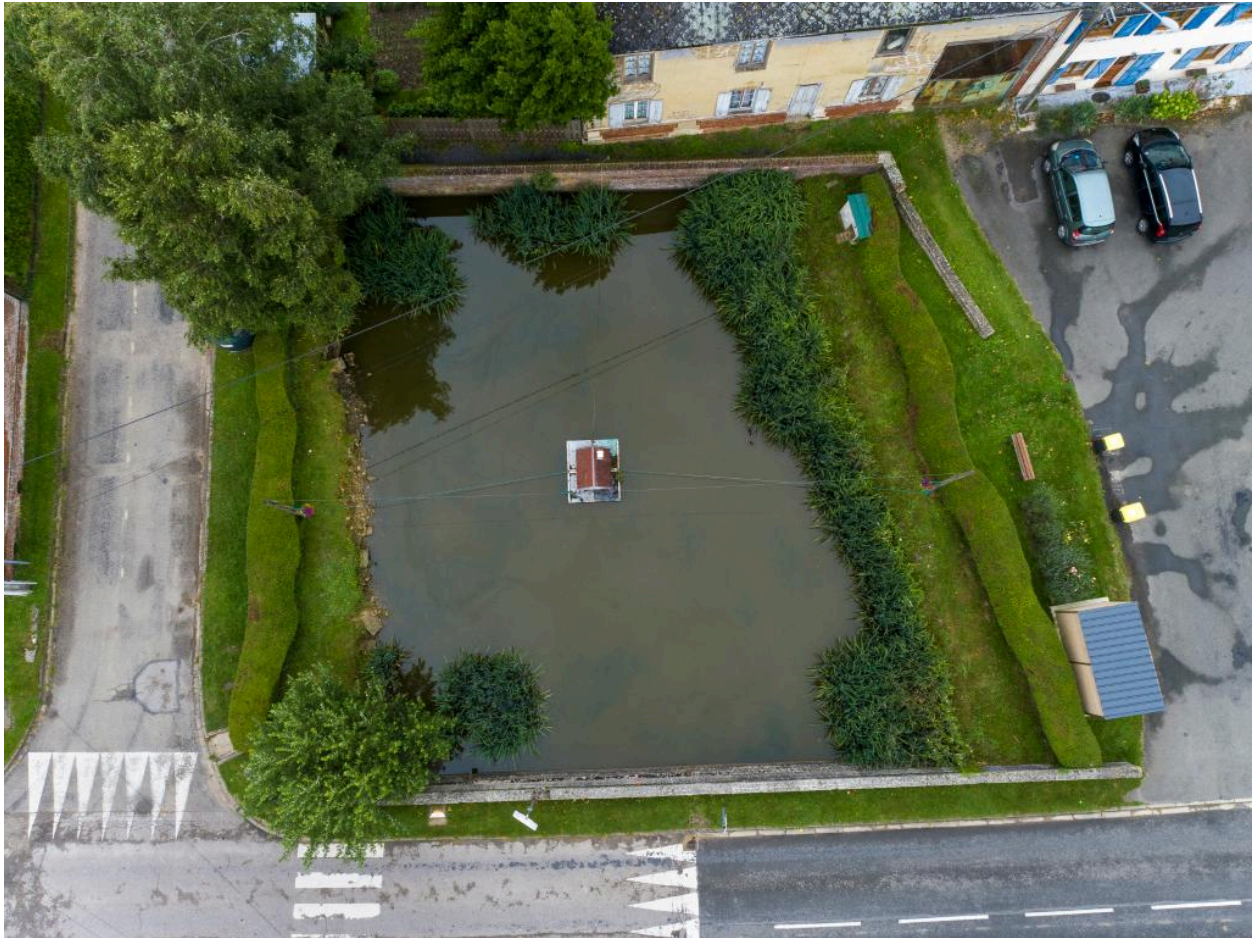
Vue aérienne de la mare de la place du village.