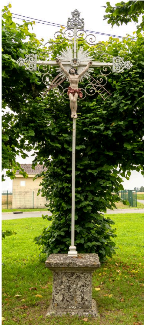
Croix de chemin à la sortie nord du village, fer et fonte, 2e moitié 19e siècle (?), vue depuis le sud.