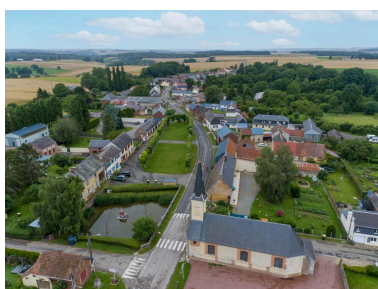
Vue générale du village depuis la partie sud de la rue Principale. IVR32_20216000901NUCA