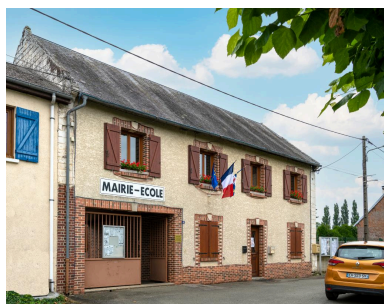
Mairie-école, vue depuis le sud-est. IVR32_20216000854NUCA