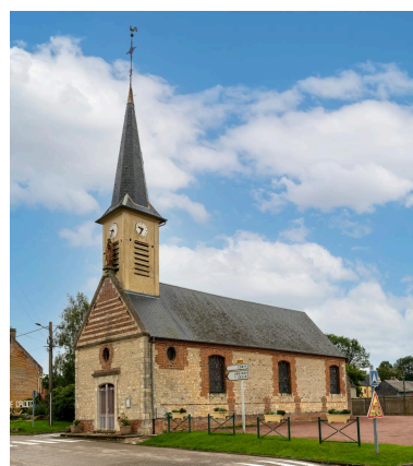
Église Saint-Louis, vue depuis le sud-est.