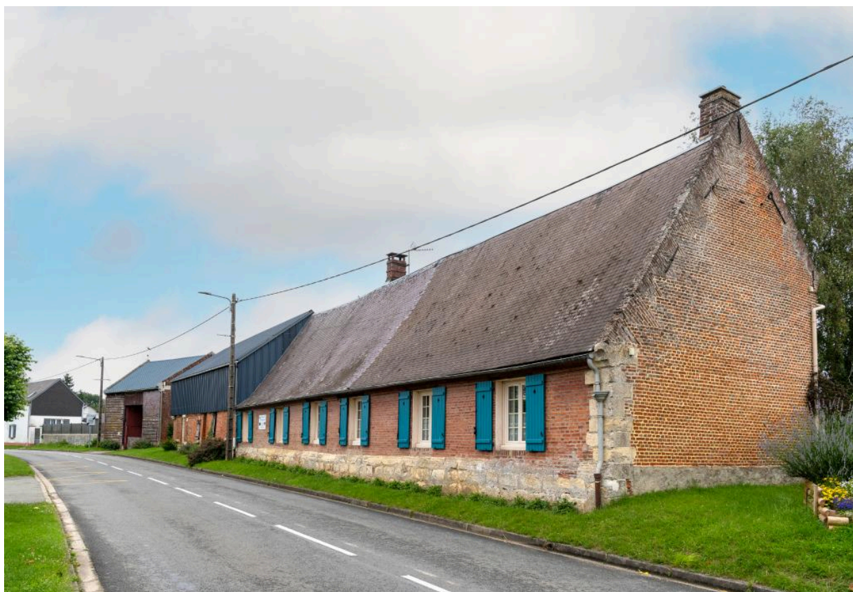
Logis ayant pu appartenir à l'ancien château (ferme?), 18e siècle, n°1 rue de l'Église, vue depuis le sud-est.