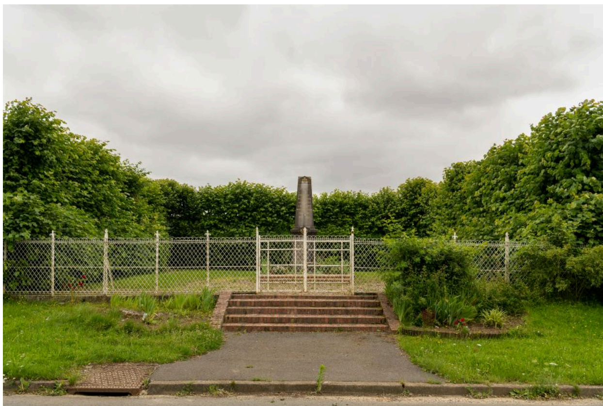
Vue générale depuis l'ouest de l'enclos du monument aux morts de la guerre 1914-1918.