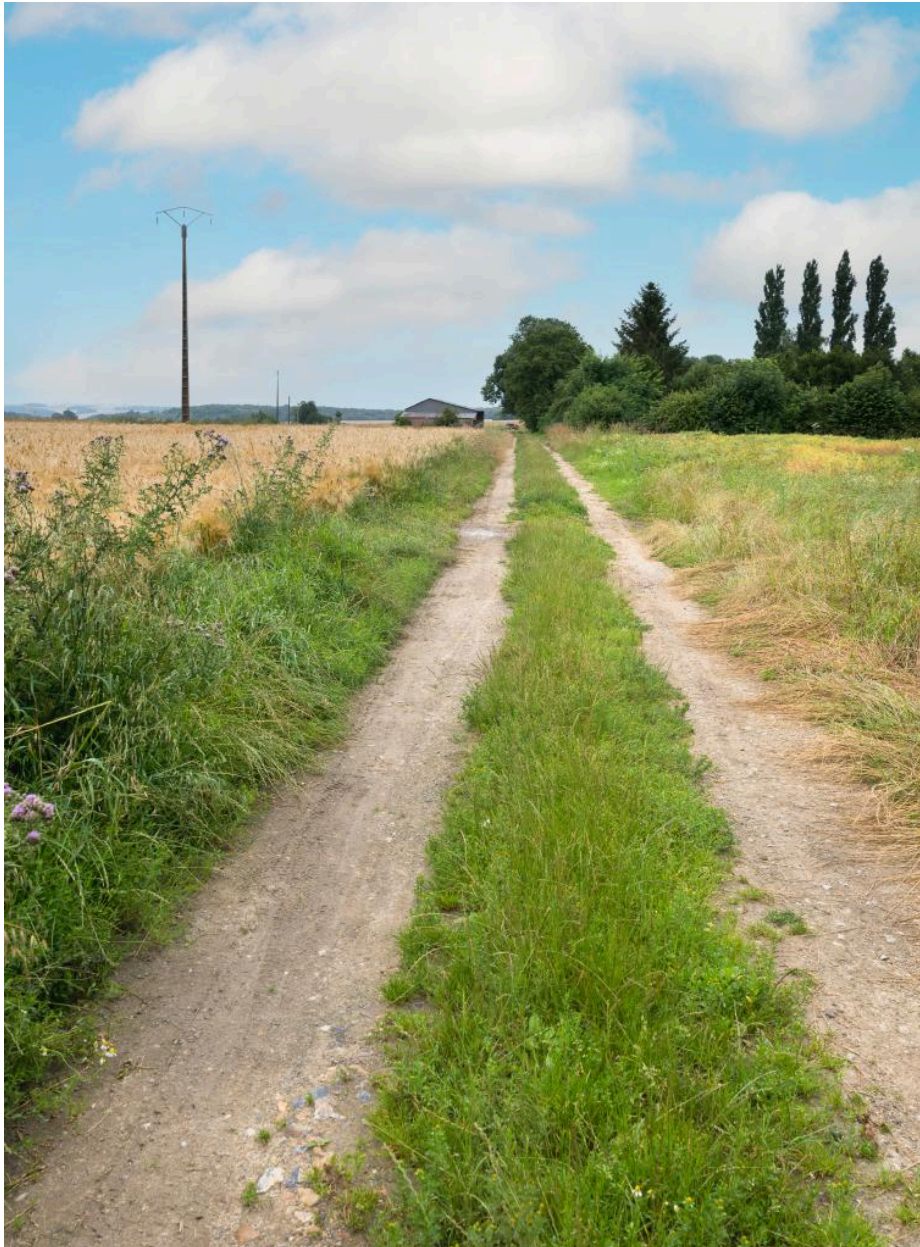
Chemin du tour de ville (section ouest du village), vue depuis le sud.