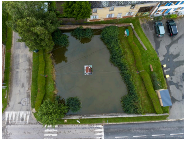
Vue aérienne de la mare de la place du village. IVR32_20216000903NUCA