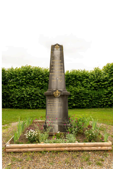
Monument aux morts de la guerre 1914-1918, érigé vers 1920, en face du n°54 rue Principale, vue depuis l'ouest. IVR32_20216000885NUCA