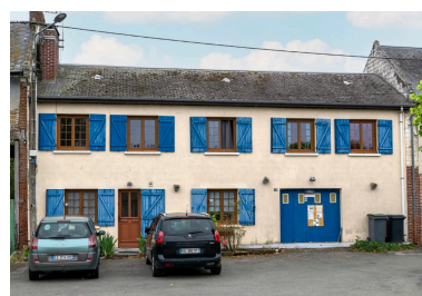
Ancien café Patte-Liger, n°48 rue Principale, vue depuis l'est. IVR32_20216000853NUCA