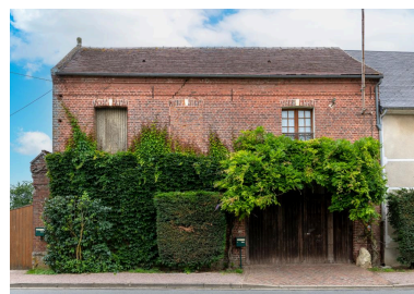
Ancienne mairie, n°24 rue Principale, vue depuis l'est.