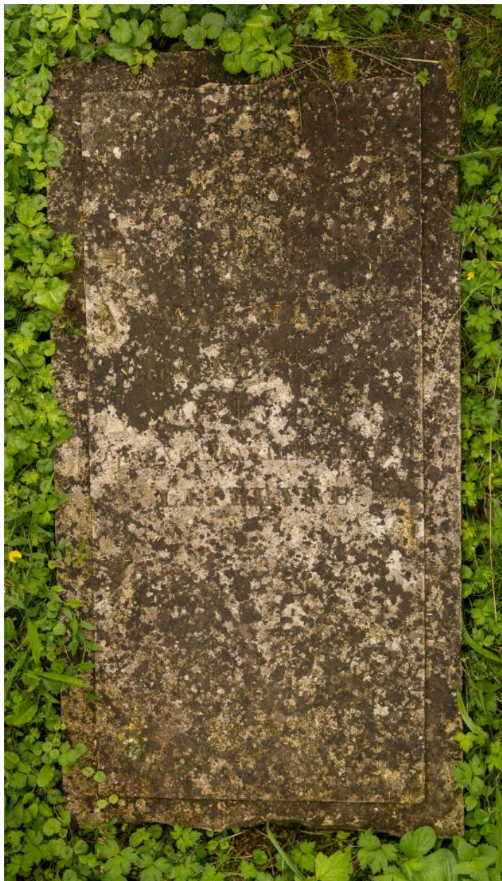
Plaque tombale d'Antoine Magnien décédé en 1834, située au pied de la croix de chemin à la sortie sud du village.