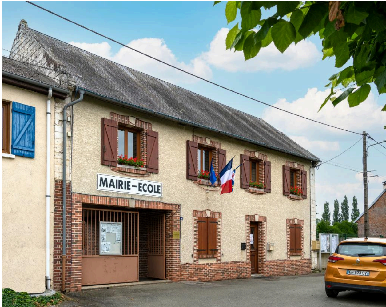
Mairie-école, vue depuis le sud-est.