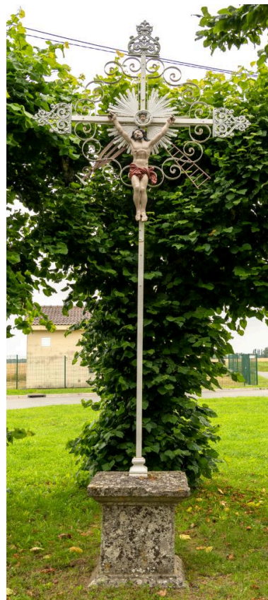
Croix de chemin à la sortie nord du village, fer et fonte, 2e moitié 19e siècle (?), vue depuis le sud.