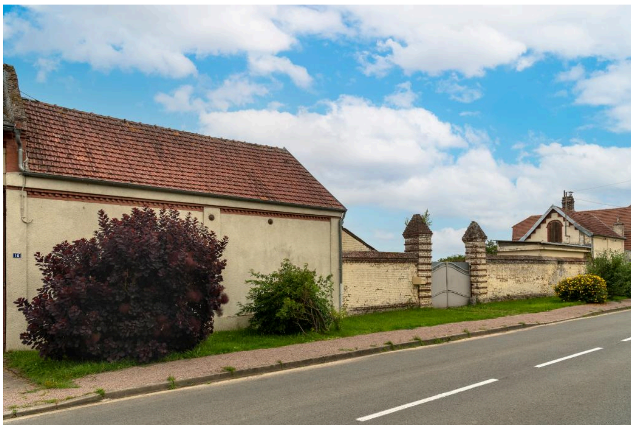
Entrée et anciens bâtiments de l'usine Lecomte, vue depuis le sud-est.