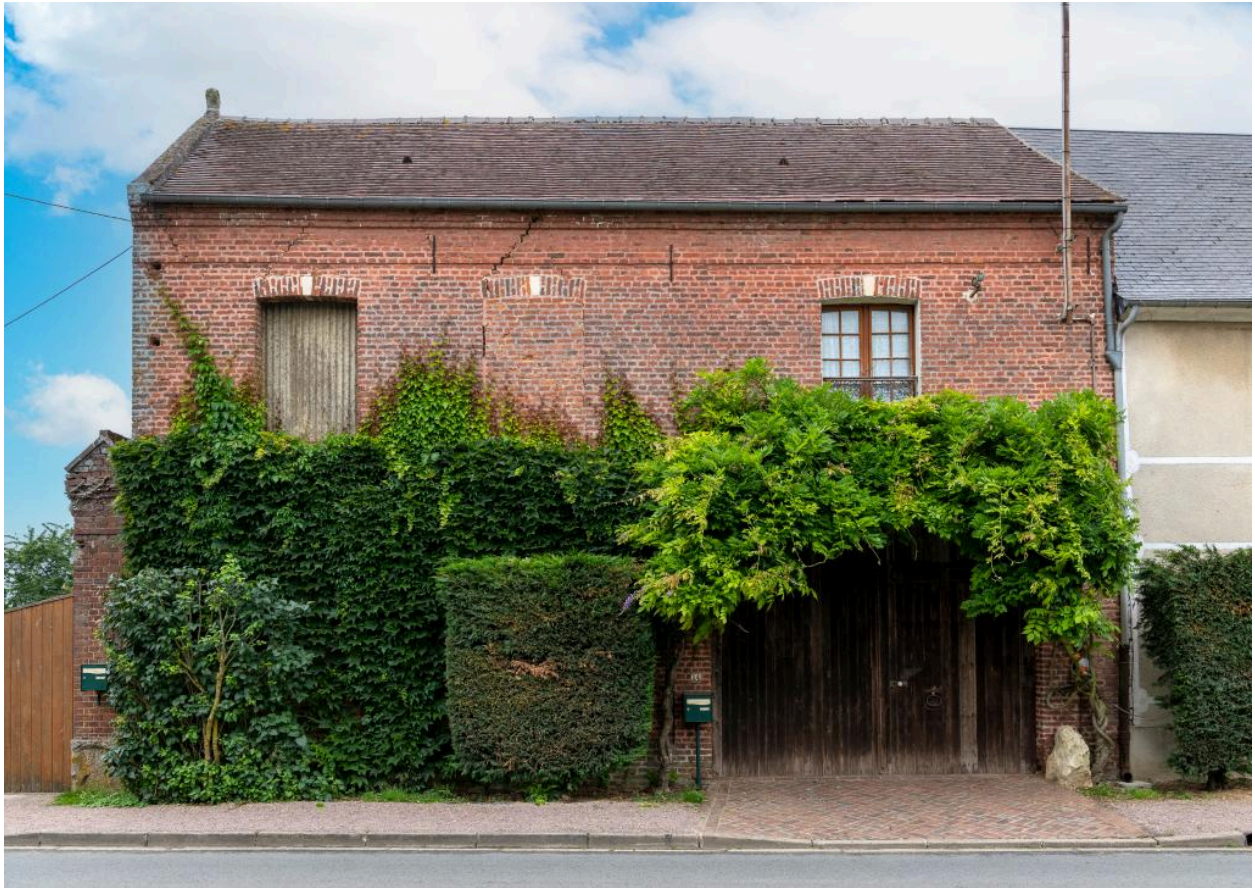
Ancienne mairie, n°24 rue Principale, vue depuis l'est.