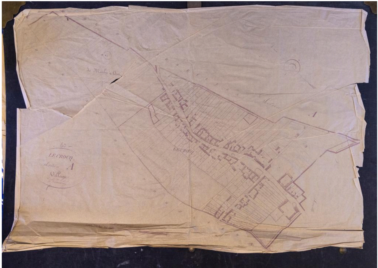
Calque du cadastre dit napoléonien, milieu 19e siècle (coll. communale).