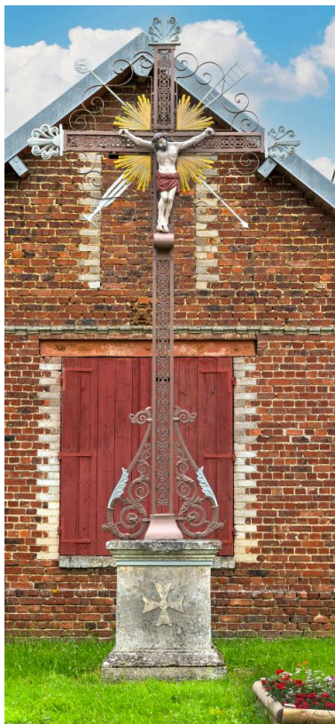
Croix de chemin en face du n°52 rue Principale, fer et fonte, milieu 19e siècle.