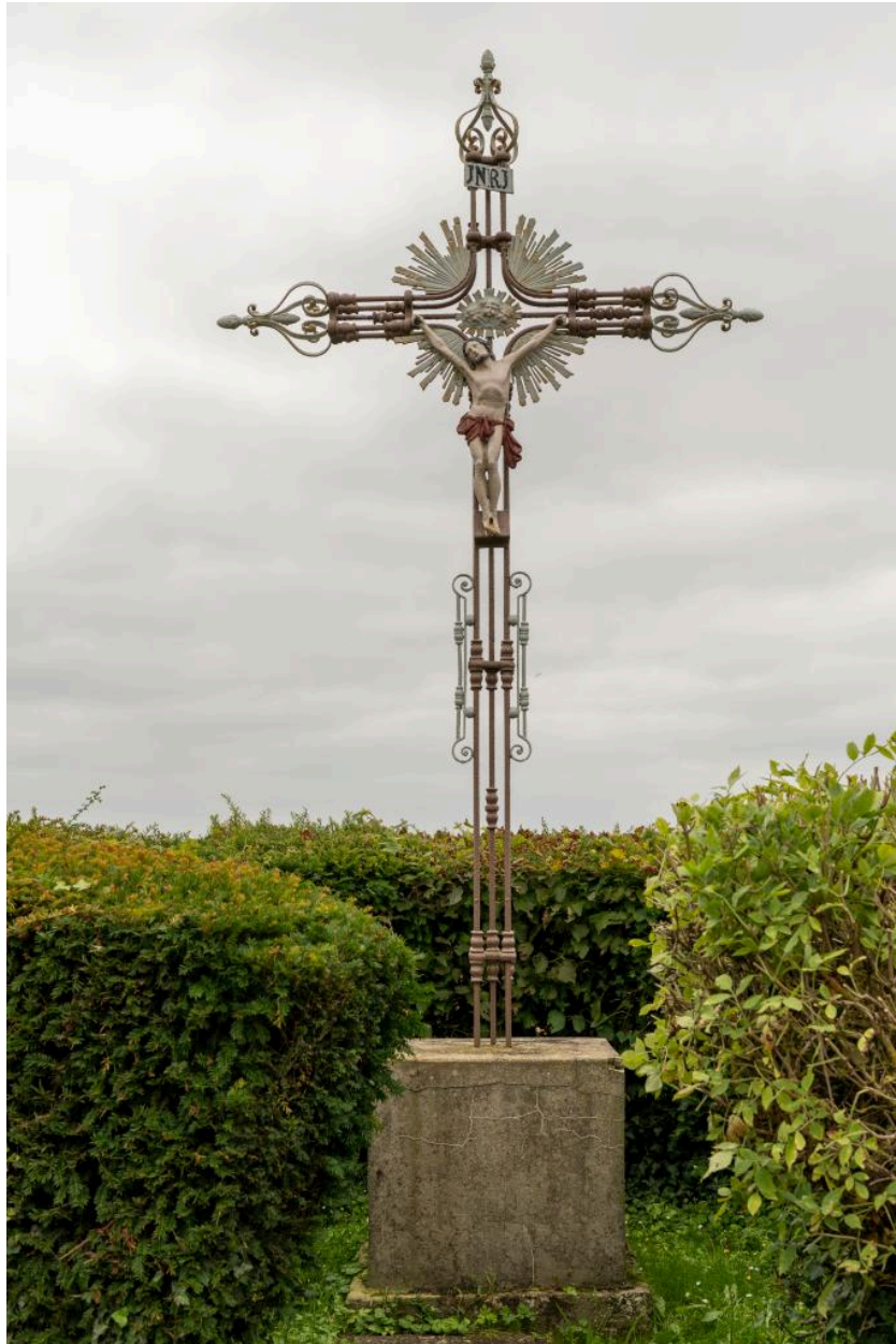
Croix de chemin à la sortie sud du village, fer et fonte, vue depuis le nord.