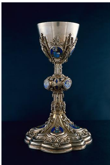
Calice, vue générale. IVR31_19876201223XA