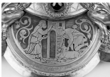
Pied, la Pâque.