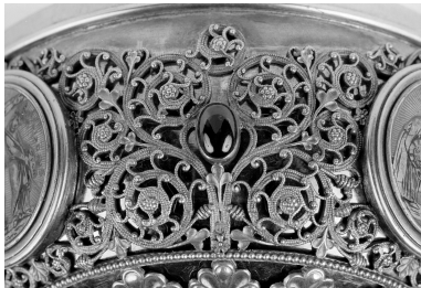
Calice, fausse coupe, faux filigrane, fausse granulation, vue extérieure.