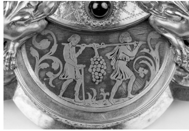
Pied, la grappe de la terre promise. IVR31_19876200492X