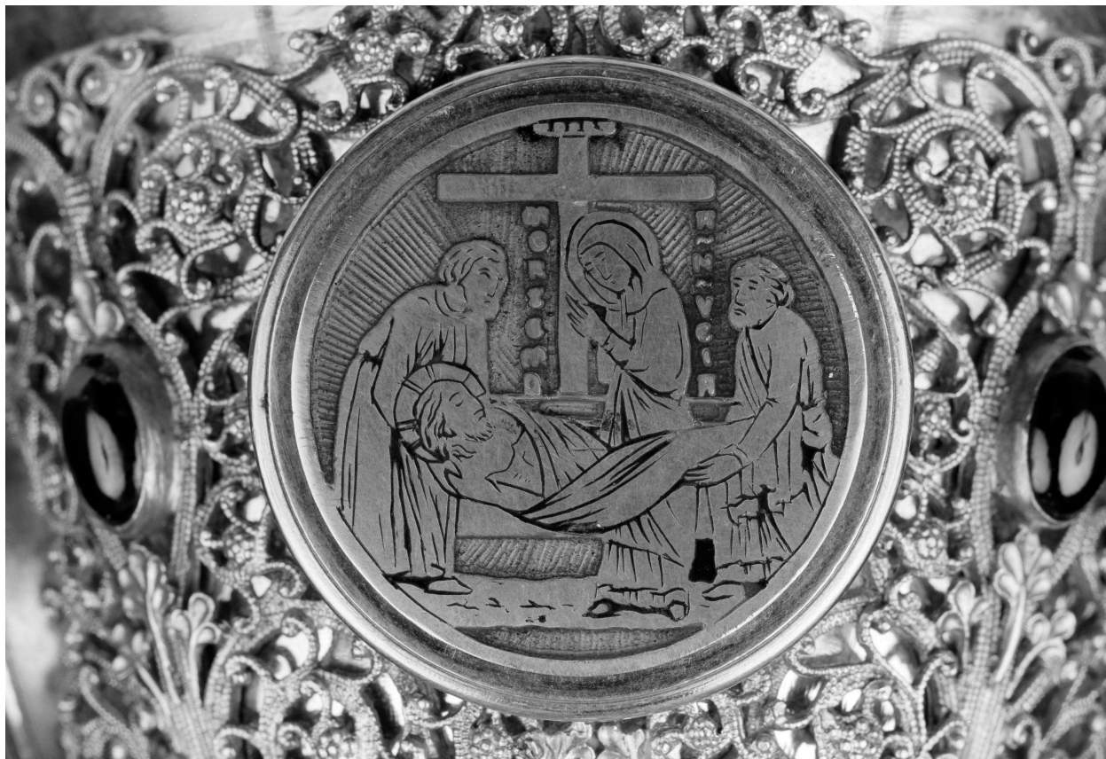
Calice, fausse coupe, coupe, Déploration.