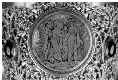
Calice, fausse coupe, Apparition à Thomas.