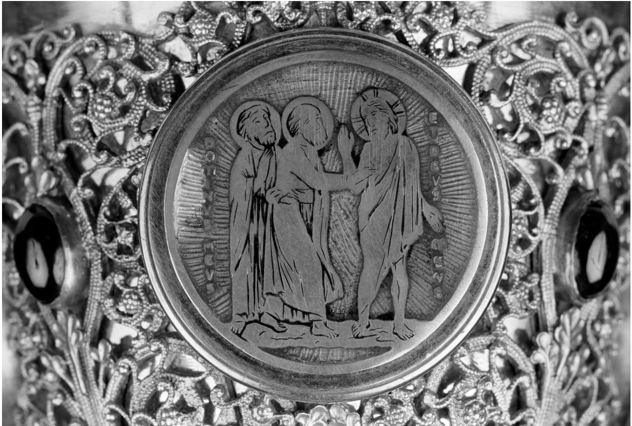
Calice, fausse coupe, Apparition à Thomas.