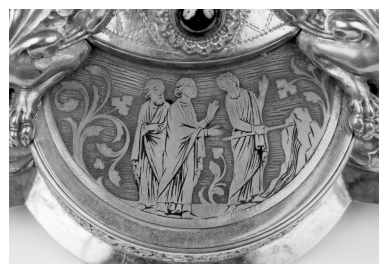
Pied, le frappeur du rocher. IVR31_19876200491X