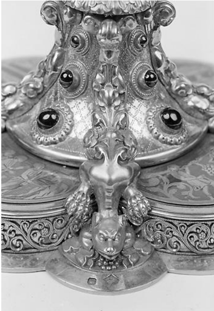
Pied, animal fabuleux.