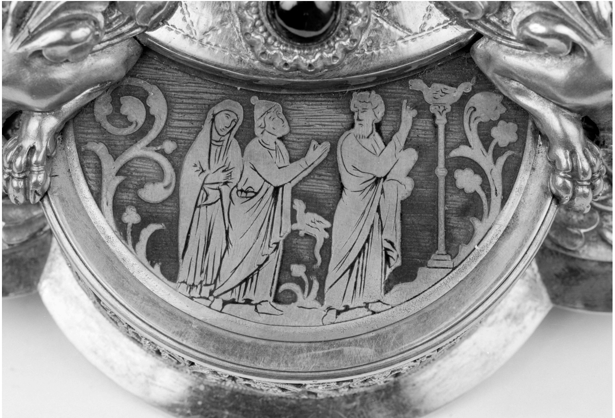
Pied, l'érection du serpent d'airain.