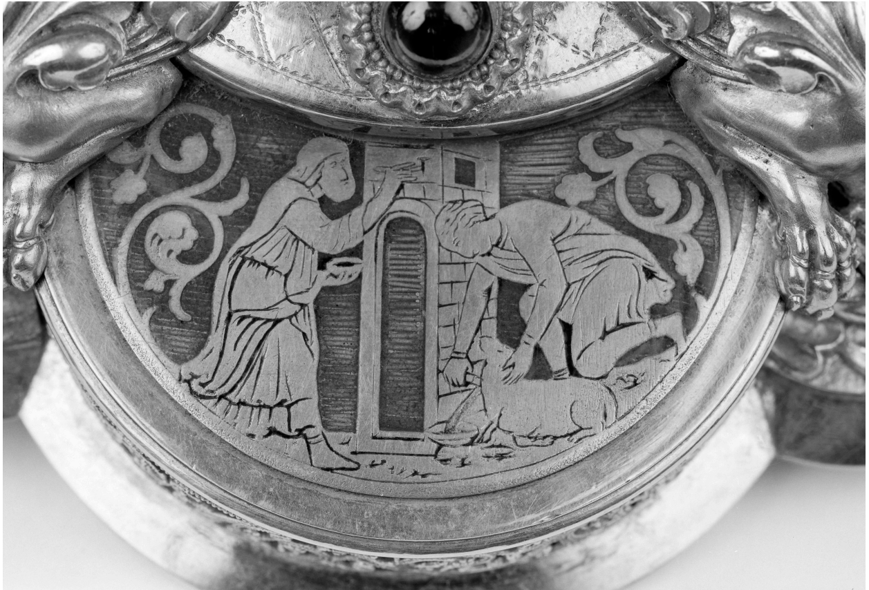
Pied, la Pâque.