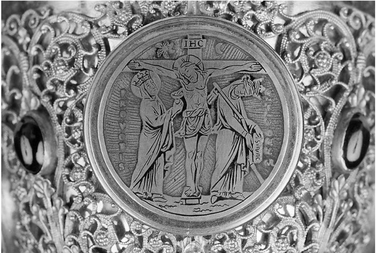
Calice, fausse coupe, Calvaire, face.