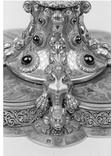
Pied, animal fabuleux.