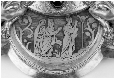
Pied, l'érection du serpent d'airain. IVR31_19876200489X