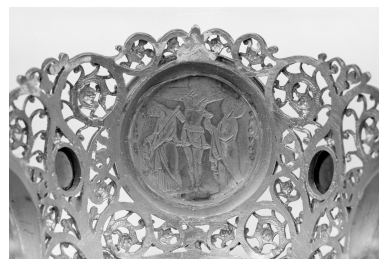
Calice, fausse coupe, Calvaire, revers.