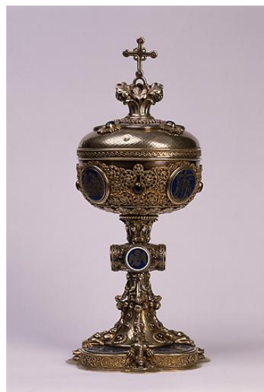
Ciboire, vue générale. IVR31_19886200192XA