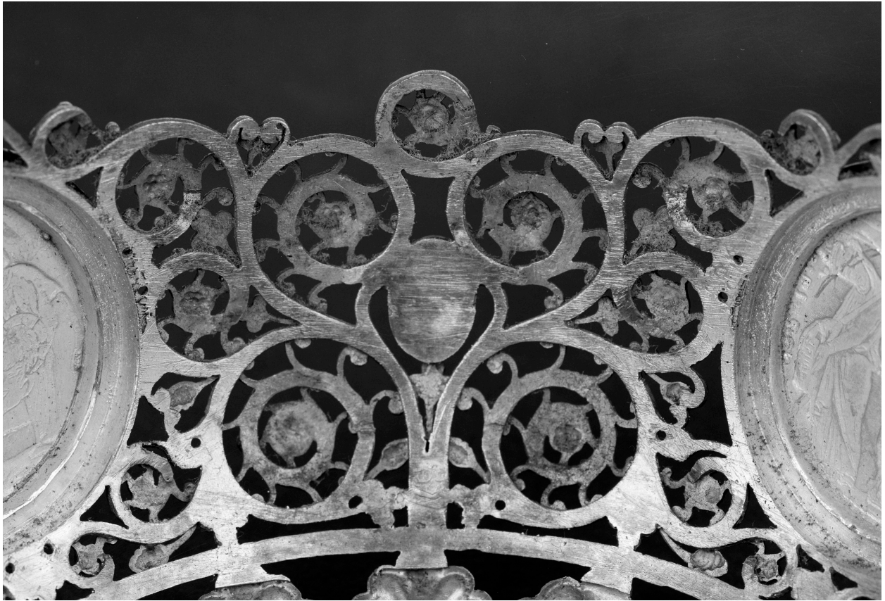
Calice, fausse coupe, faux filigrane, fausse granulation, vue intérieure.