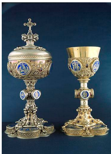
Vue générale. IVR31_19876201222XA