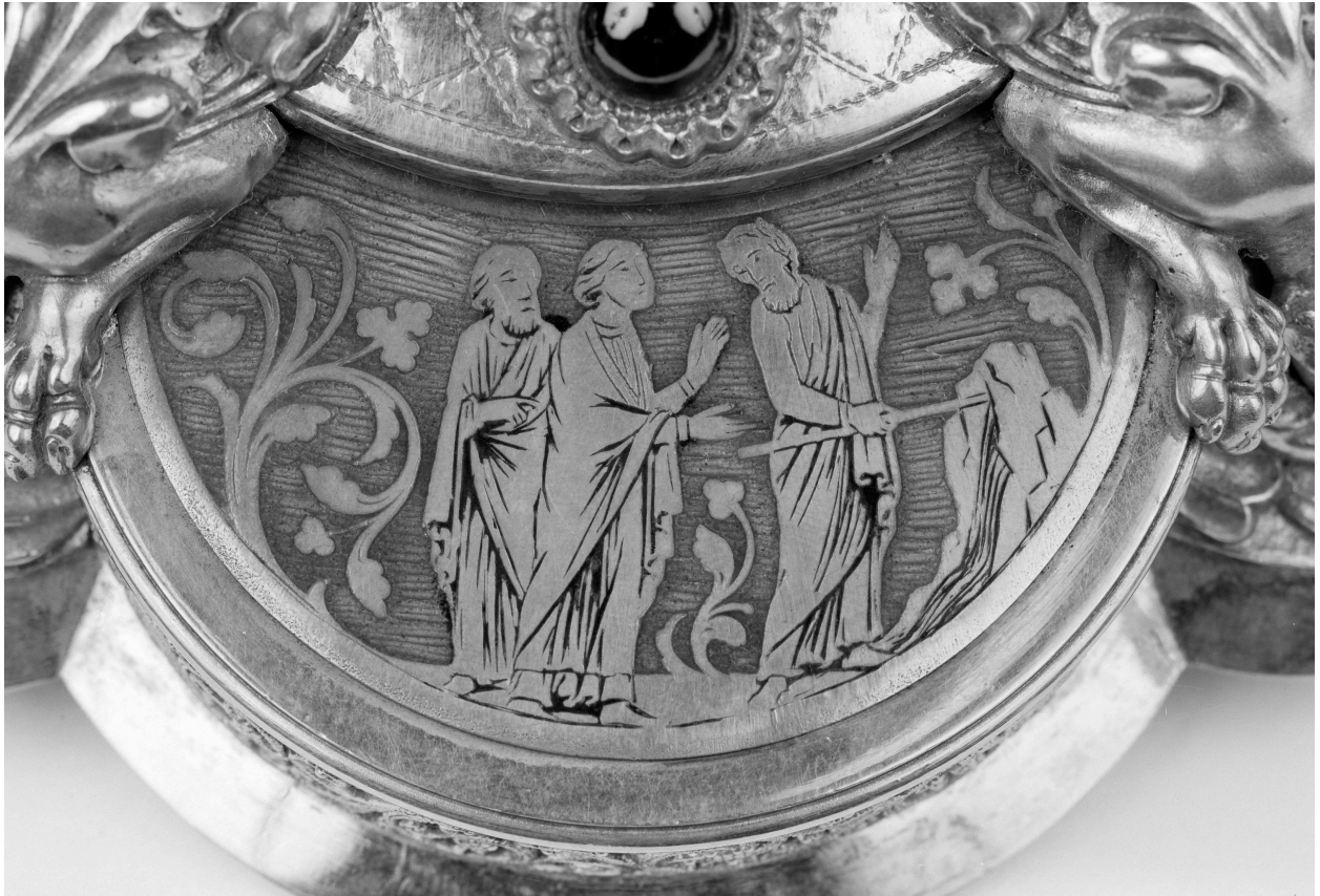
Pied, le frapement du rocher.