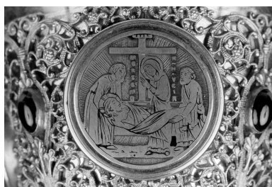
Calice, fausse coupe, coupe, Déploration.