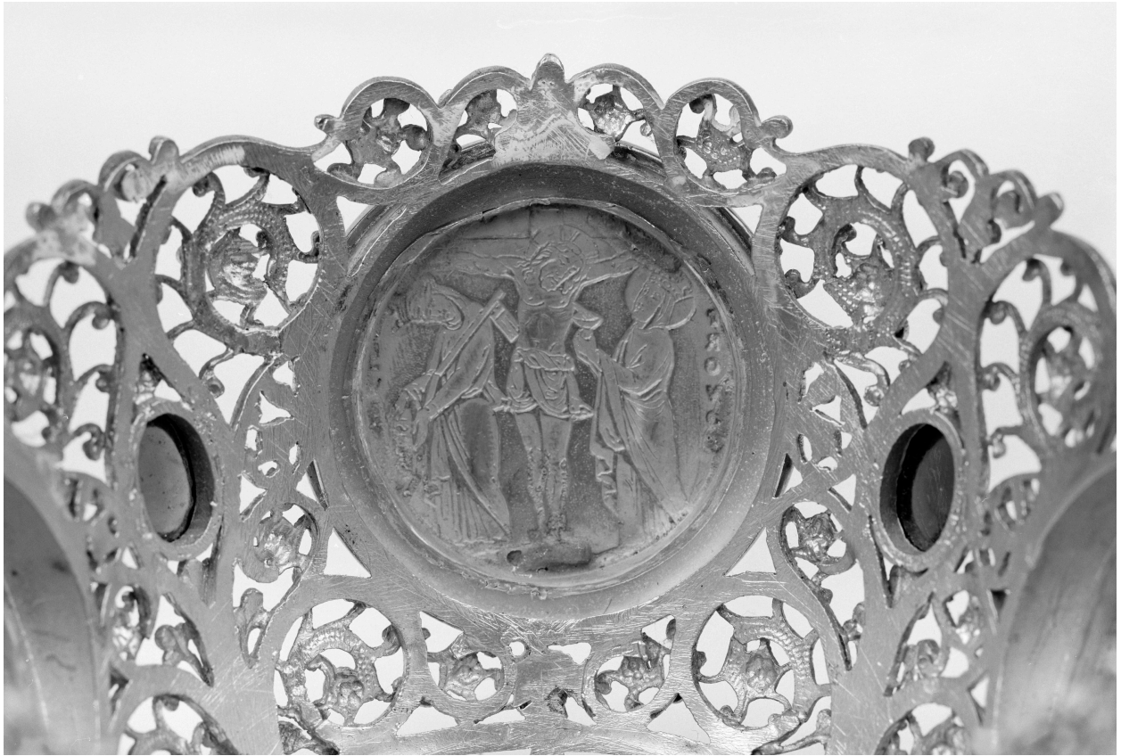
Calice, fausse coupe, Calvaire, revers.