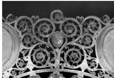
Calice, fausse coupe, faux filigrane, fausse granulation, vue intérieure. IVR31_19876200509X