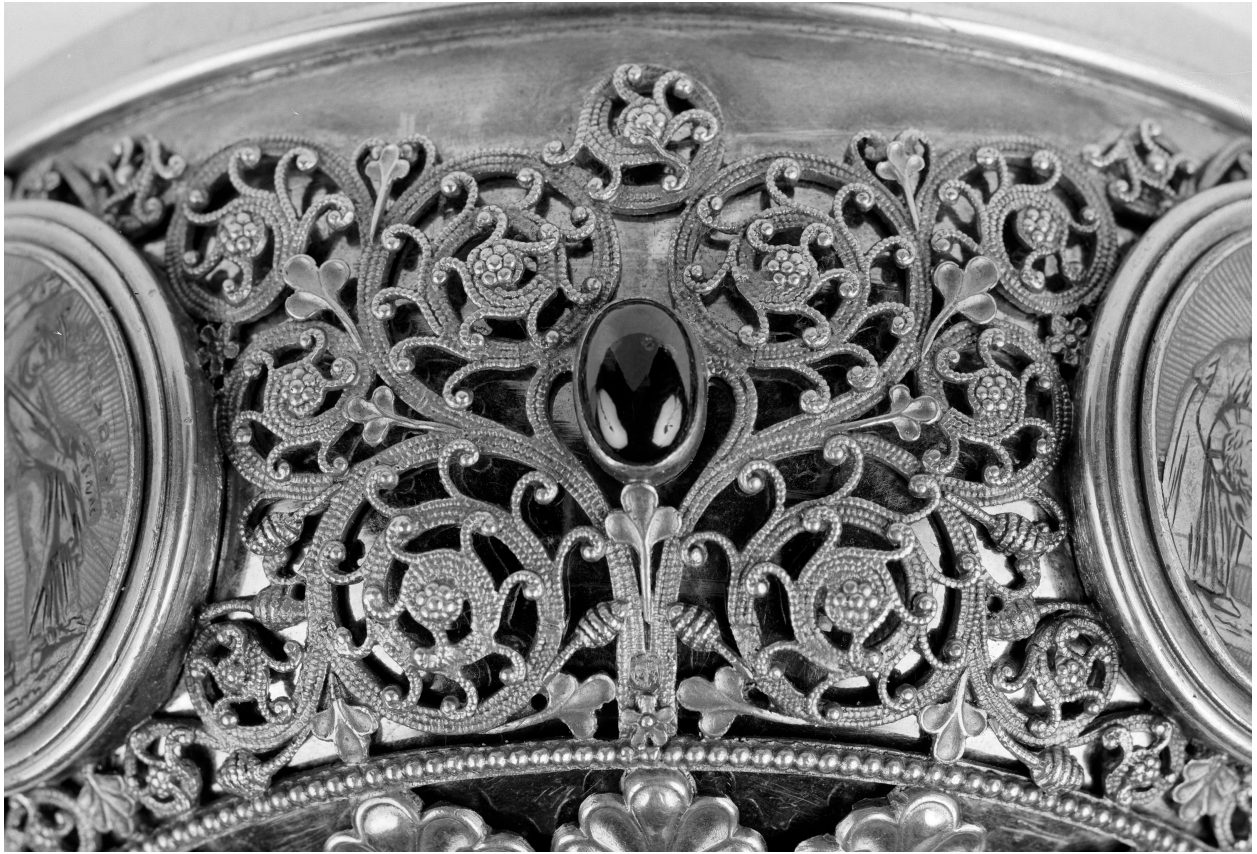
Calice, fausse coupe, faux filigrane, fausse granulation, vue extérieure.