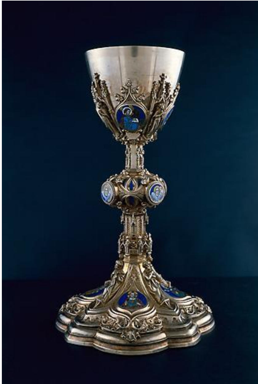
Calice, vue générale.