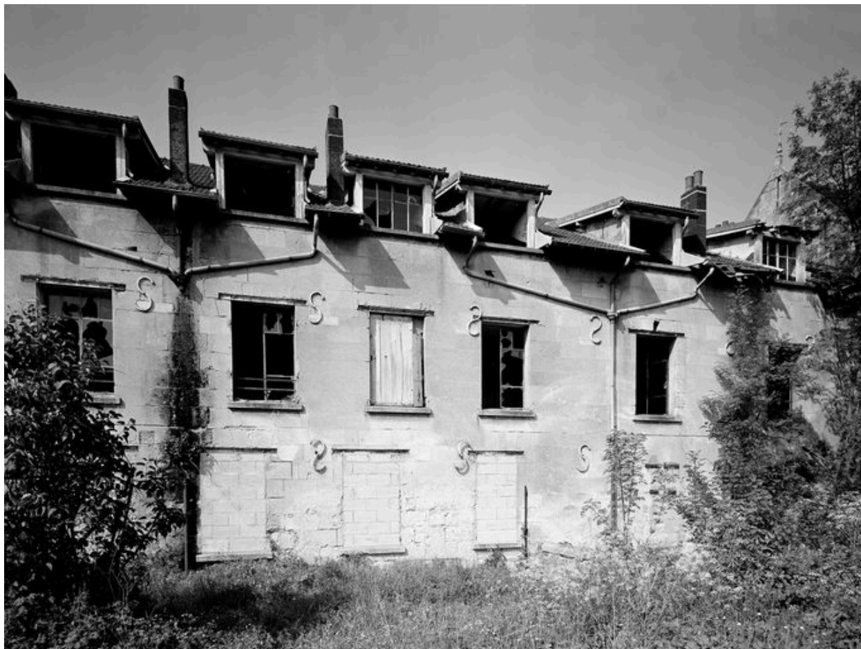
Atelier de fabrication, façade sud.