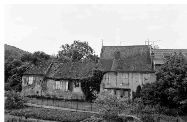
Vue générale, côté nord. IVR22_19946001192X