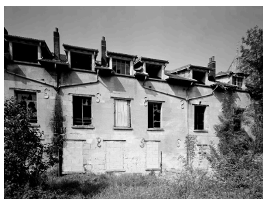
Atelier de fabrication, façade sud. IVR22_19936000708V