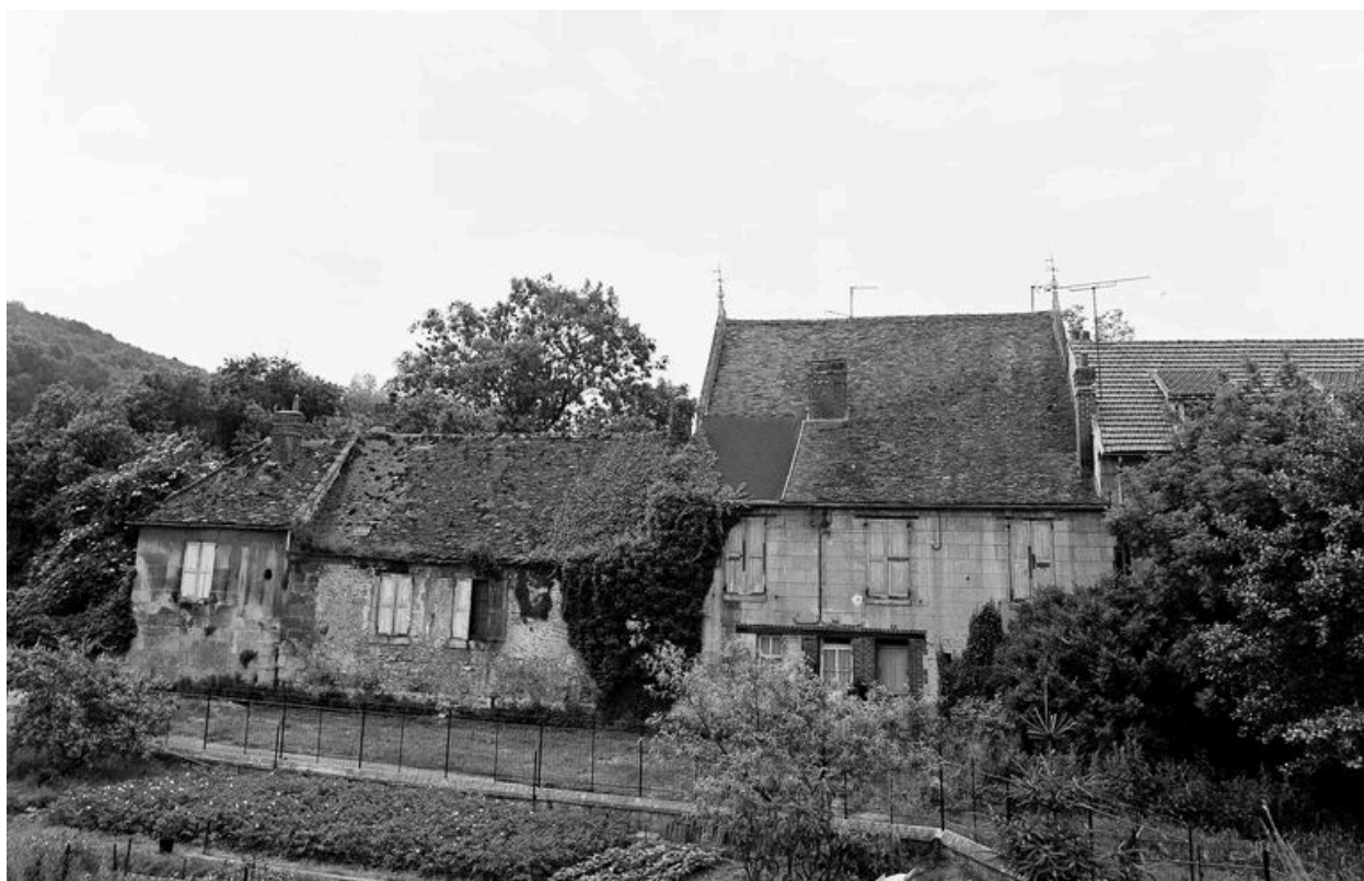
Vue générale, côté nord.