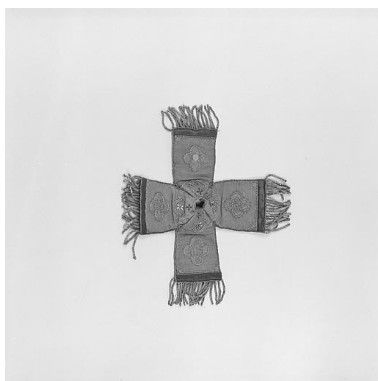
Pavillon de ciboire des malades, à plat. IVR31_19966200085X