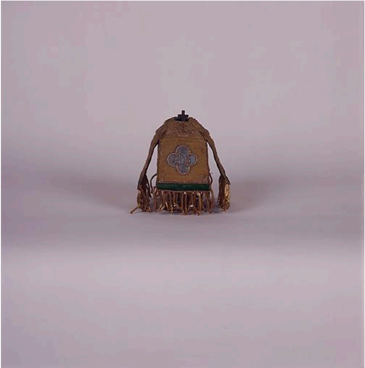
Pavillon de ciboire des malades, ciboire des malades : vue d'ensemble.