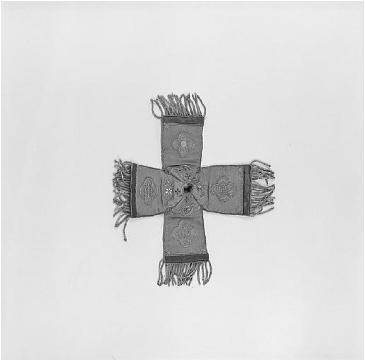
Pavillon de ciboire des malades, à plat.