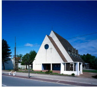
L'église paroissiale de Fort-Mahon-Plage.

IVR22_20058000568XAB