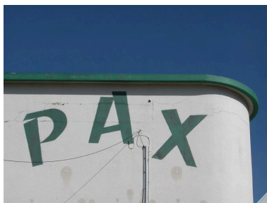
Détail de l'appellation peinte sur le mur.