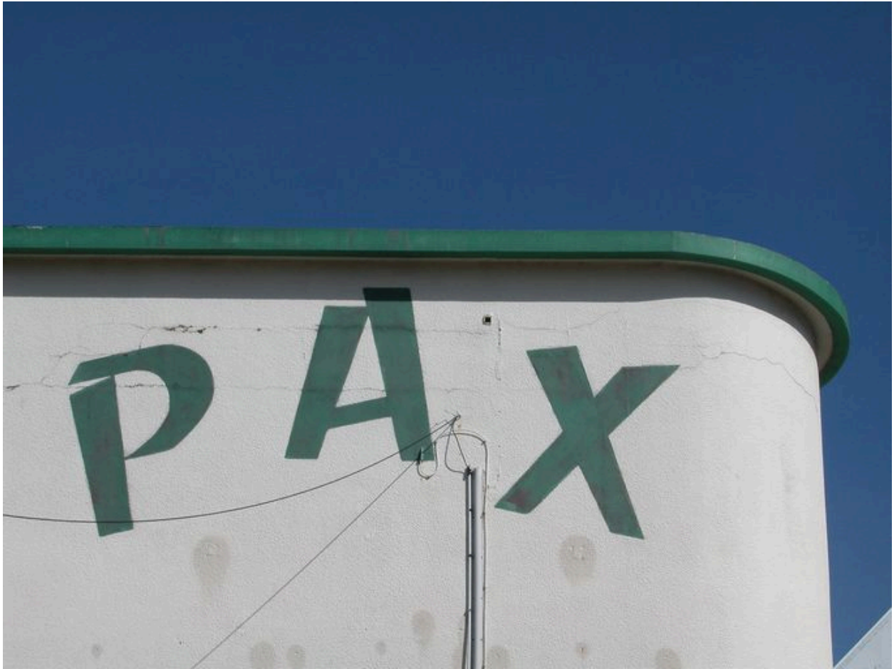
Détail de l'appellation peinte sur le mur.