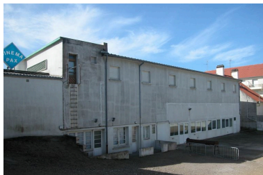
Élévation postérieure.