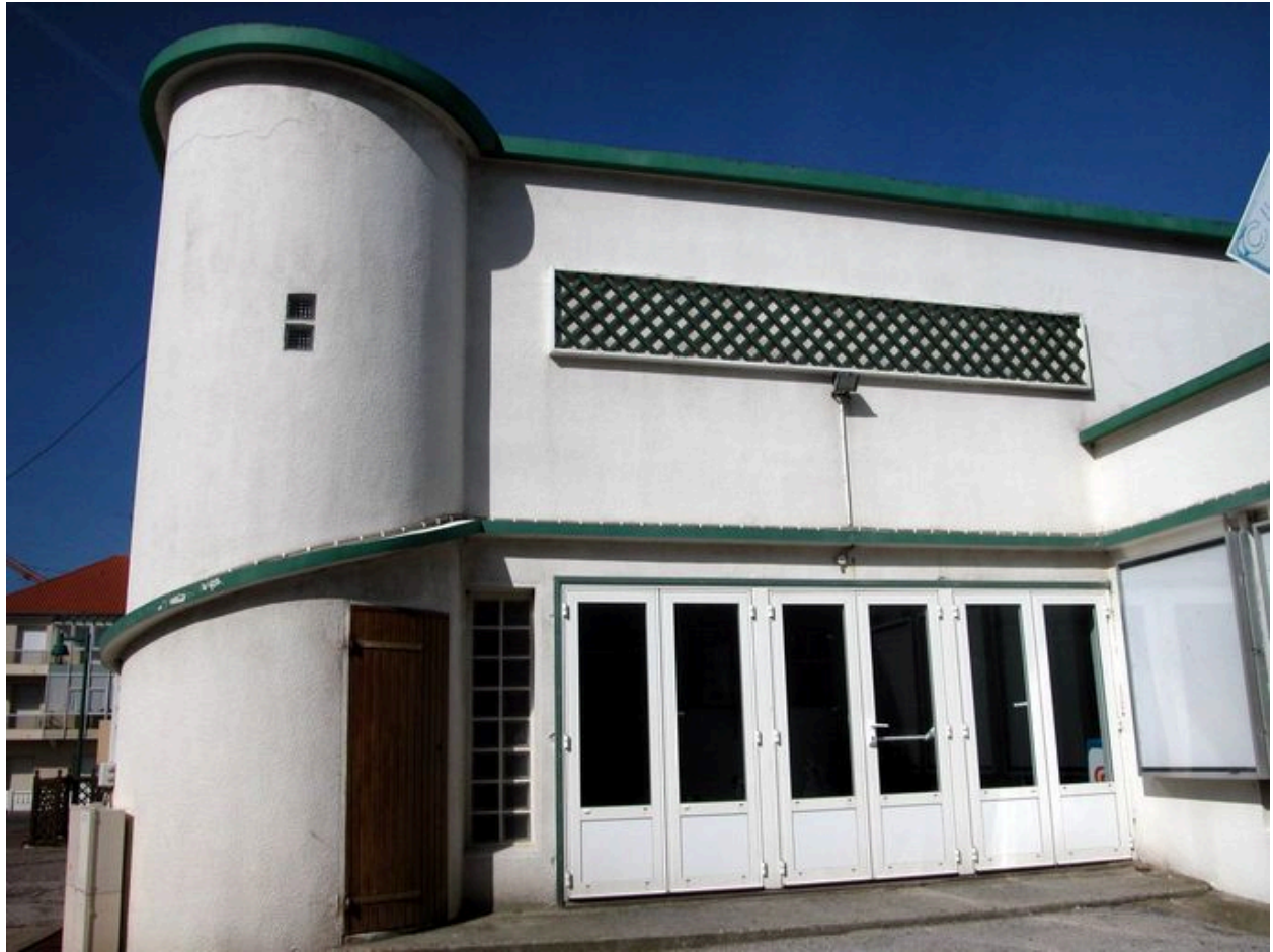
Détail de l'entrée.