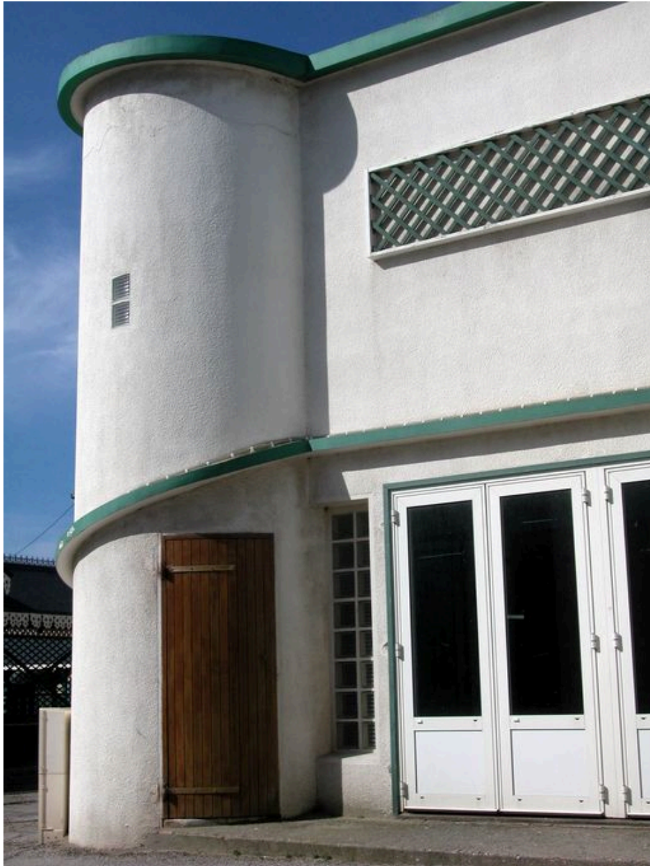
Détail de la tourelle.