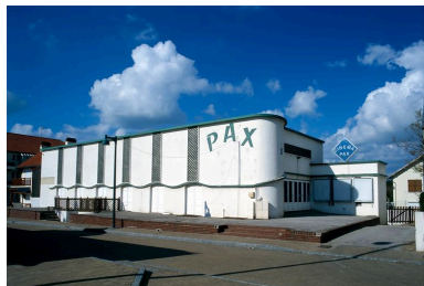
Vue d'ensemble. IVR22_20038001066XA