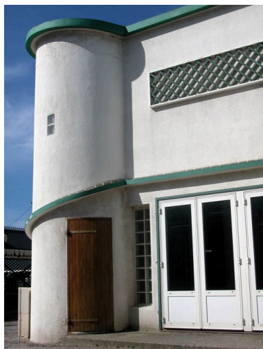
Détail de la tourelle. IVR22_20058002726NUCA