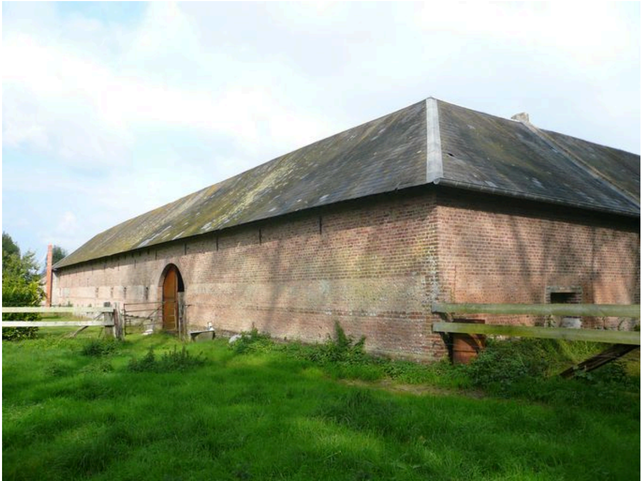
Vue de la grange et des étables à l'ouest de la cour.