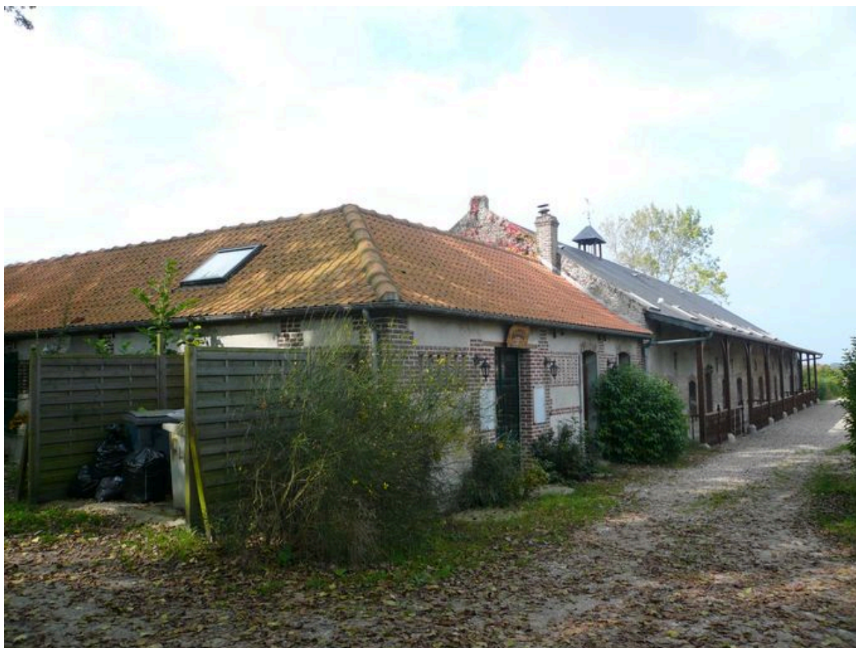
Vue des étables à l'est.