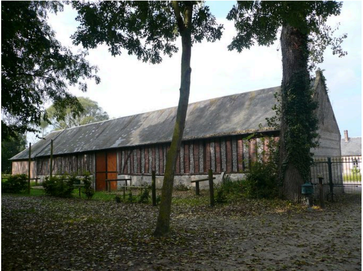
Vue de la grange au sud-ouest de la cour.