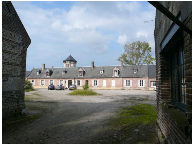
Vue du logis au nord.

Extrait du cadastre napoléonien présentant le plan de la ferme en 1828.