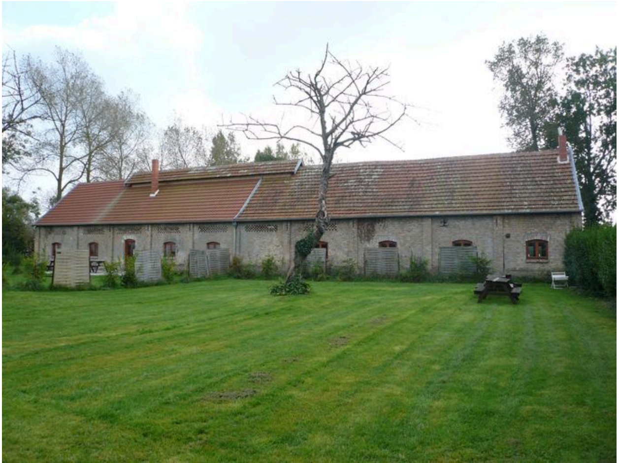
Vue de la cossetterie à l'est de la propriété.