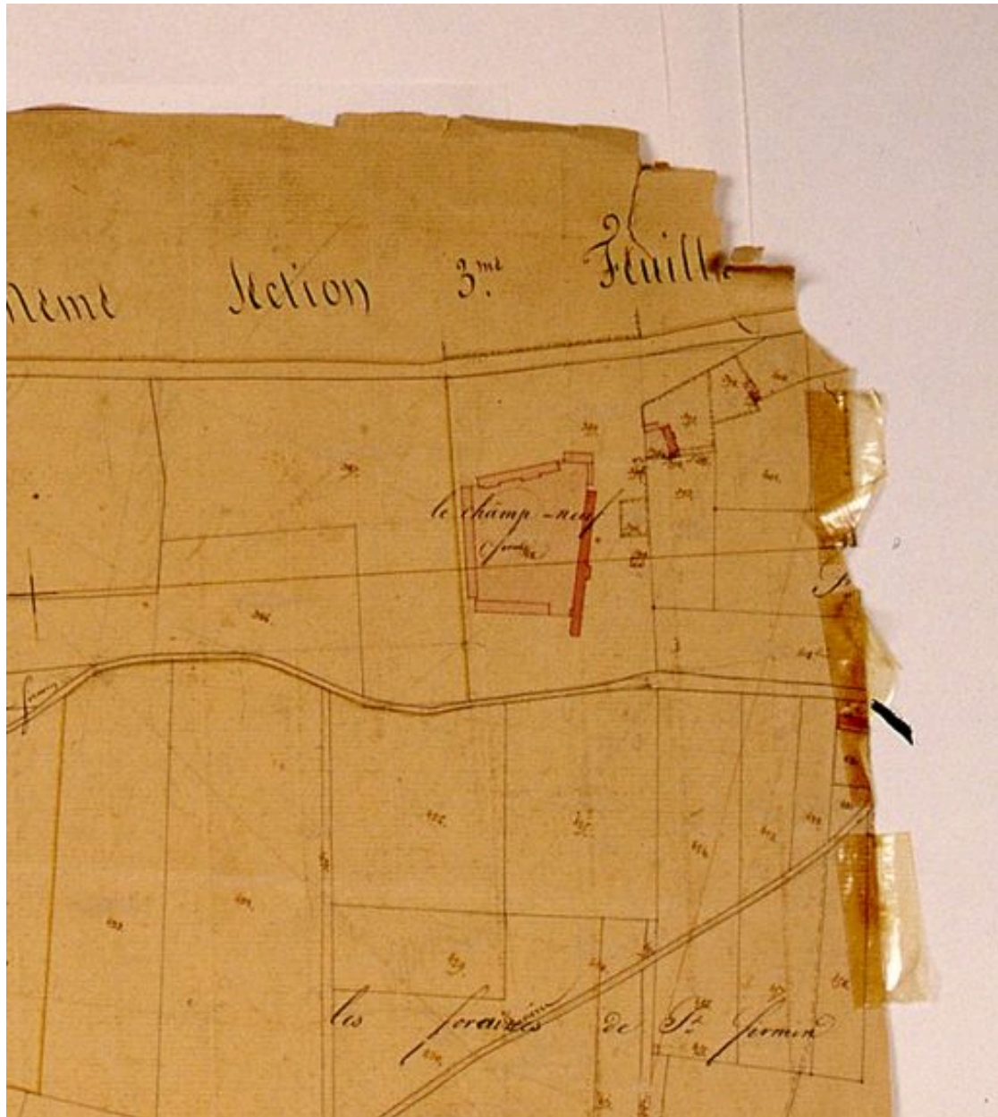
Extrait du cadastre napoléonien présentant le plan de la ferme en 1828.