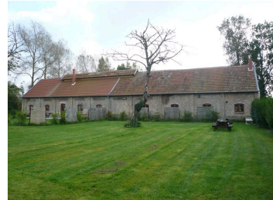
Vue de la cossetterie à l'est de la propriété. IVR22_20078006239NUCA