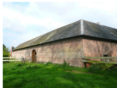
Vue de la grange et des étables à l'ouest de la cour. IVR22_20078006236NUCA