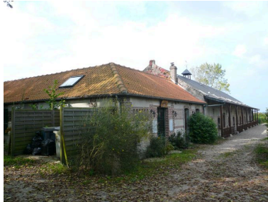
Vue des étables à l'est. IVR22_20078006238NUCA