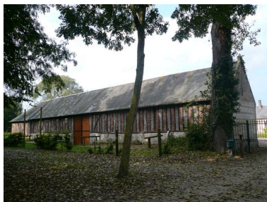
Vue de la grange au sud-ouest de la cour.