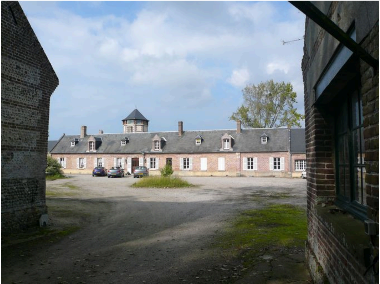
Vue du logis au nord.