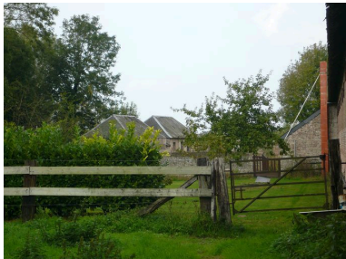
Vue des deux bâtiments indépendants au nord-ouest de la propriété.