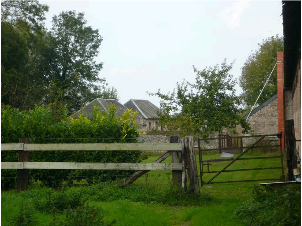
Vue des deux bâtiments indépendants au nord-ouest de la propriété.