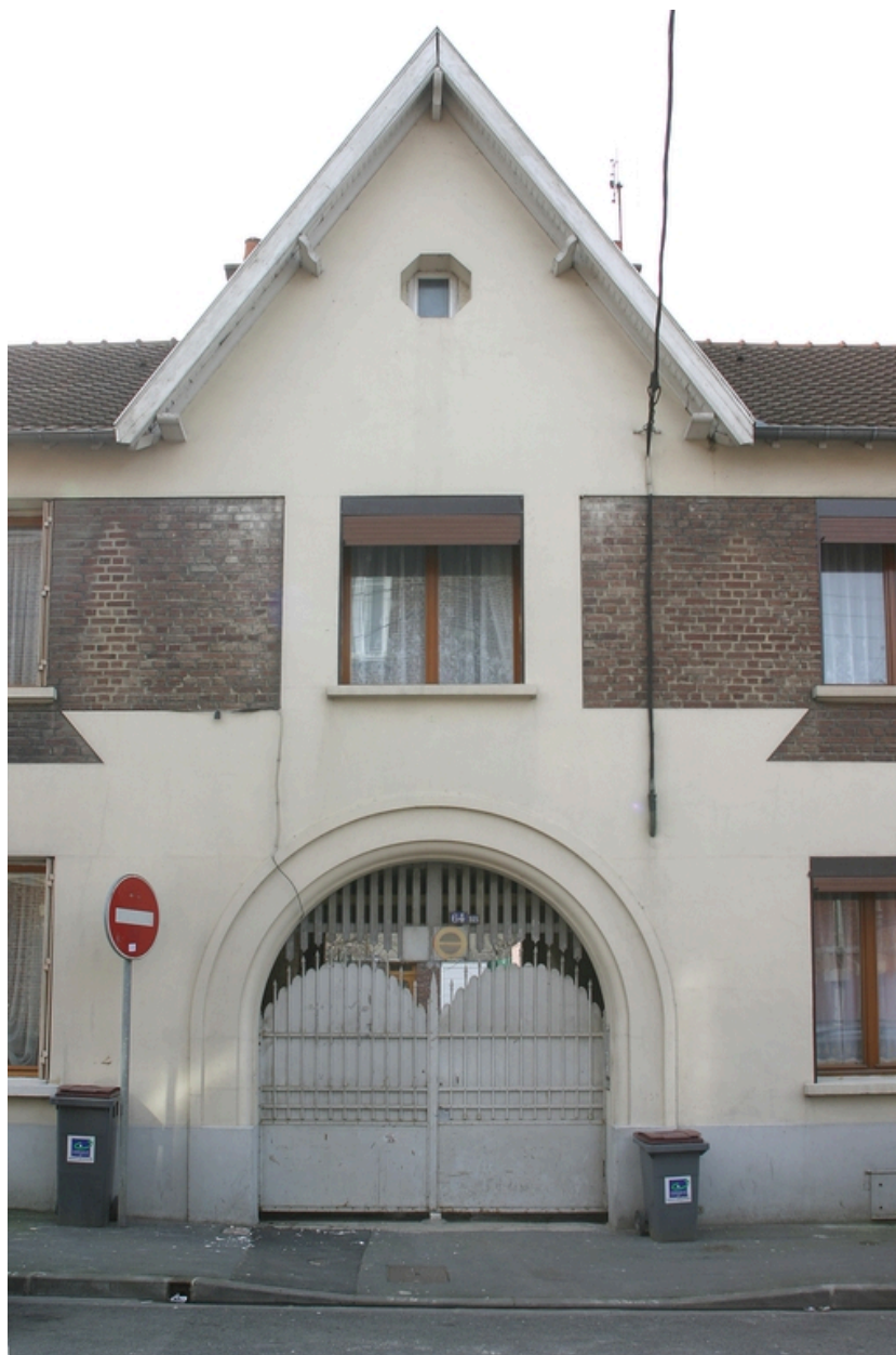
Le portail donnant accès aux logements sur cour.