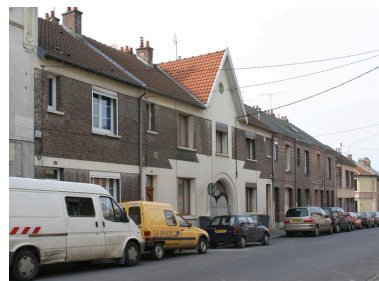
Façade antérieure sur rue.