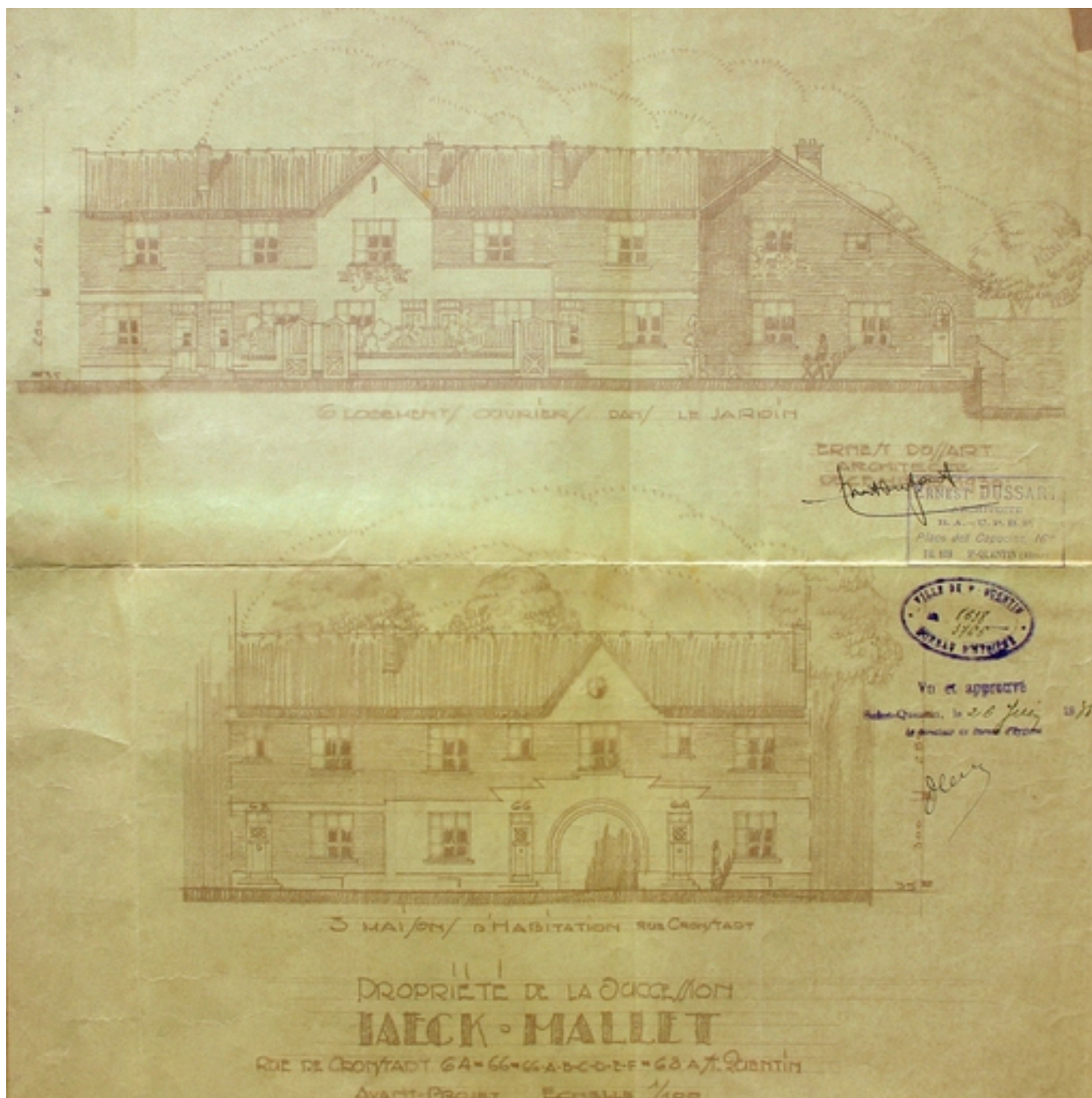
Avant-projet pour les façades antérieures, par E. Dussart, 1930 (AC Saint-Quentin).