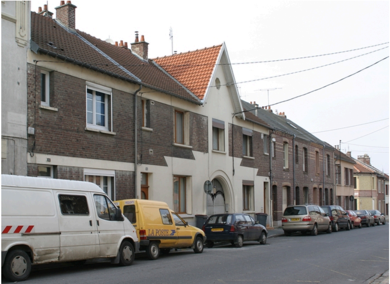
Façade antérieure sur rue.