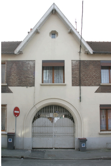
Le portail donnant accès aux logements sur cour.