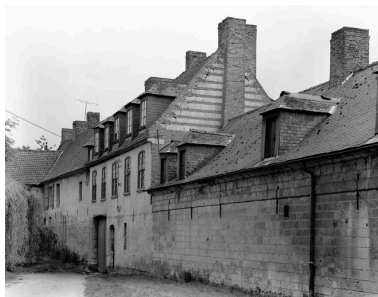
Vue générale, en 1989.