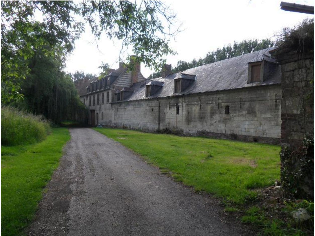
Vue de situation depuis le pont.