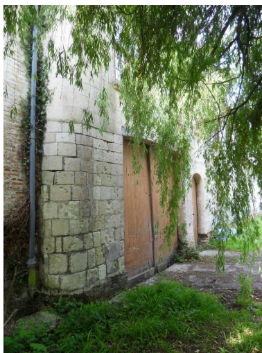
Vue de détail sur le niveau inférieur du corps de passage.