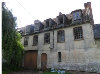
Vue du corps central.