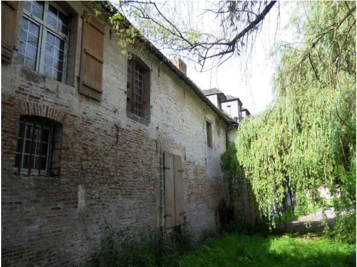
Vue du mur nord de la partie est du logis.