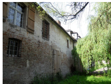
Vue du mur nord de la partie est du logis.