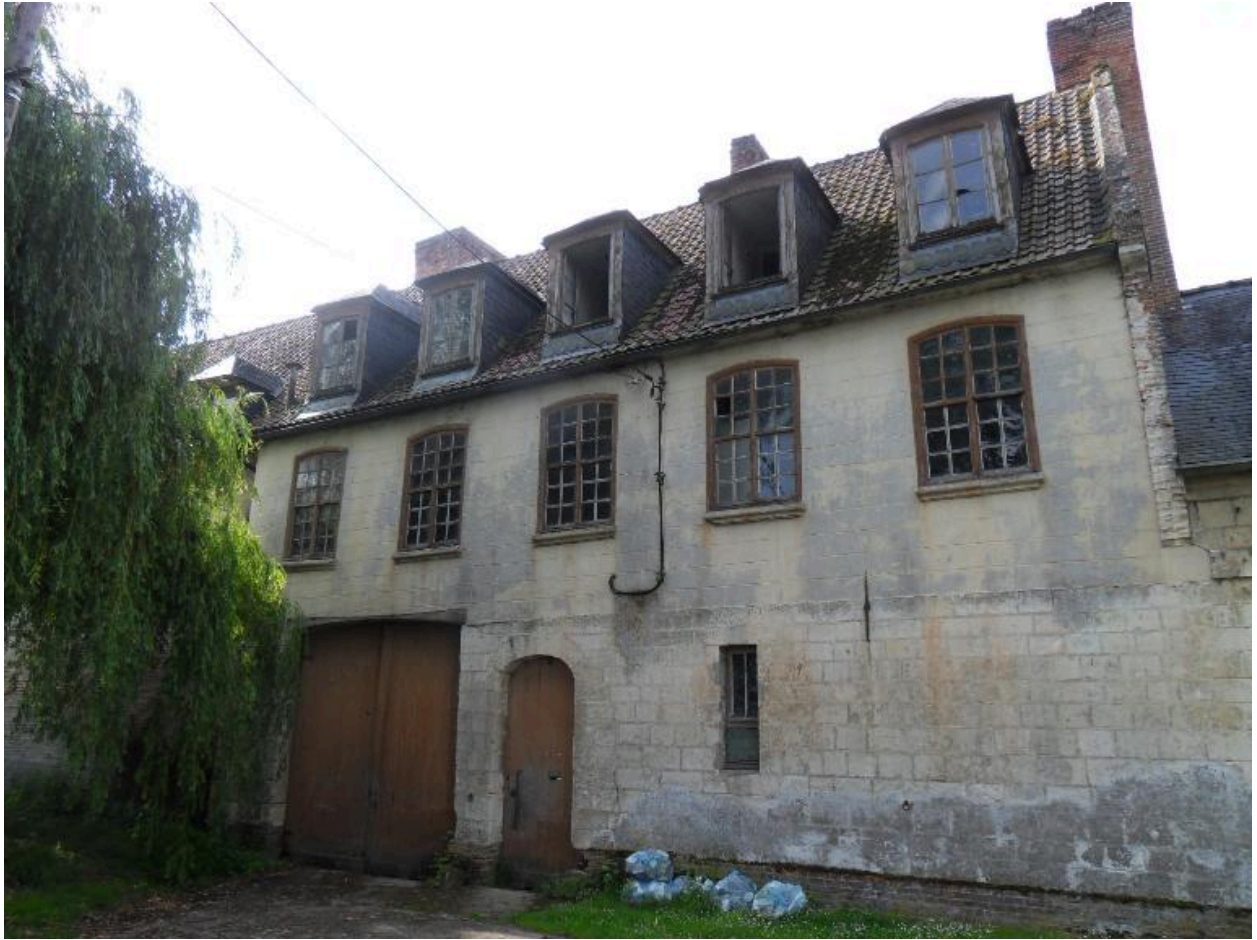
Vue du corps central.