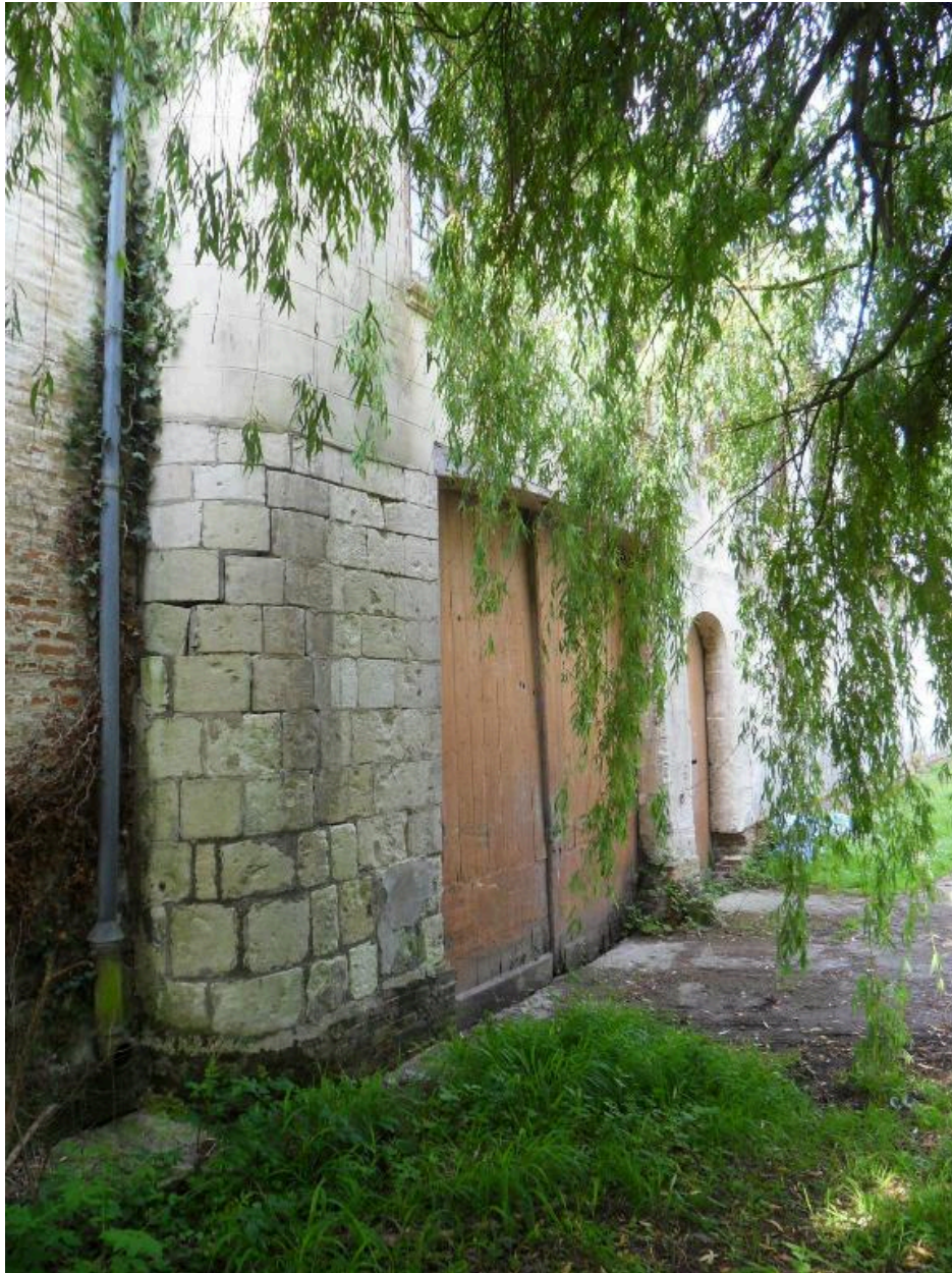
Vue de détail sur le niveau inférieur du corps de passage.