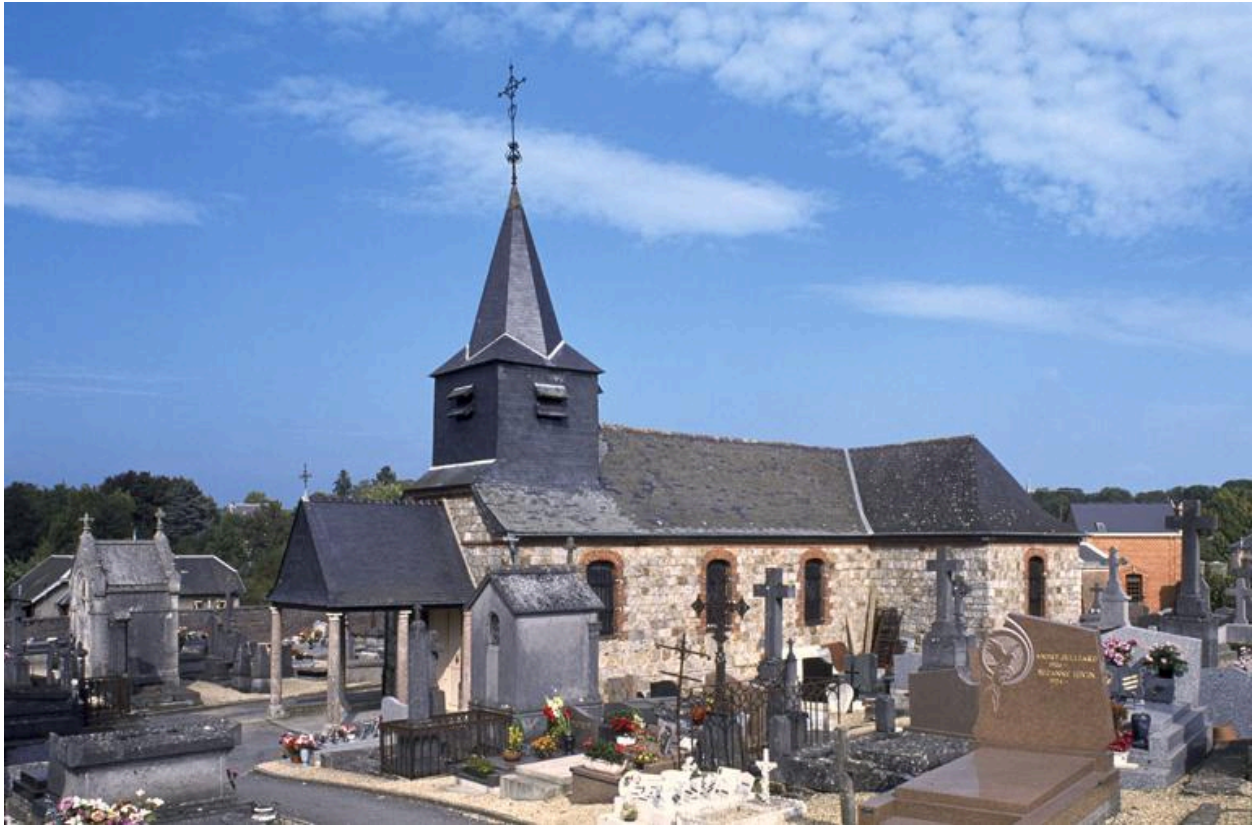
Vue du cimetière, au premier plan de l'église Sainte-Anne.