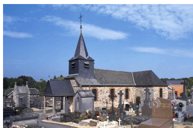
Vue du cimetière, au premier plan de l'église Sainte-Anne.