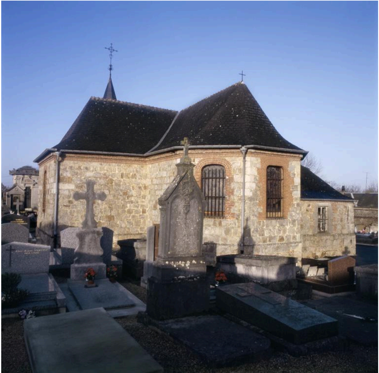
Vue du cimetière, au premier plan, à l'arrière de l'église Sainte-Anne.