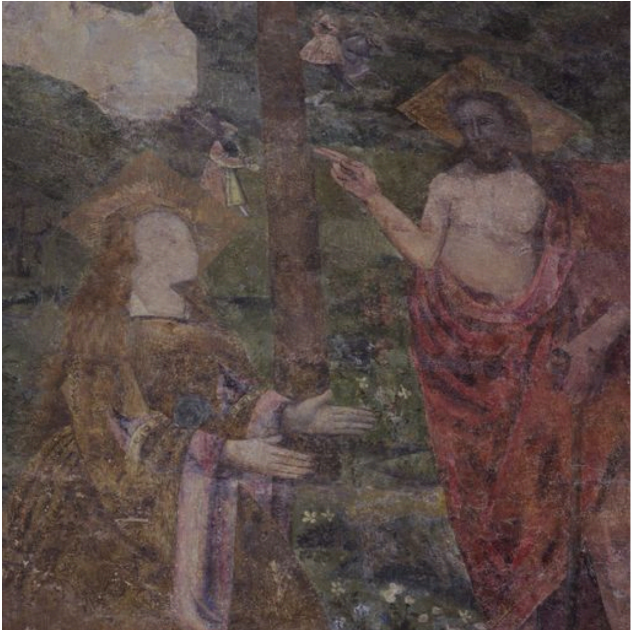
Noli me tangere : détail.