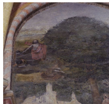
Christ ressuscité : détail.