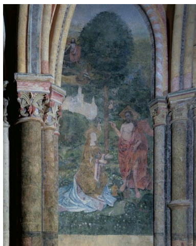
Vue générale. IVR22_19976000301VA