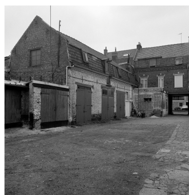
Dépendances (écuries ?).

IVR31_19885900796X