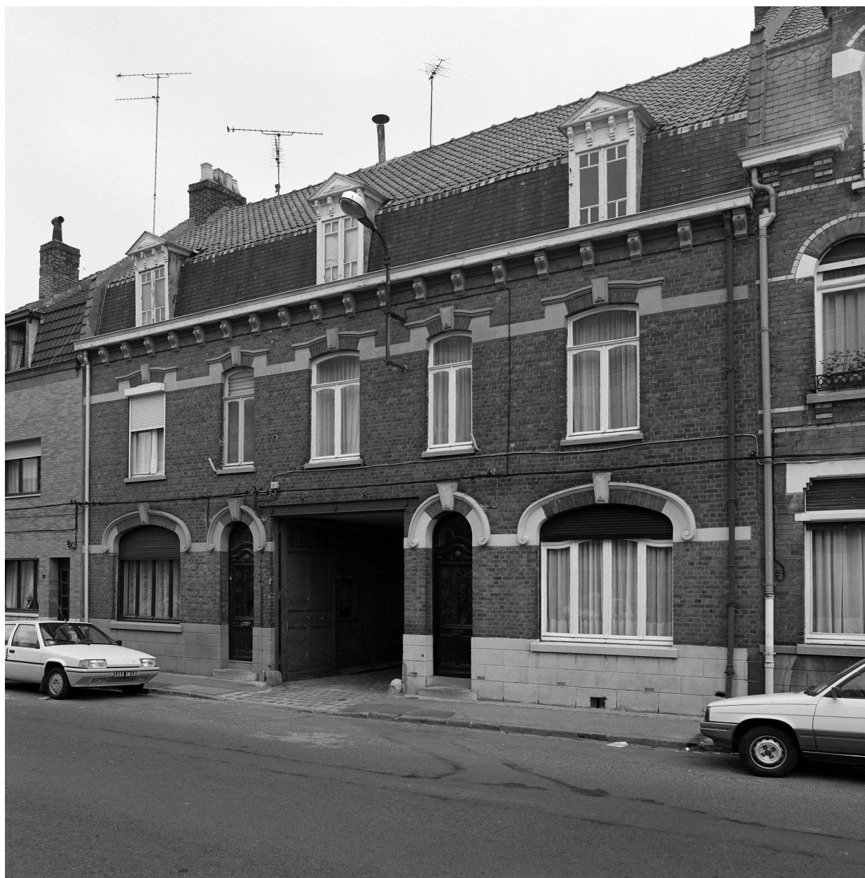
Élévation antérieure, rue des Fusillés.