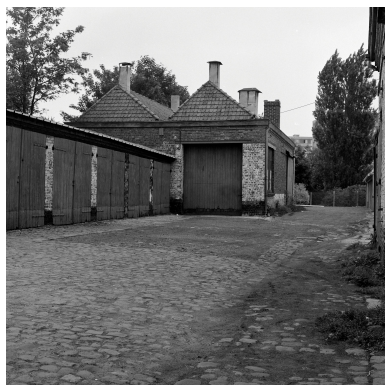
Ateliers de fabrication (?). Vue prise vers l'est. IVR31_19885900771X

IVR31_19885900797X