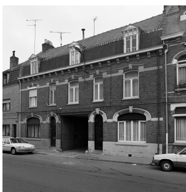
Élévation antérieure, rue des Fusillés.

IVR32_20235905067NUCA