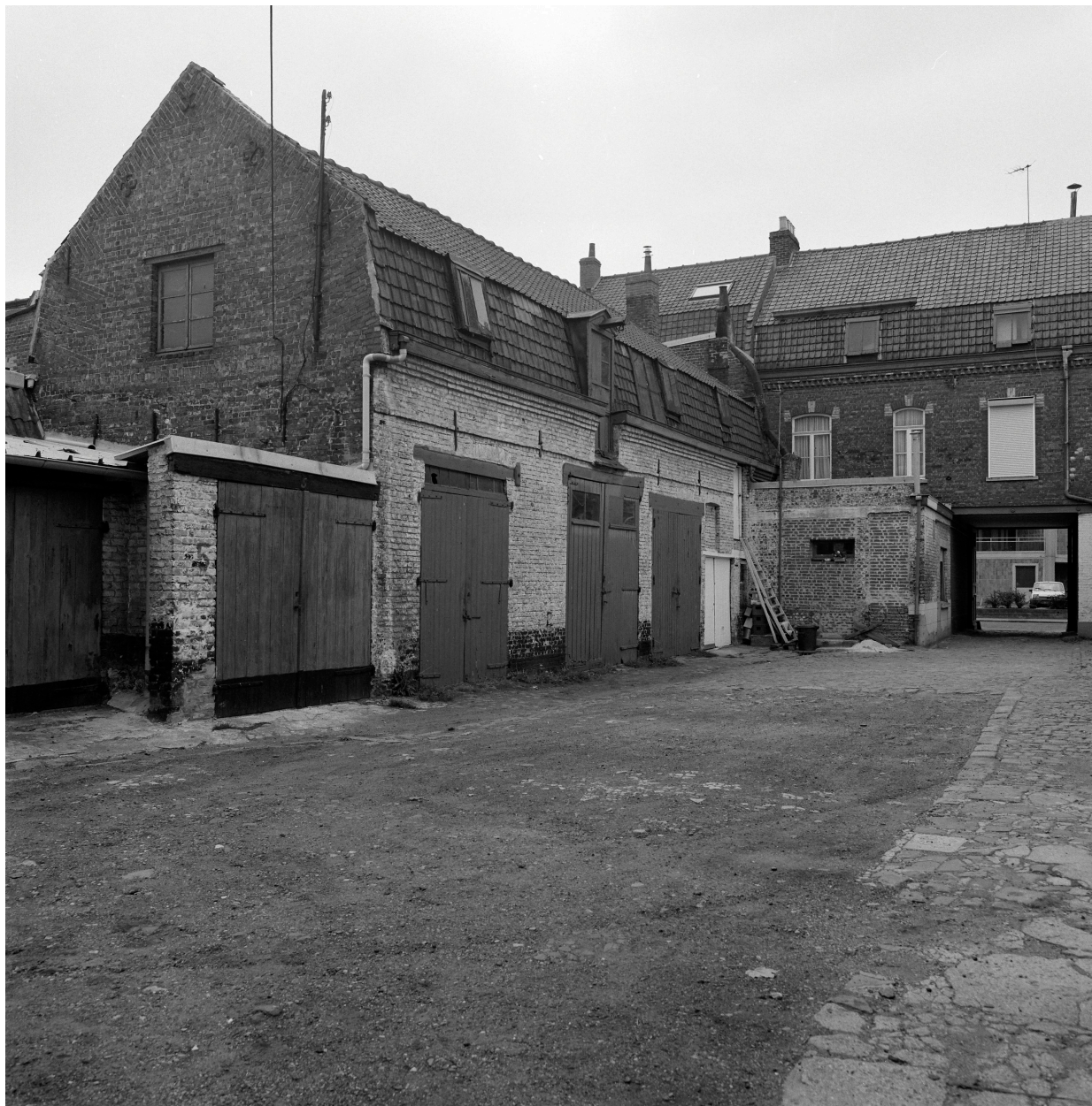
Dépendances (écuries ?).