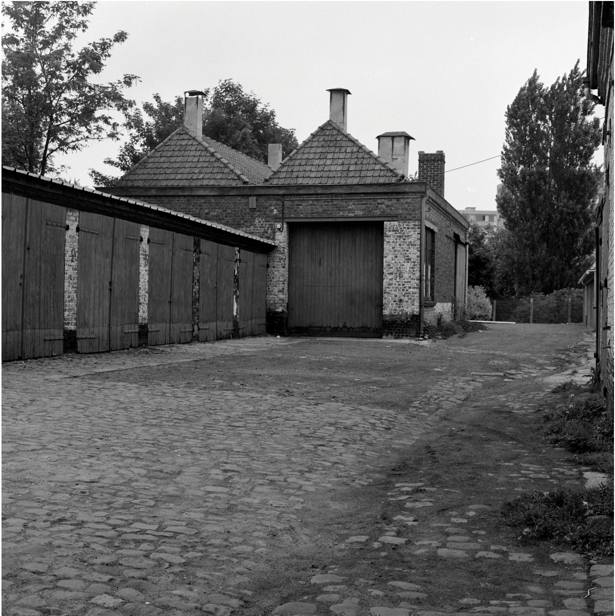
Ateliers de fabrication (?). Vue prise vers l'est.