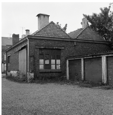
Atelier de fabrication (?). Vue prise vers l'ouest. IVR31_19885900770X