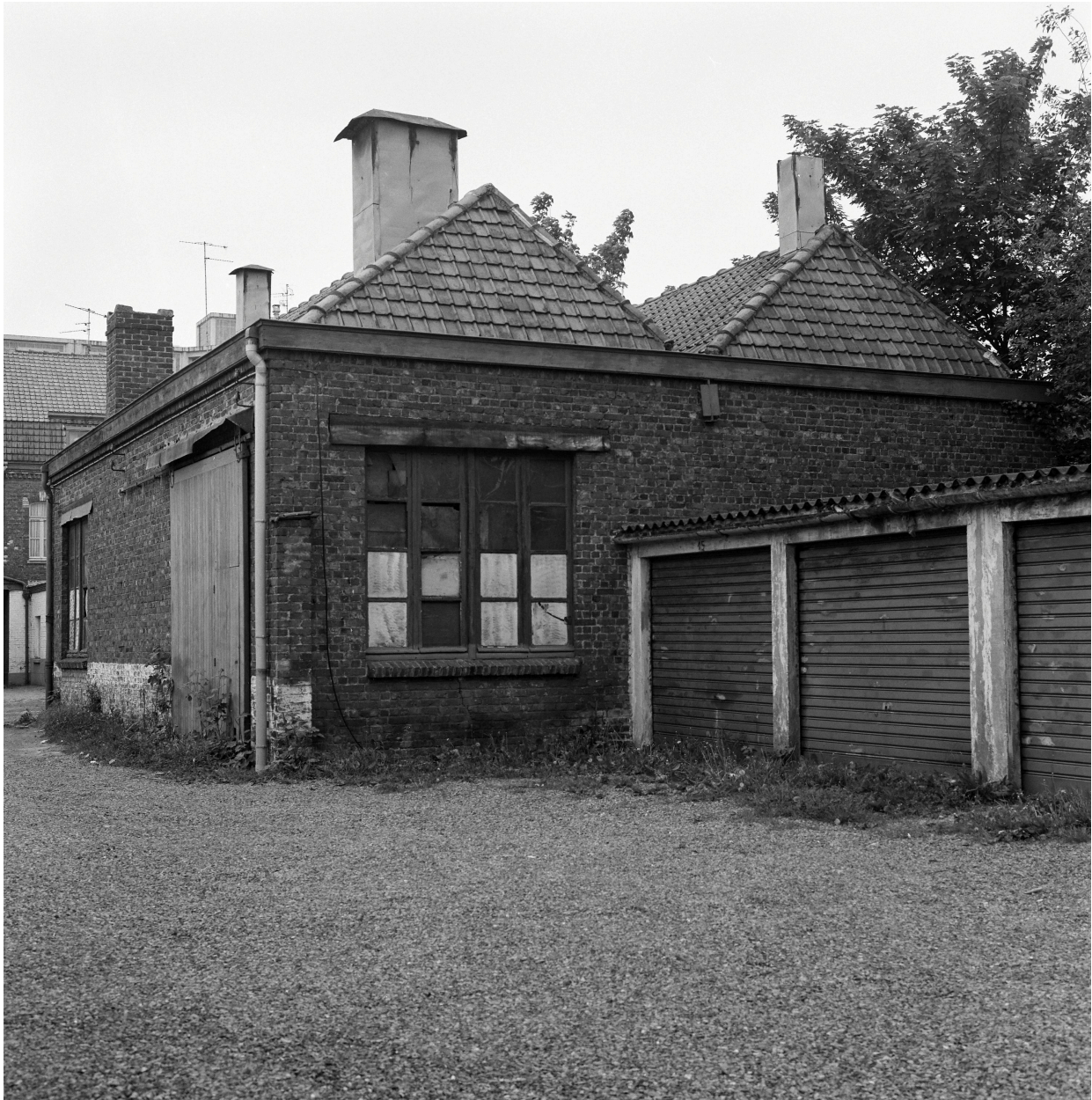
Atelier de fabrication (?). Vue prise vers l'ouest.