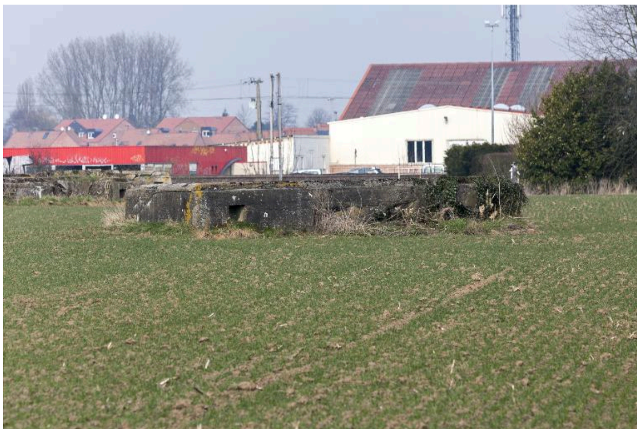
Ouvrage en U.