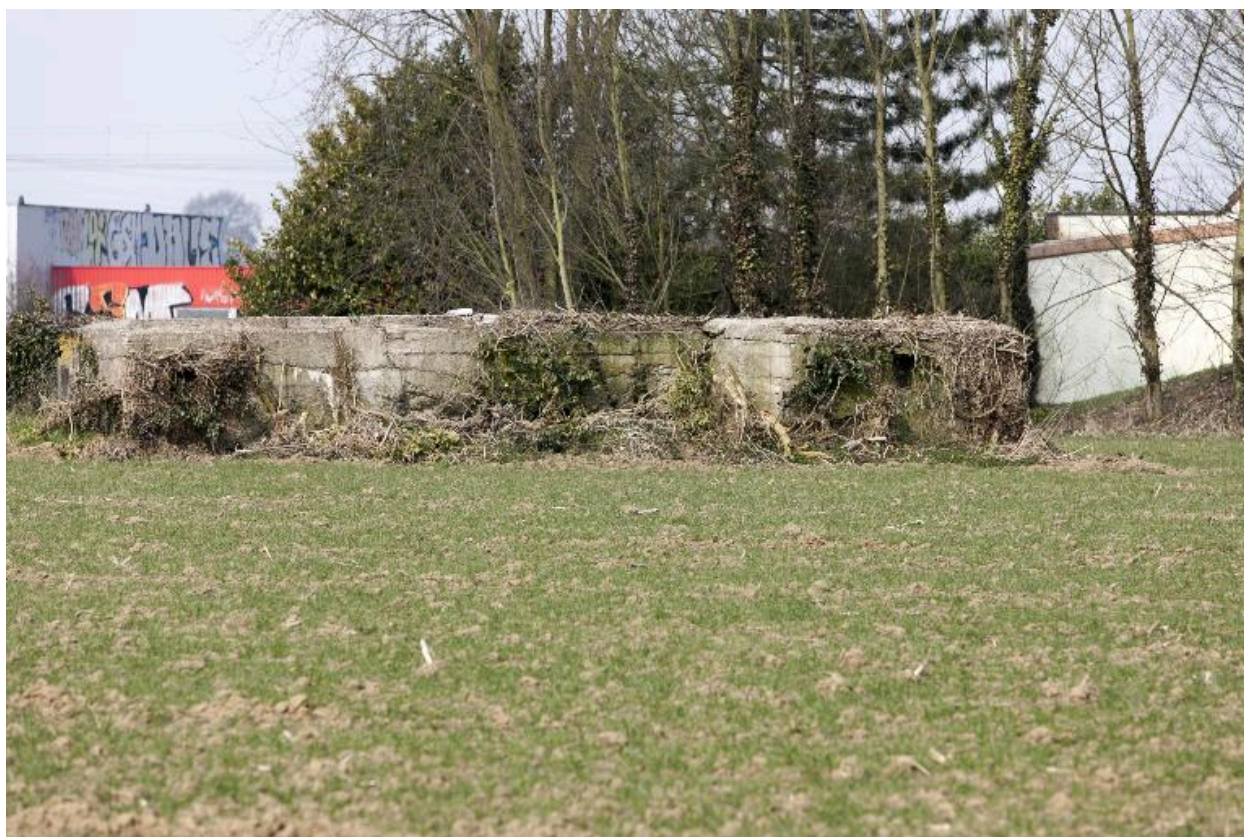
Ouvrage en U