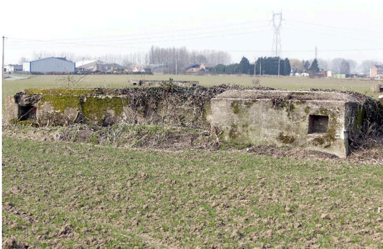
Ouvrage, en L, vers l'ouest