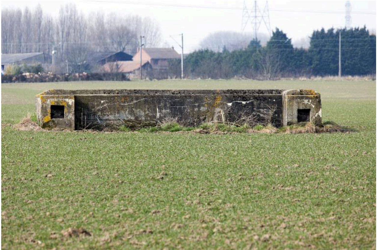
Autre ouvrage en U, vers l'ouest