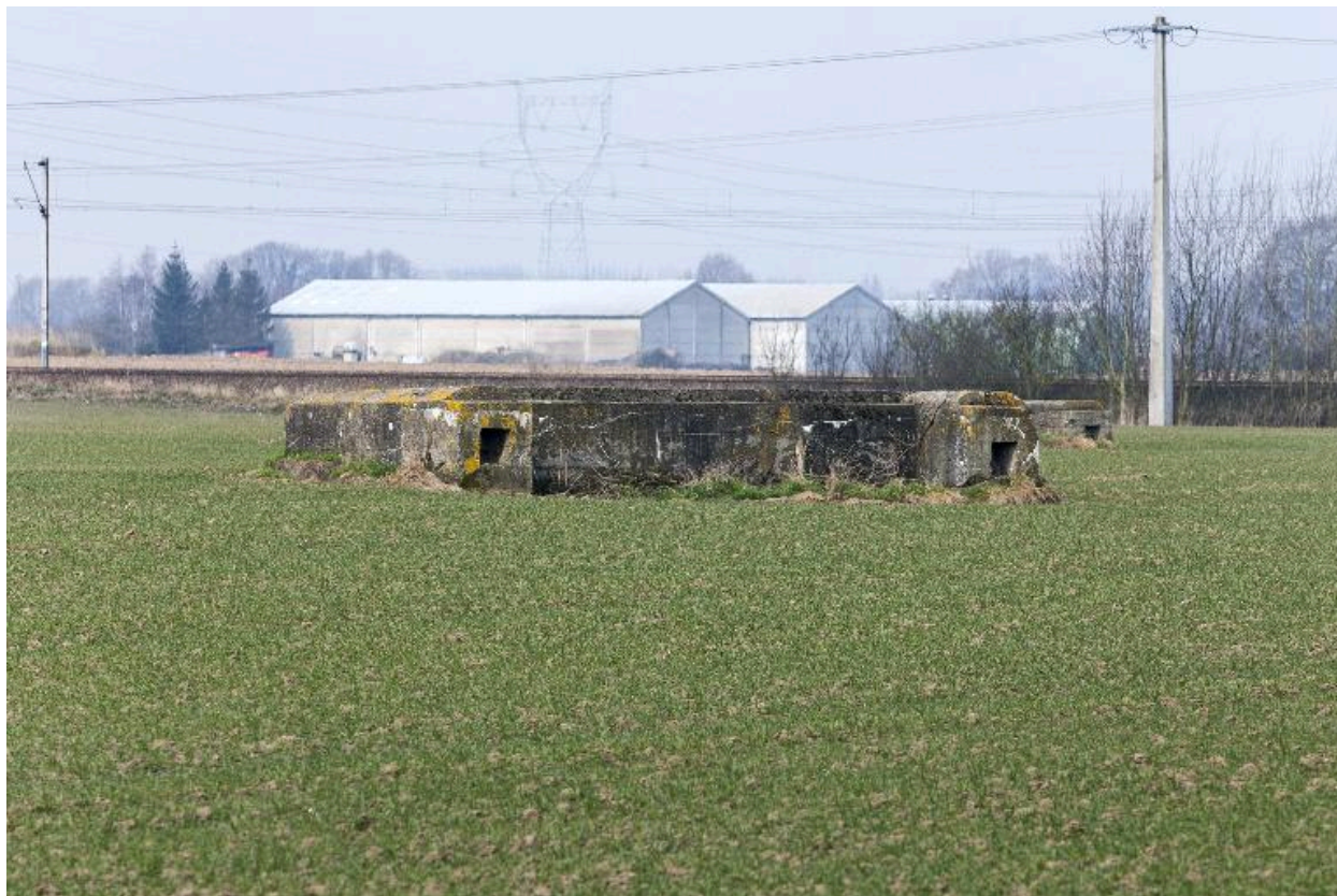
Le même, vu vers le nord-ouest