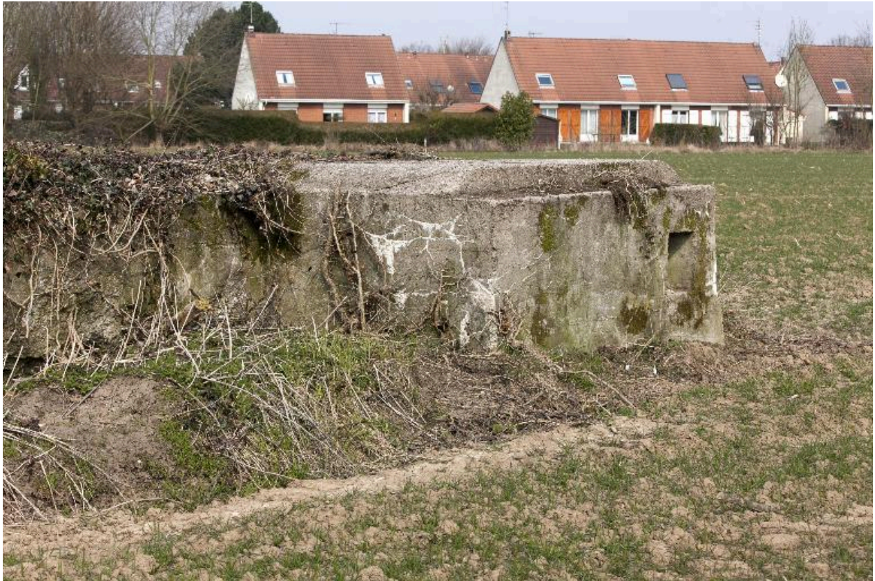
Détail de l'ouvrage en L précécent.