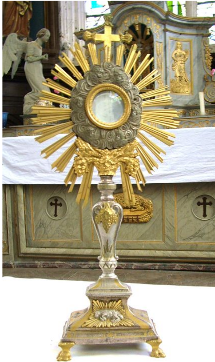
Ostensoir, bronze argenté et doré, milieu du 19e siècle.