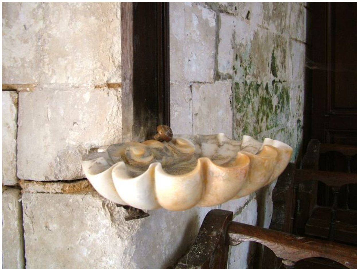
Bénitier, marbre blanc, milieu du 18e siècle.