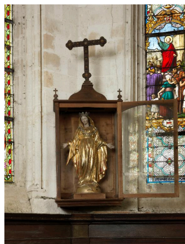
Immaculée Conception dans une vitrine, bois doré, milieu du 19e siècle.