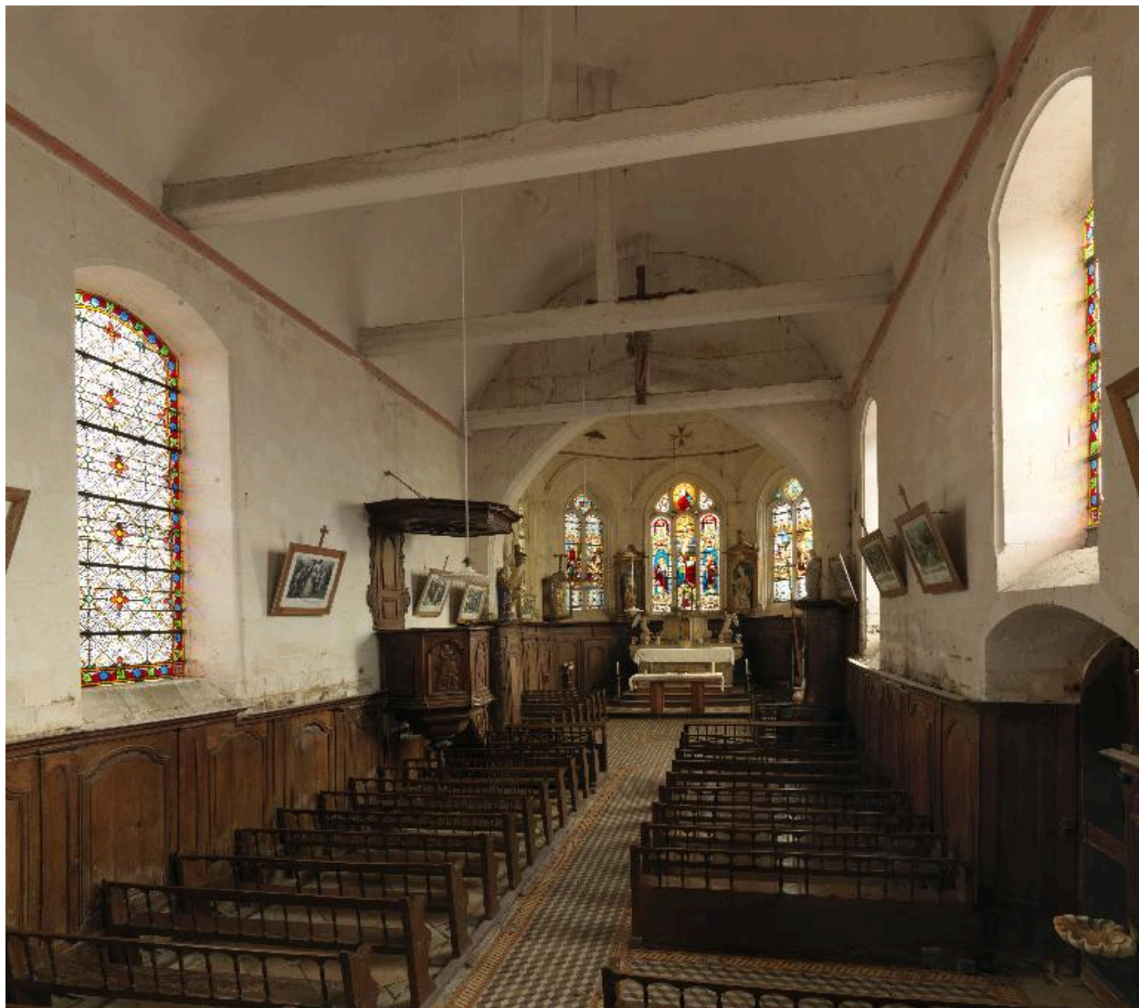
Vue de la nef et du choeur.