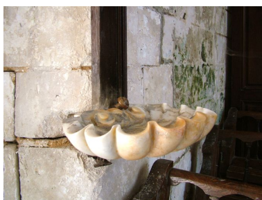
Bénitier, marbre blanc, milieu du 18e siècle.