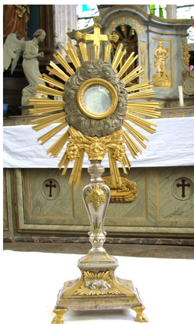
Ostensoir, bronze argenté et doré, milieu du 19e siècle.

IVR22_20108001840NUCA