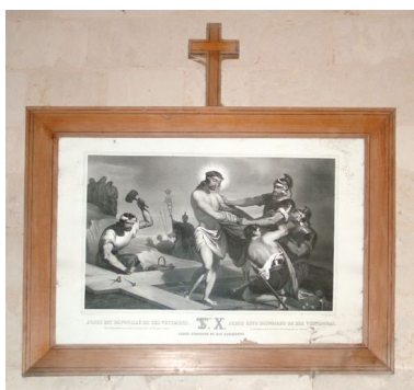
Chemin de croix, station X : Jésus est dépouillé de ses vêtements, 4e quart du 19e siècle.

IVR22_20108001840NUCA