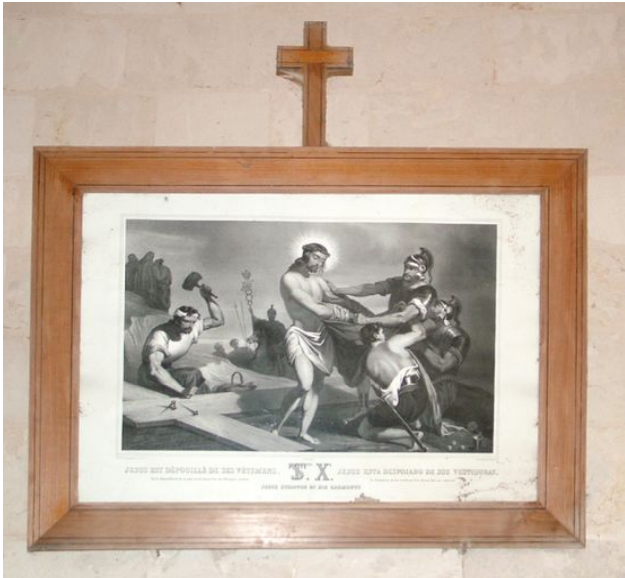
Chemin de croix, station X : Jésus est dépouillé de ses vêtements, 4e quart du 19e siècle.