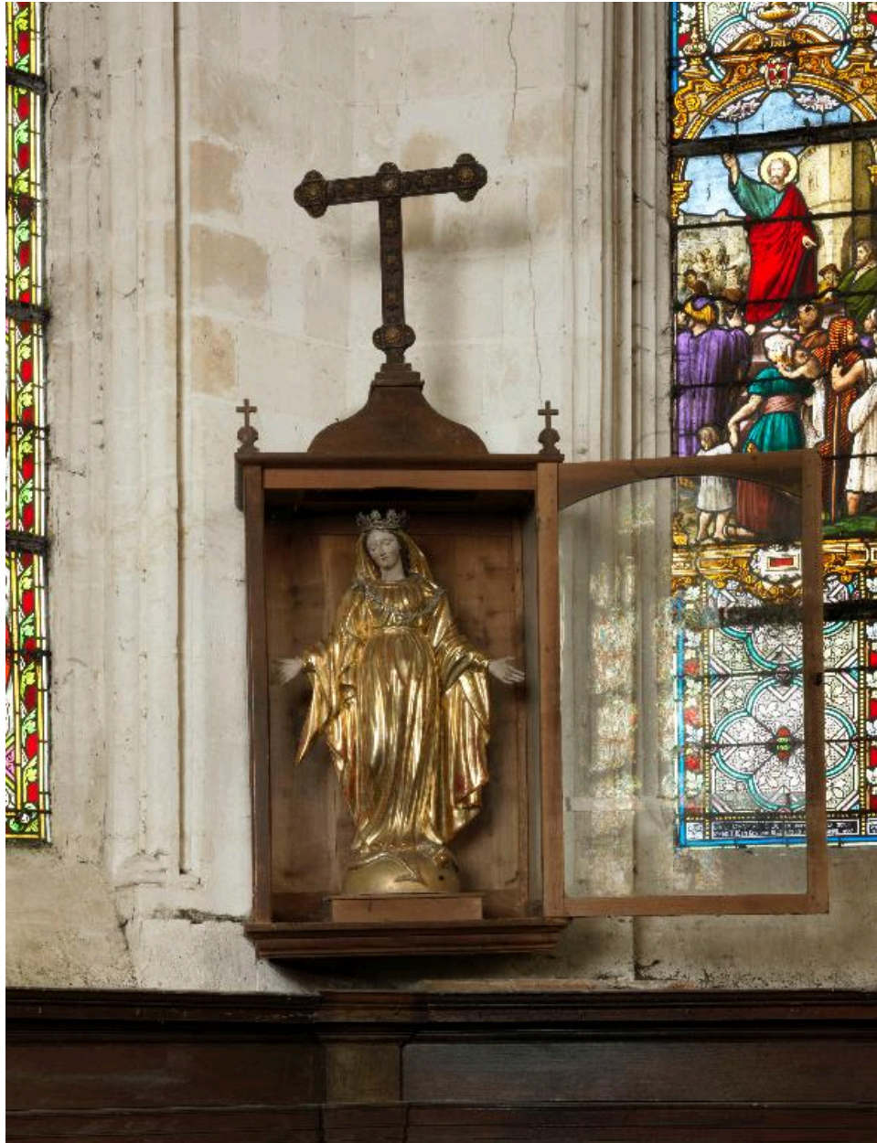
Immaculée Conception dans une vitrine, bois doré, milieu du 19e siècle.