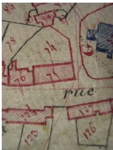
Extrait de la feuille cadastrale E2. Plan de situation en 1810.

IVR31_20045905247NUCA