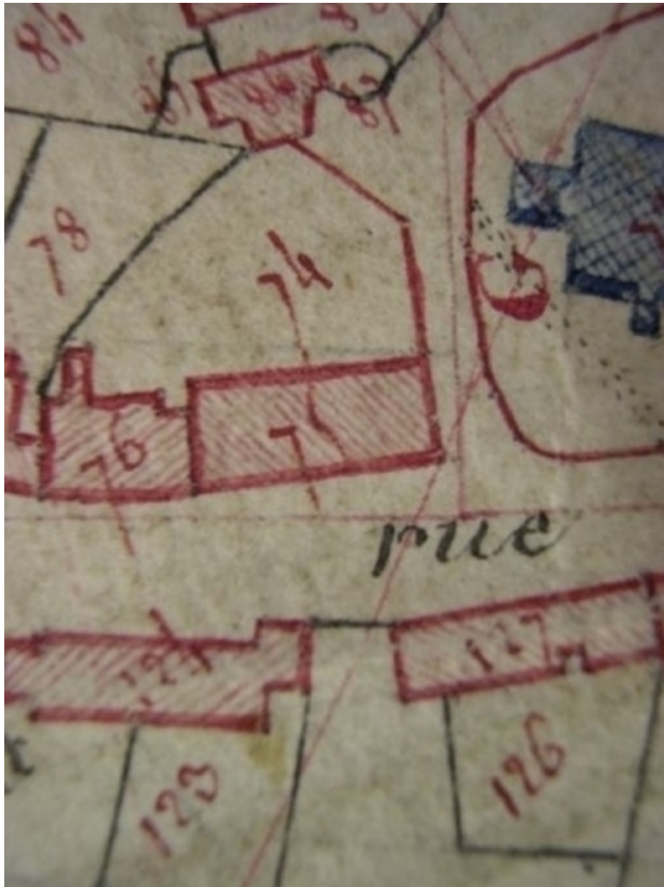
Extrait de la feuille cadastrale E2. Plan de situation en 1810.