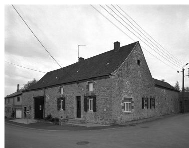
Vue générale. IVR31_20055904317V

IVR31_20045905248NUCA