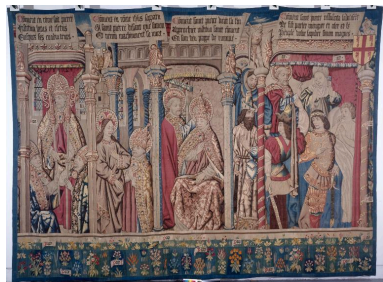
Vue d'ensemble. IVR22_19916000104VA