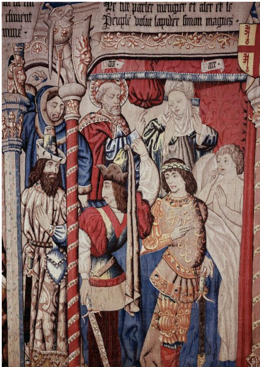
Vue de la scène représentant saint Pierre ressuscitant un jeune homme devant Néron et Simon le Magicien.