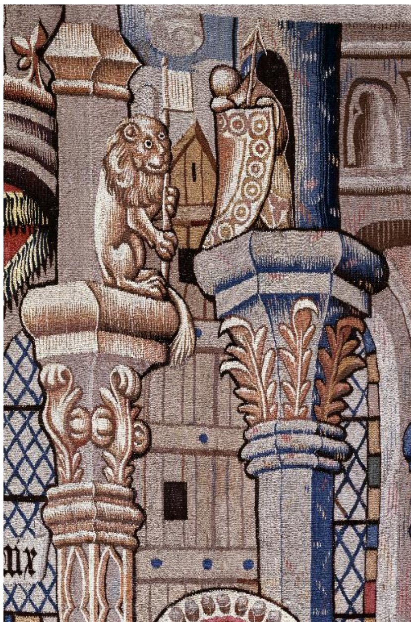
Détail de la partie supérieure de la scène illustrant Jésus annonçant à saint Pierre les machinations de Simon et Néron : un lion.