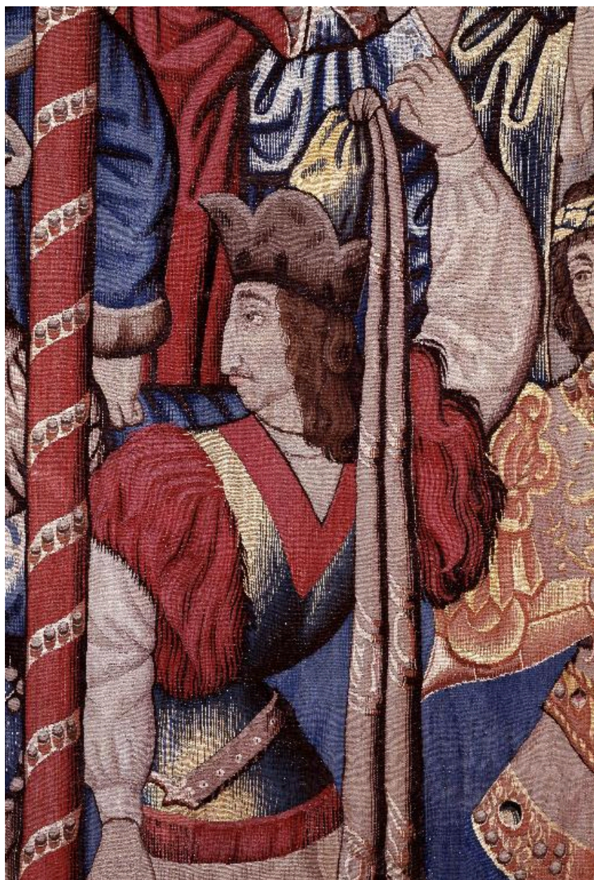
Vue de détail d'un des personnages de la scène de la résurrection du jeune homme par saint Pierre.