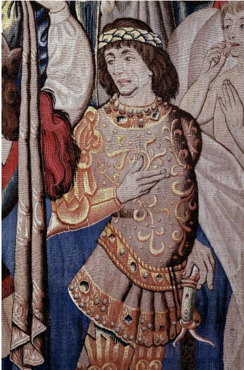
Vue de détail, scène de la résurrection du jeune homme par saint Pierre : Hérode.