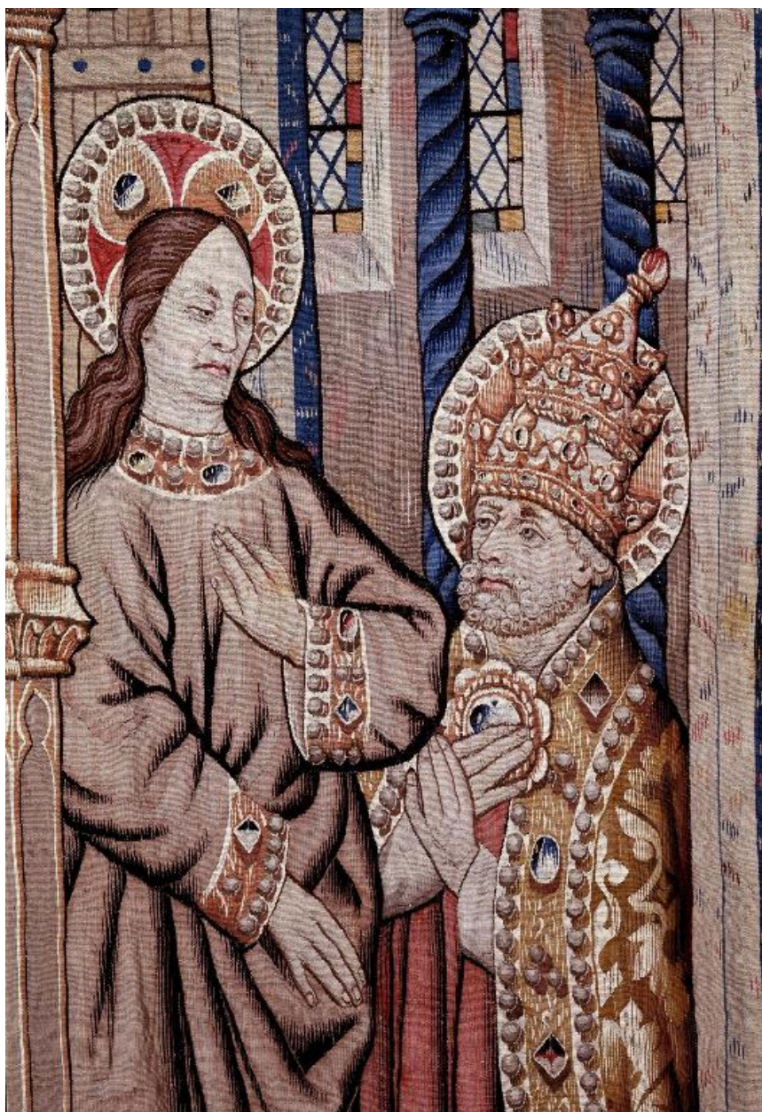
Vue de la scène illustrant Jésus annonçant à saint Pierre les machinations de Simon et Néron.