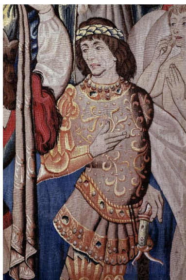
Vue de détail, scène de la résurrection du jeune homme par saint Pierre : Hérode. IVR22_19916000085XA