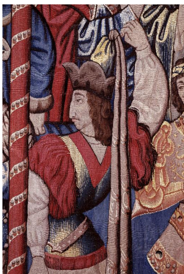
Vue de détail d'un des personnages de la scène de la résurrection du jeune homme par saint Pierre. IVR22_19916000089XA