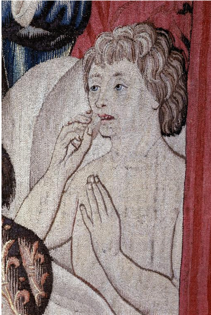
Vue de détail du jeune homme ressuscité par saint Pierre.