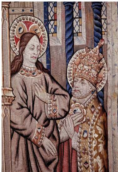
Vue de la scène illustrant Jésus annonçant à saint Pierre les machinations de Simon et Néron.