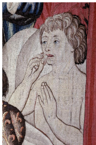
Vue de détail du jeune homme ressuscité par saint Pierre. IVR22_19916000083XA