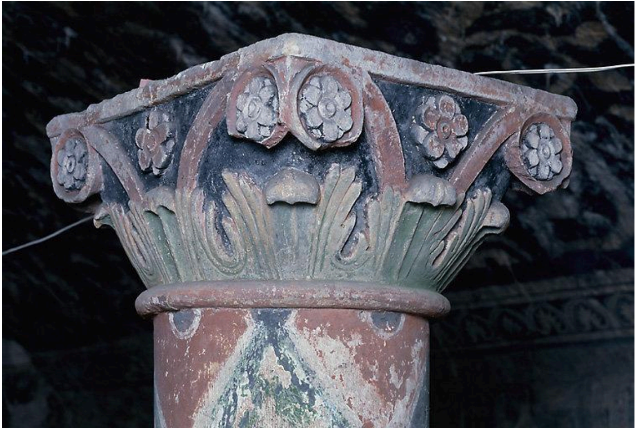
Vue d'angle d'un des éléments.