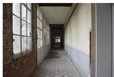
Le couloir reliant les ailes. IVR31_20095903332NUCA