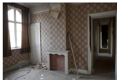
Une des chambres des sœurs supérieures.