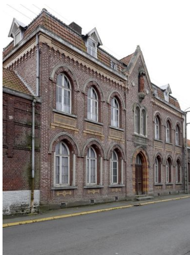
L'entrée principale.