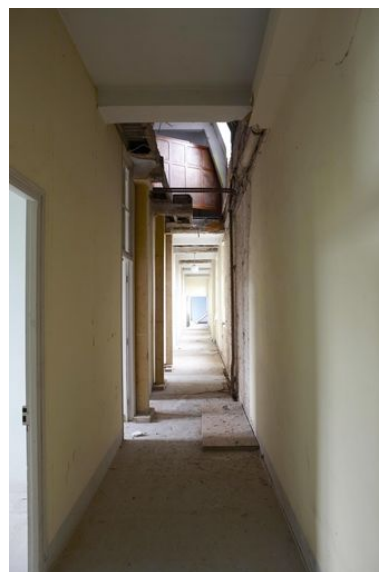
Le couloir desservant les salles de classes du premier étage du bâtiment sud. IVR31_20095903340NUCA