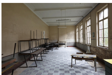
Une salle de classe (?).