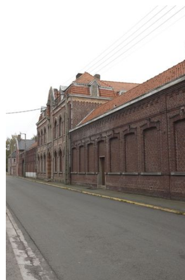
La façade sur la rue.