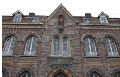
La travée centrale de l'entrée principale.