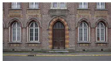
Le rez-de-chaussée de l'entrée principale.