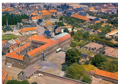
Vue aérienne du couvent, vers 1975.