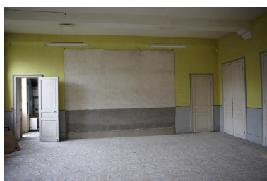
Le réfectoire et les cuisines à l'arrière-plan gauche.