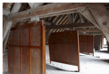
Les combles de l'aile sur rue. IVR31_20095903346NUCA