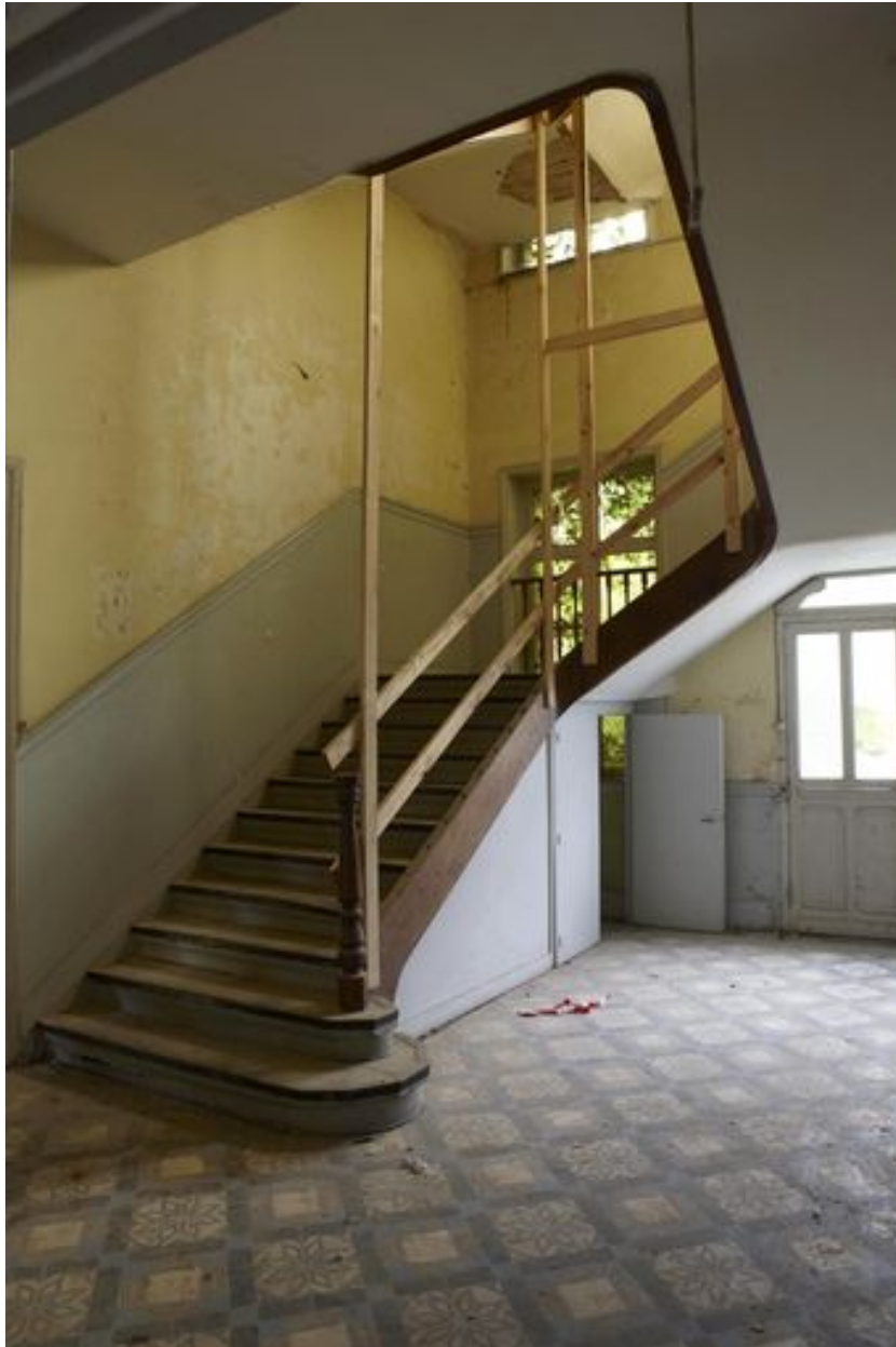
L'escalier de distribution.