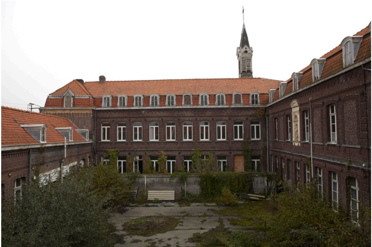
La cour ouest.