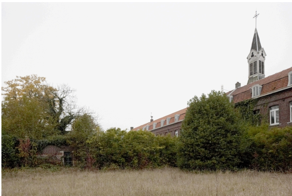
Le jardin du couvent.