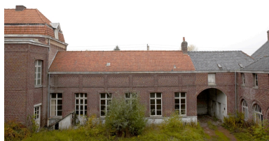
La cour orientale : le rez-de-chaussée de l'aile nord, le porche et l'amorce de l'aile (est) en retour.