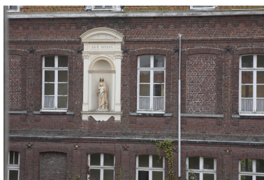
La niche abritant la Vierge, aile nord du bâtiment méridional.