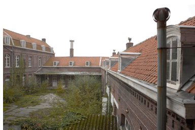
Les combles de la cour ouest.