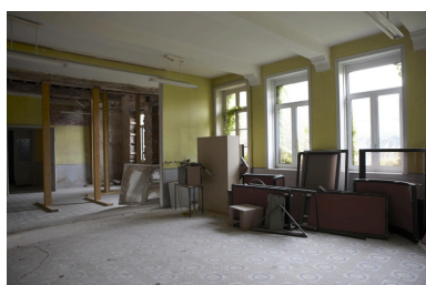
Le réfectoire.