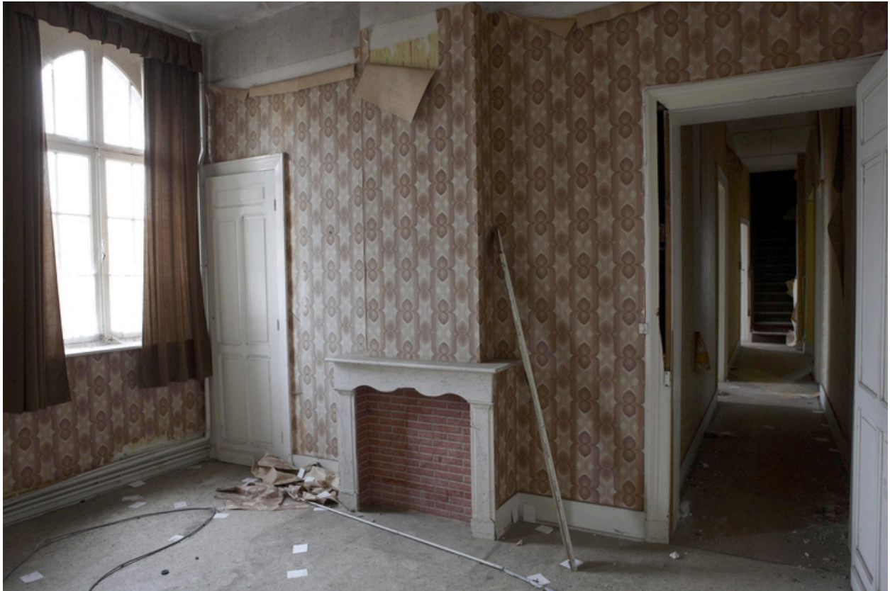
Une des chambres des soeurs supérieures.