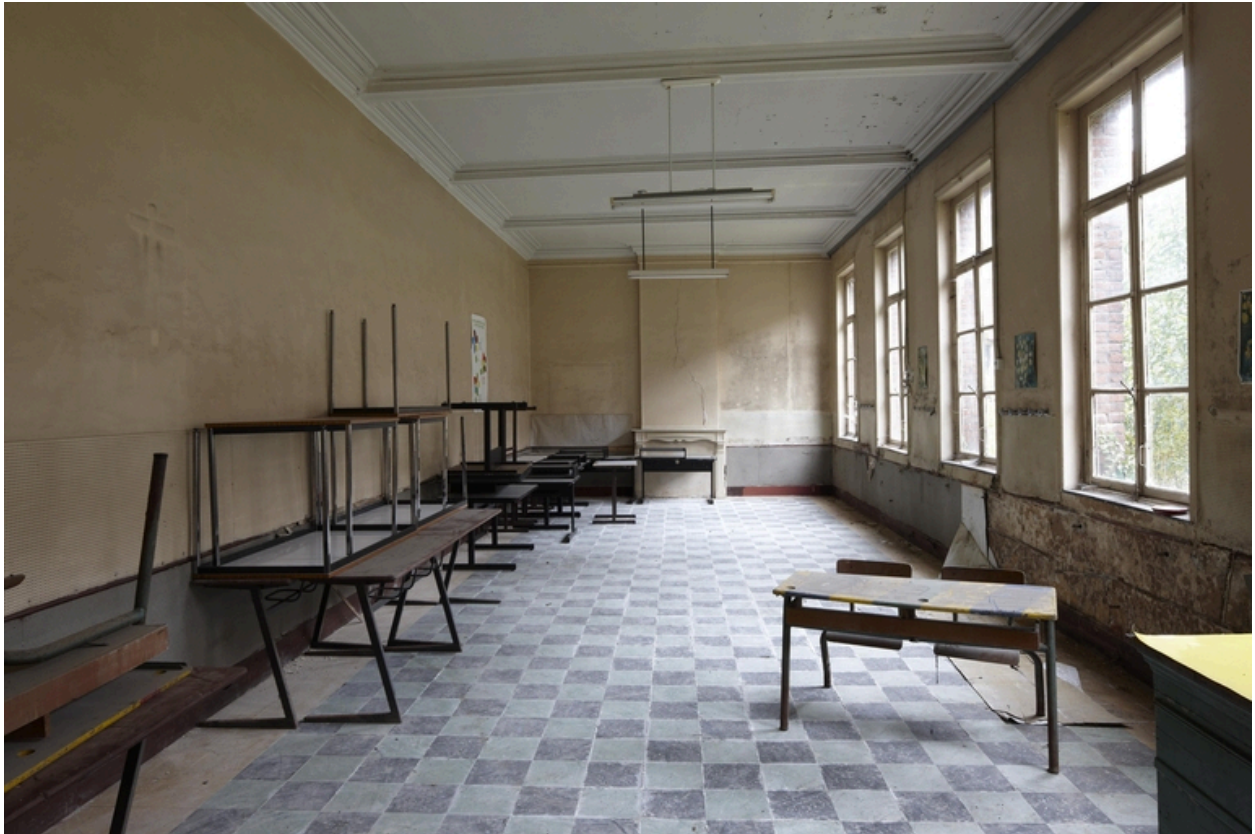
Une salle de classe (?).