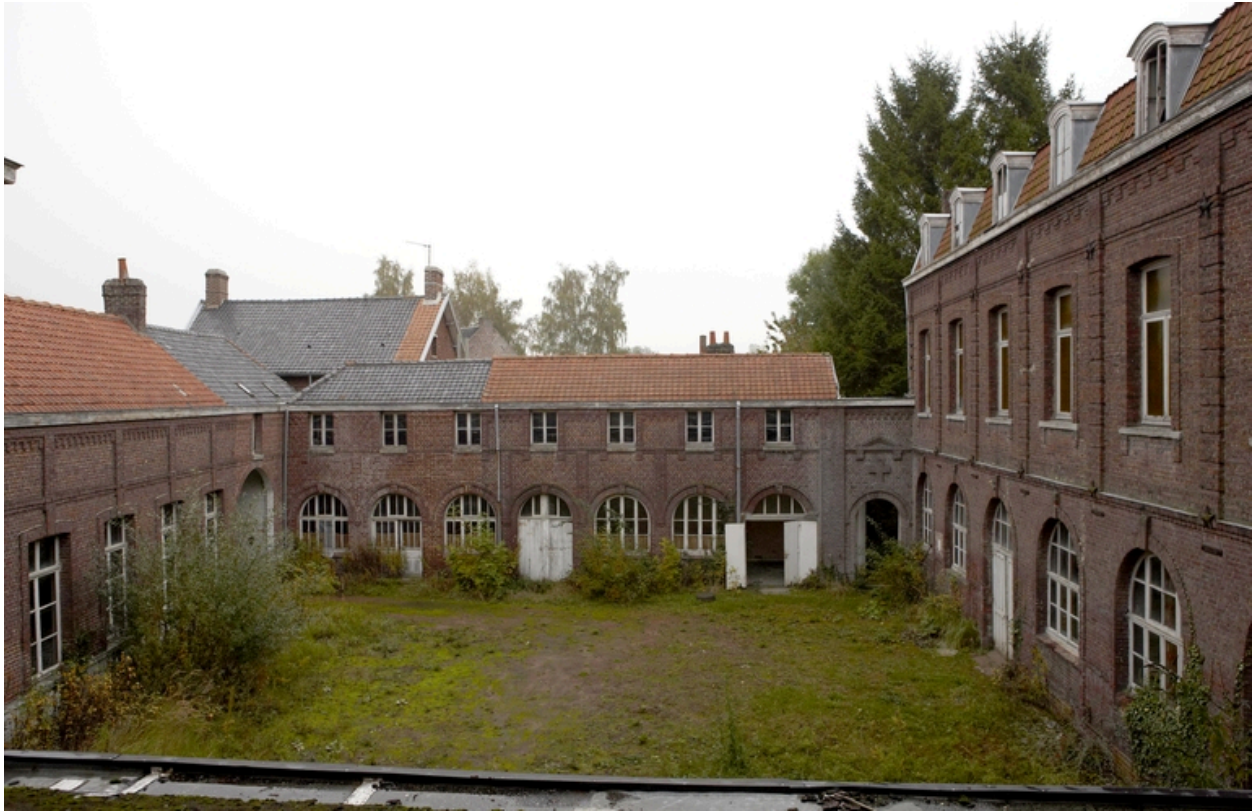
Vue générale de la cour orientale : l'aile sur rue, les communs, l'accès au jardin, l'aile méridionale.