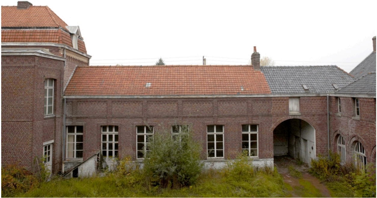
La cour orientale : le rez-de-chaussée de l'aile nord, le porche et l'amorce de l'aile (est) en retour.