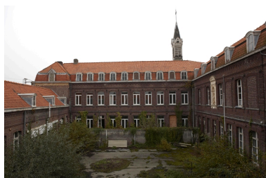
La cour ouest.