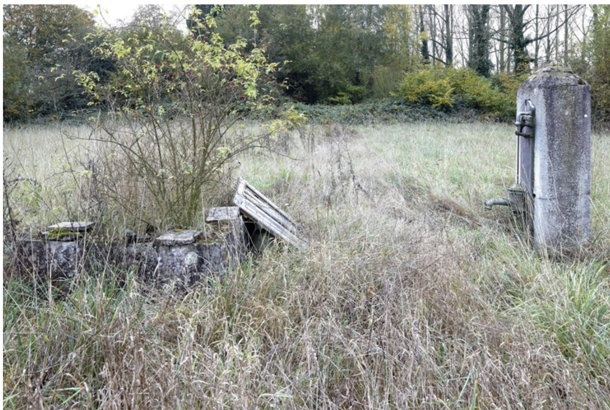
La pompe dans le jardin.