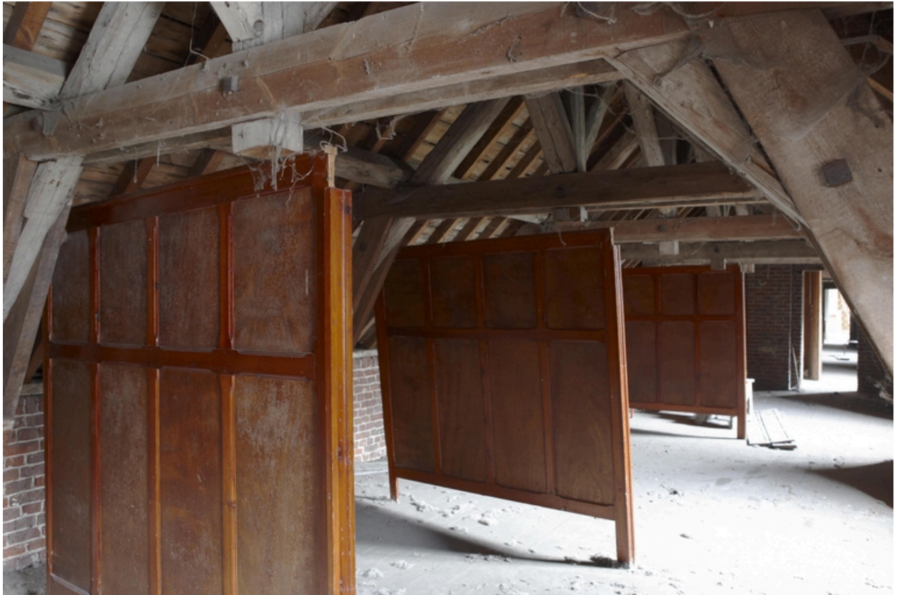
Les combles de l'aile sur rue.