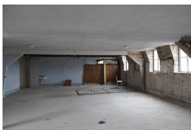
Un dortoir des combles. IVR31_20095903353NUCA