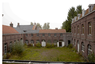
Vue générale de la cour orientale : l'aile sur rue, les communs, l'accès au jardin, l'aile méridionale.