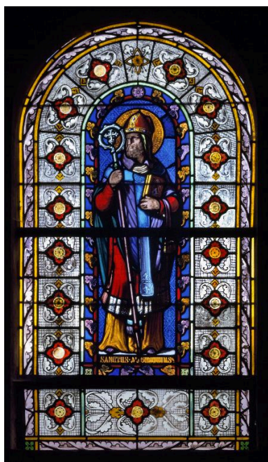
Vue générale de la verrière de la baie 3 : saint Augustin.