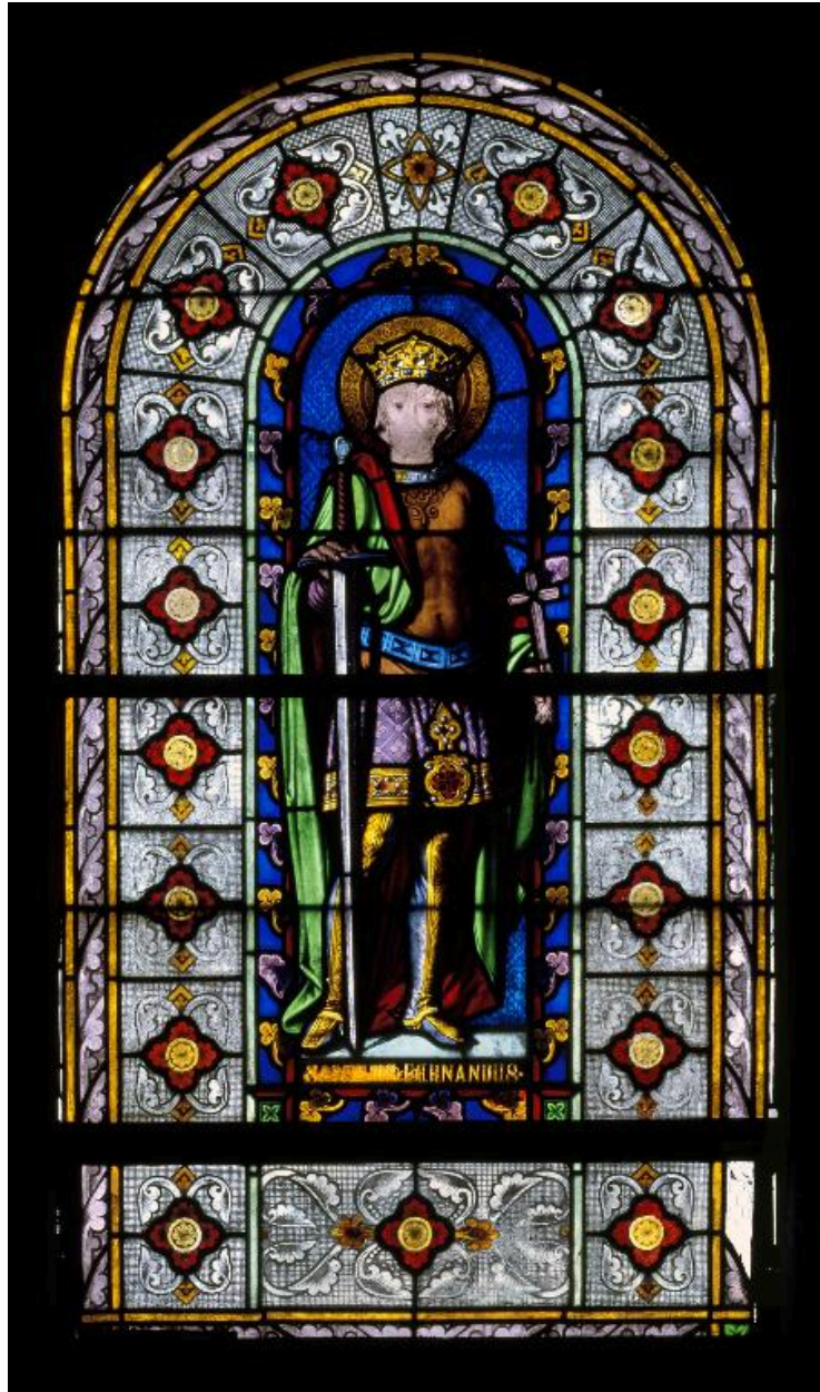
Vue générale de la verrière de la baie 7 : saint Ferdinand.