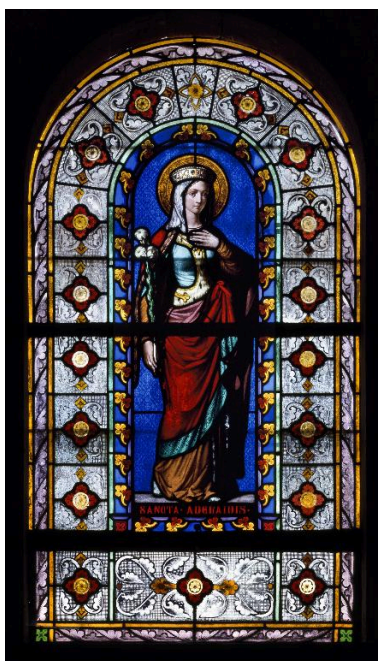
Vue générale de la verrière de la baie 5 : sainte Adélaïde. IVR22_20010201860XA