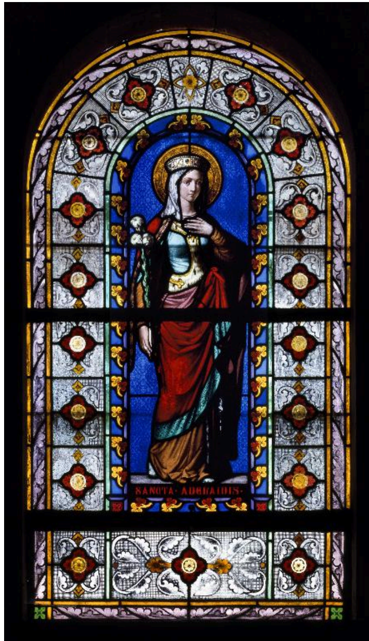
Vue générale de la verrière de la baie 5 : sainte Adélaïde.