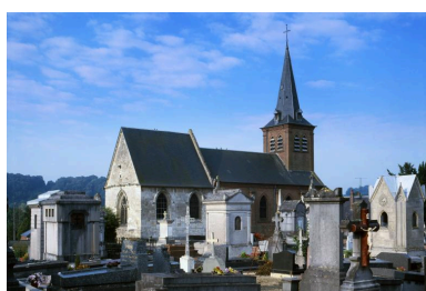
Vue partielle du cimetière, depuis le nord-est, avec l'église en arrière-plan. IVR22_20000202913XA