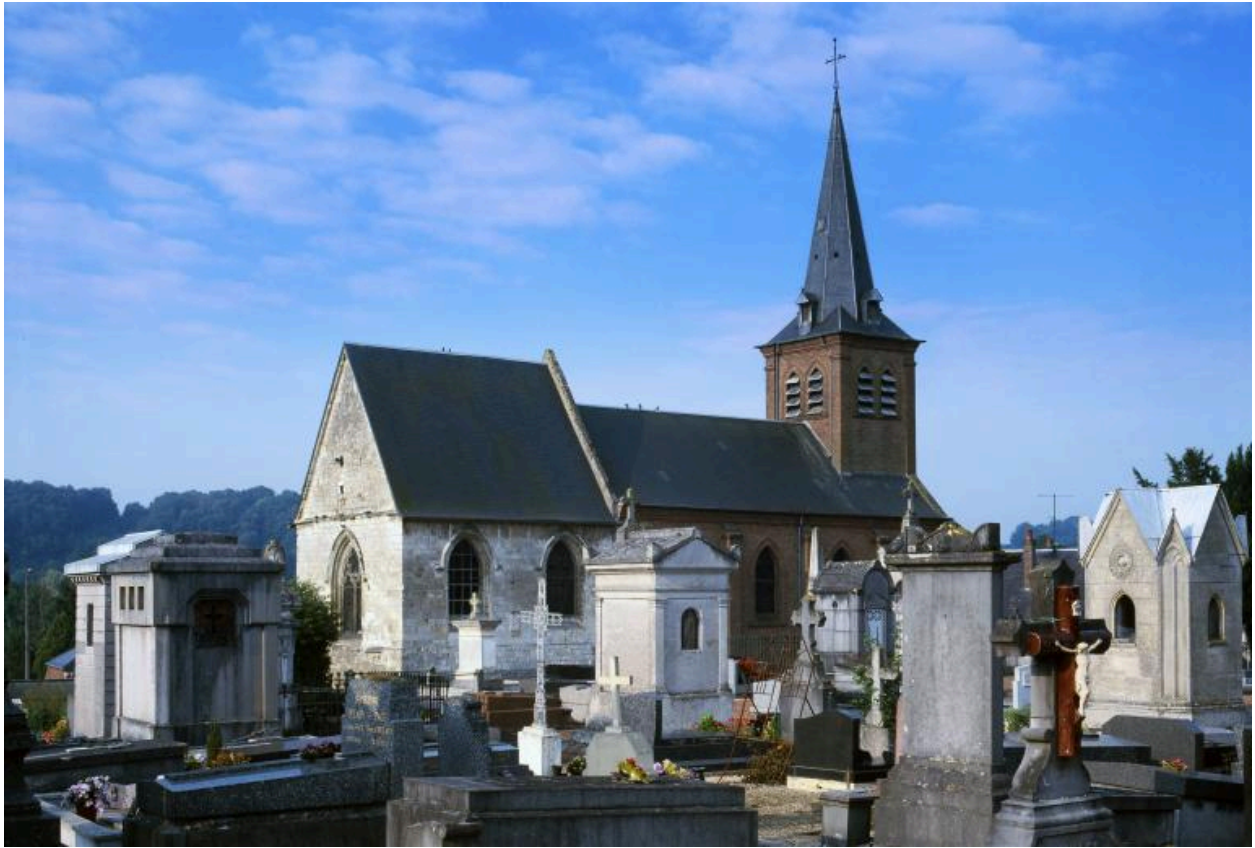
Vue partielle du cimetière, depuis le nord-est, avec l'église en arrière-plan.