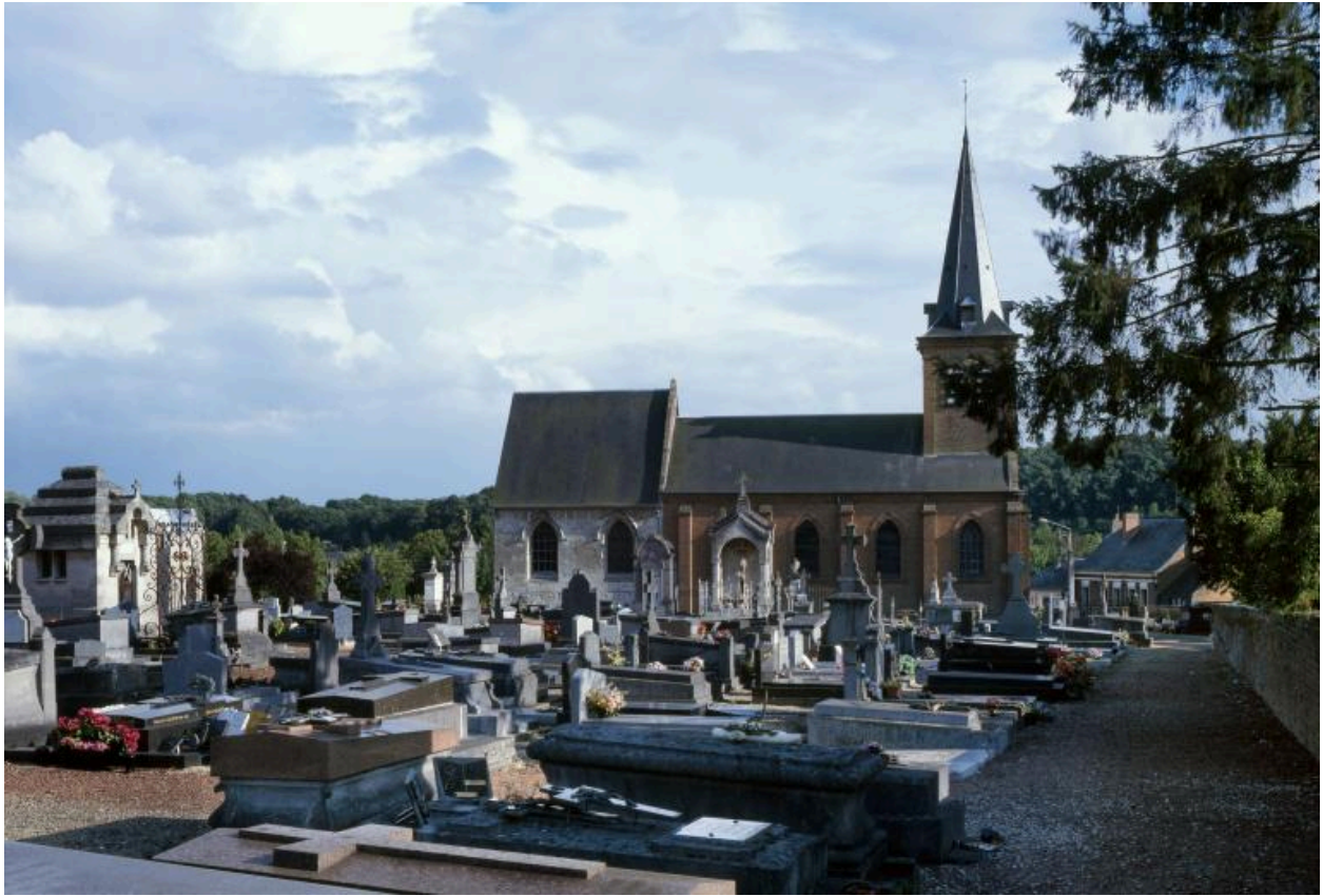
Vue partielle du cimetière, avec l'église en arrière-plan.