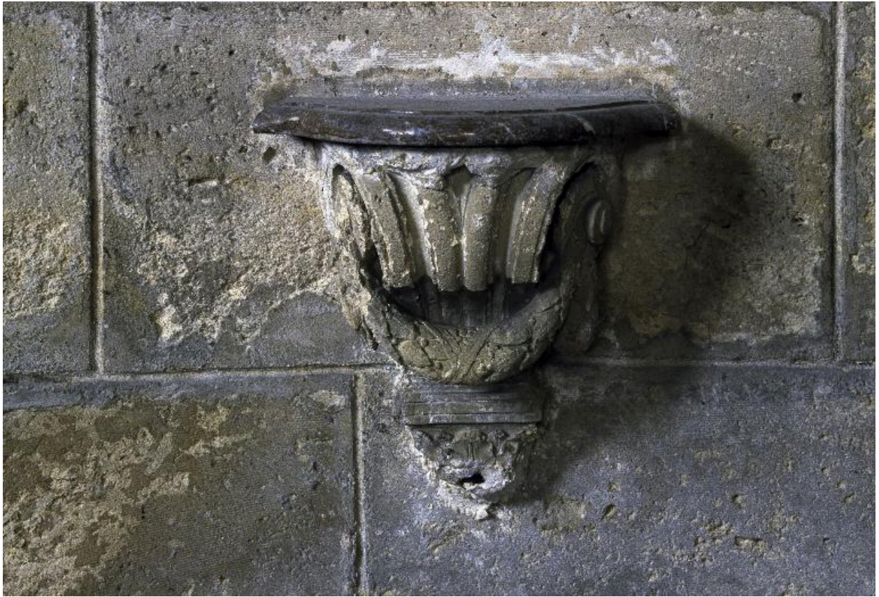
Crédence gauche de la chapelle Saint-Pierre, vue de face.