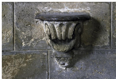
Crédence gauche de la chapelle Saint-Pierre, vue de face. IVR22_20010202358ZA