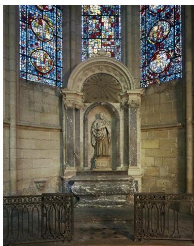
Vue générale de la chapelle Saint-Pierre. IVR22_20050200057VA