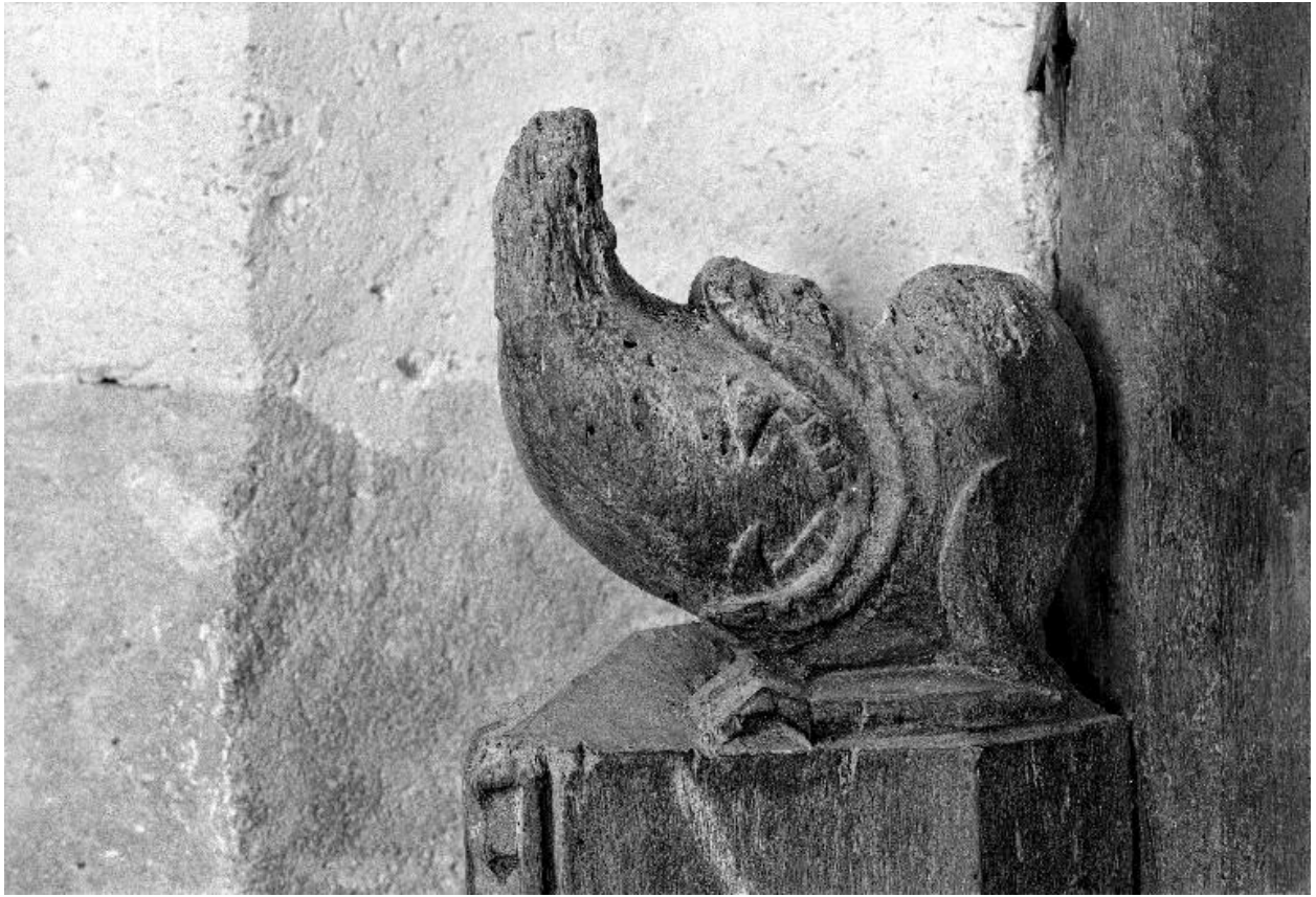
Vue de l'extrémité supérieure d'un montant du lambris, sculptée en forme de monstre dévorant un oiseau.