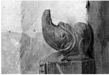
Vue de l'extrémité supérieure d'un montant du lambris, sculptée en forme de monstre dévorant un oiseau.

IVR22_19920202080X