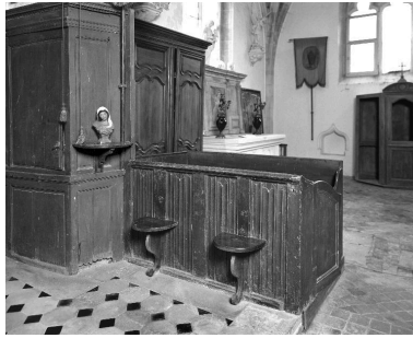
Vue d'un élément du banc, inclus dans un autre banc de fidèles.

IVR22_19920202080X