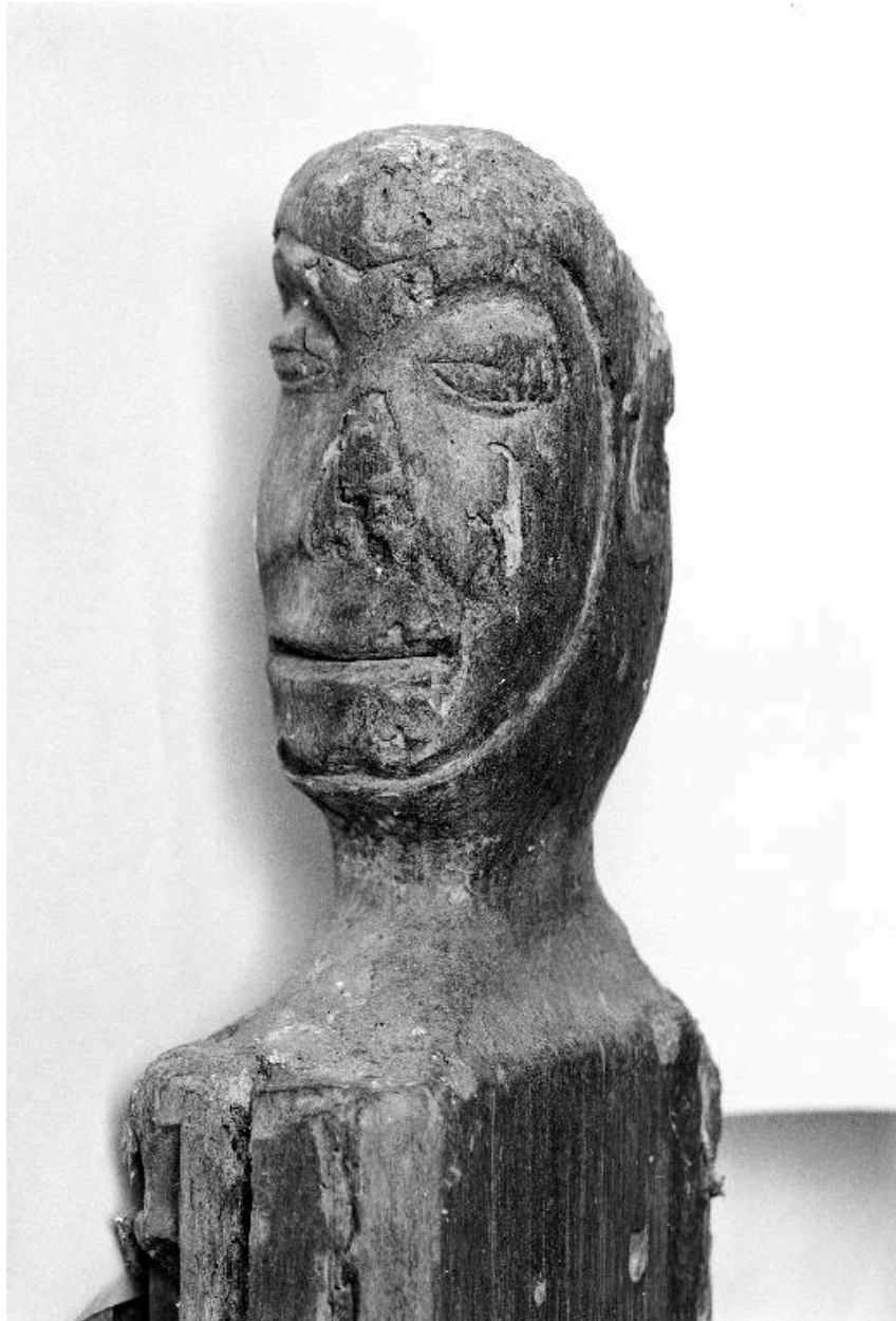
Vue de l'extrémité supérieure d'un montant du lambris, sculptée en forme de tête humaine.