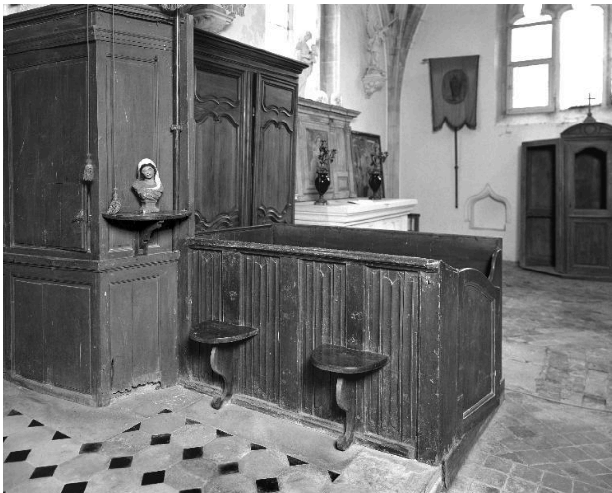
Vue d'un élément du banc, inclus dans un autre banc de fidèles.