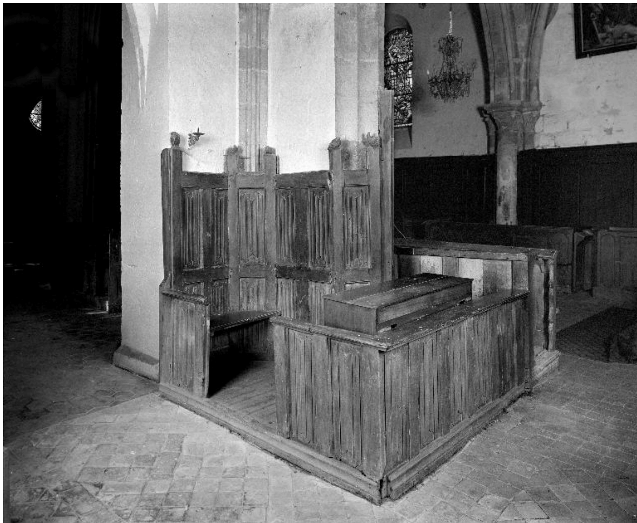
Le banc de fidèles, vu de trois-quarts.