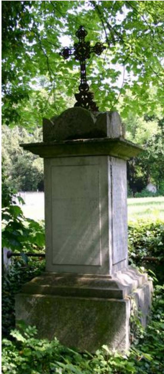
Pilier couronné, surmonté d'une croix en fonte ouvragée.