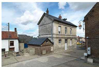
Vue d'ensemble de la façade latérale est, impasse de l'Eglise.