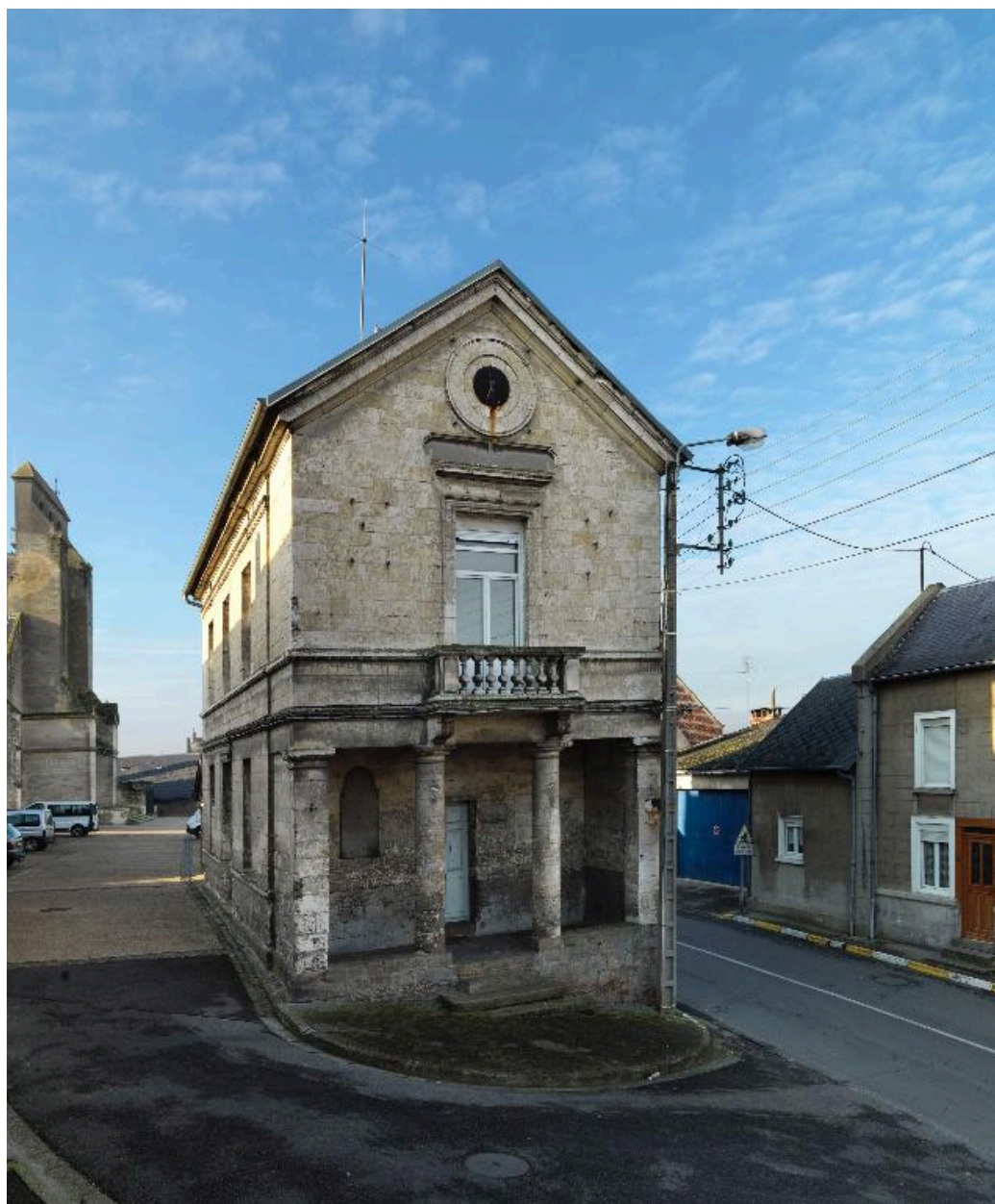
Vue de la façade principale.