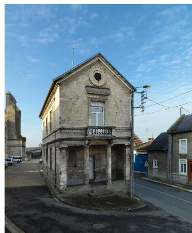
Vue de la façade principale. IVR22_20138000516NUC2A