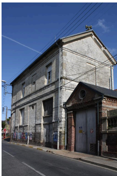
Vue d'ensemble depuis la rue du Maréchal-Leclerc et de la 2e DB. IVR22_20138016057NUC2A