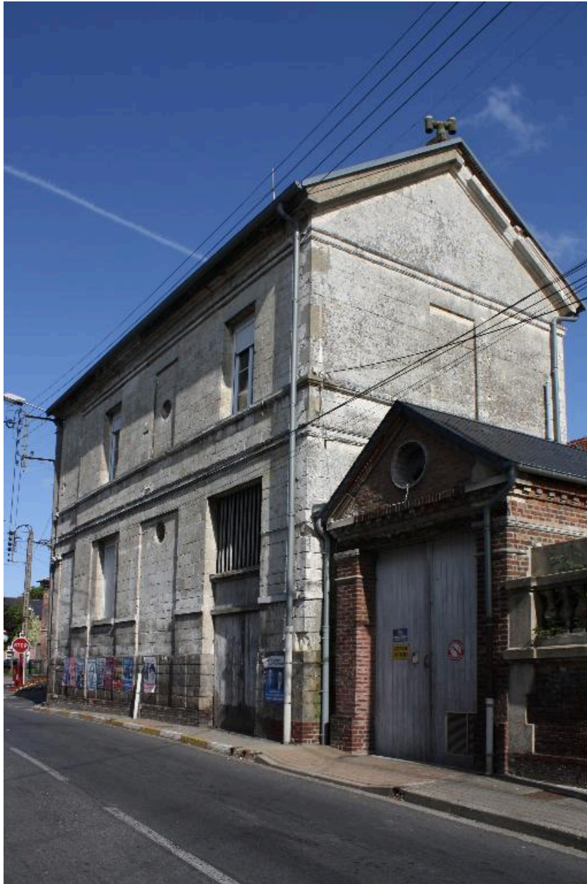
Vue d'ensemble depuis la rue du Maréchal-Leclerc et de la 2e DB.