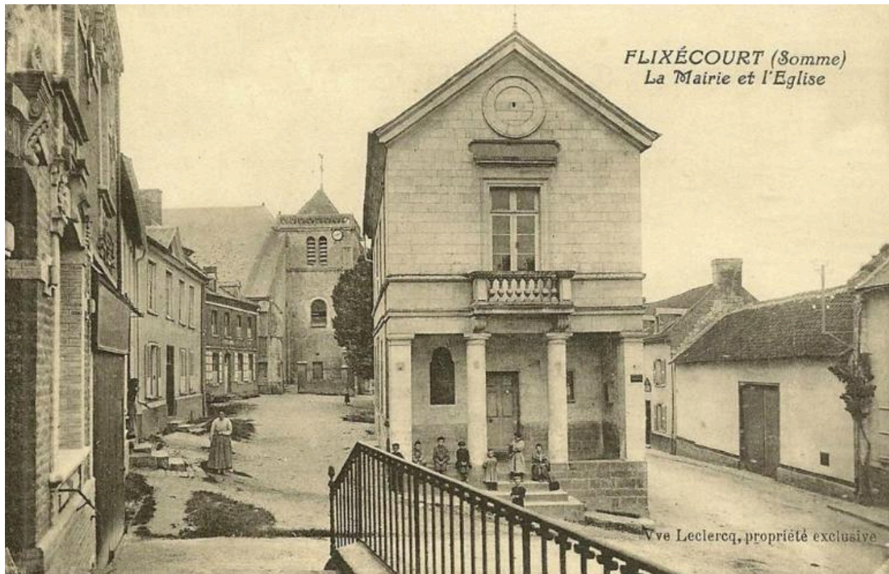
Ancienne mairie, vue de face, vers 1910 (coll. part).