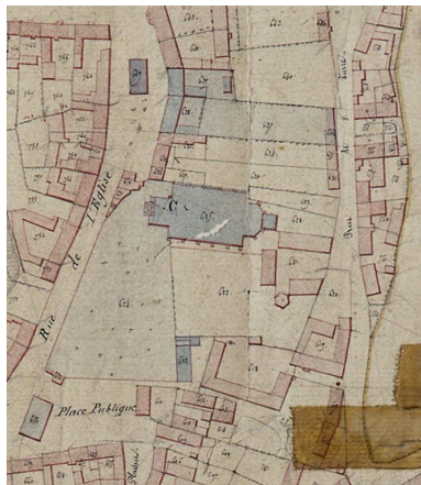
Extrait du cadastre napoléonien, 1834 (AD Somme ; 3P 1619/3).