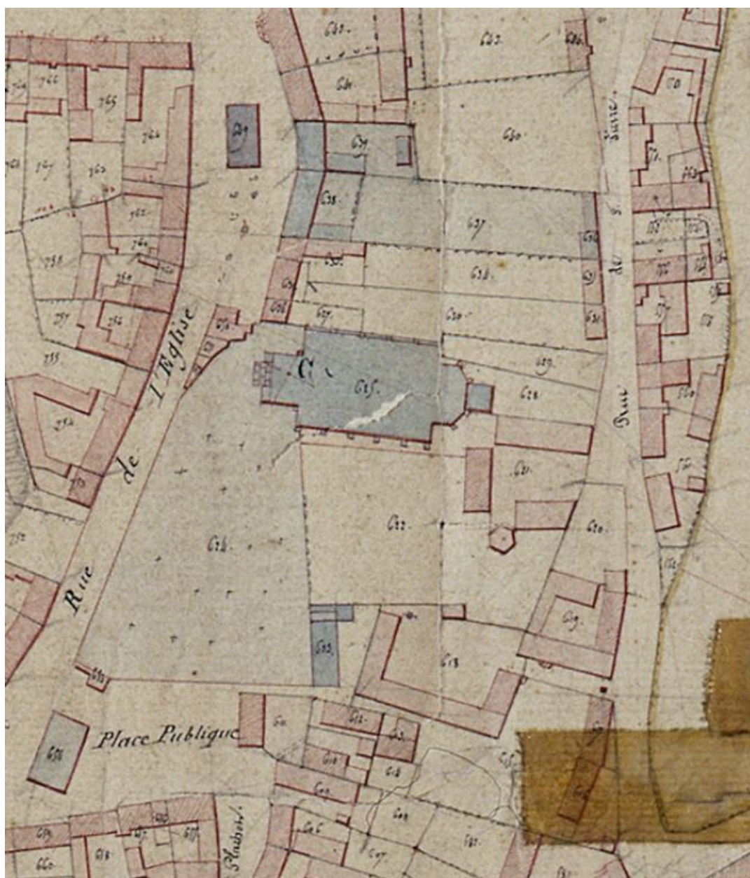
Extrait du cadastre napoléonien, 1834 (AD Somme ; 3P 1619/3).