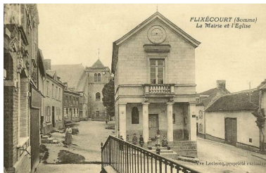
Ancienne mairie, vue de face, vers 1910 (coll. part). IVR22_20128005272NUC2A