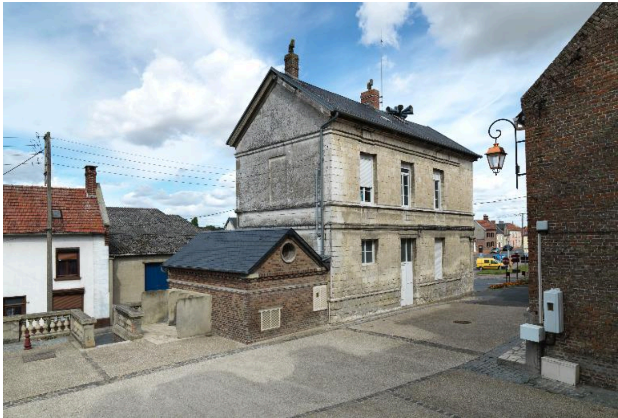
Vue d'ensemble de la façade latérale est, impasse de l'Eglise.