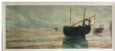
Bateaux sur la grève, toile sans signature. IVR31_20116200986NUC4A