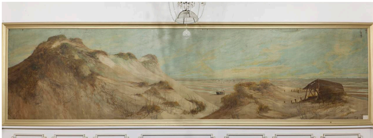
Plage de Groffliers, toile sans signature.