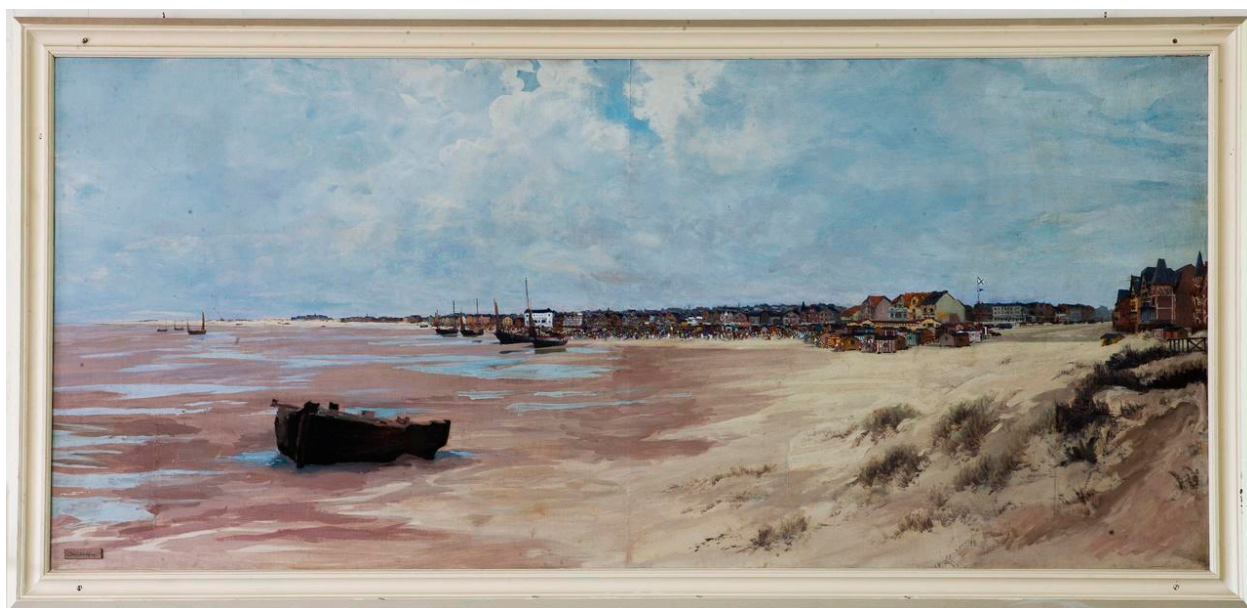
Plage de Berck.