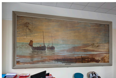
Bateaux en mer.