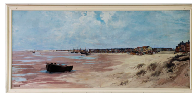
Plage de Berck.