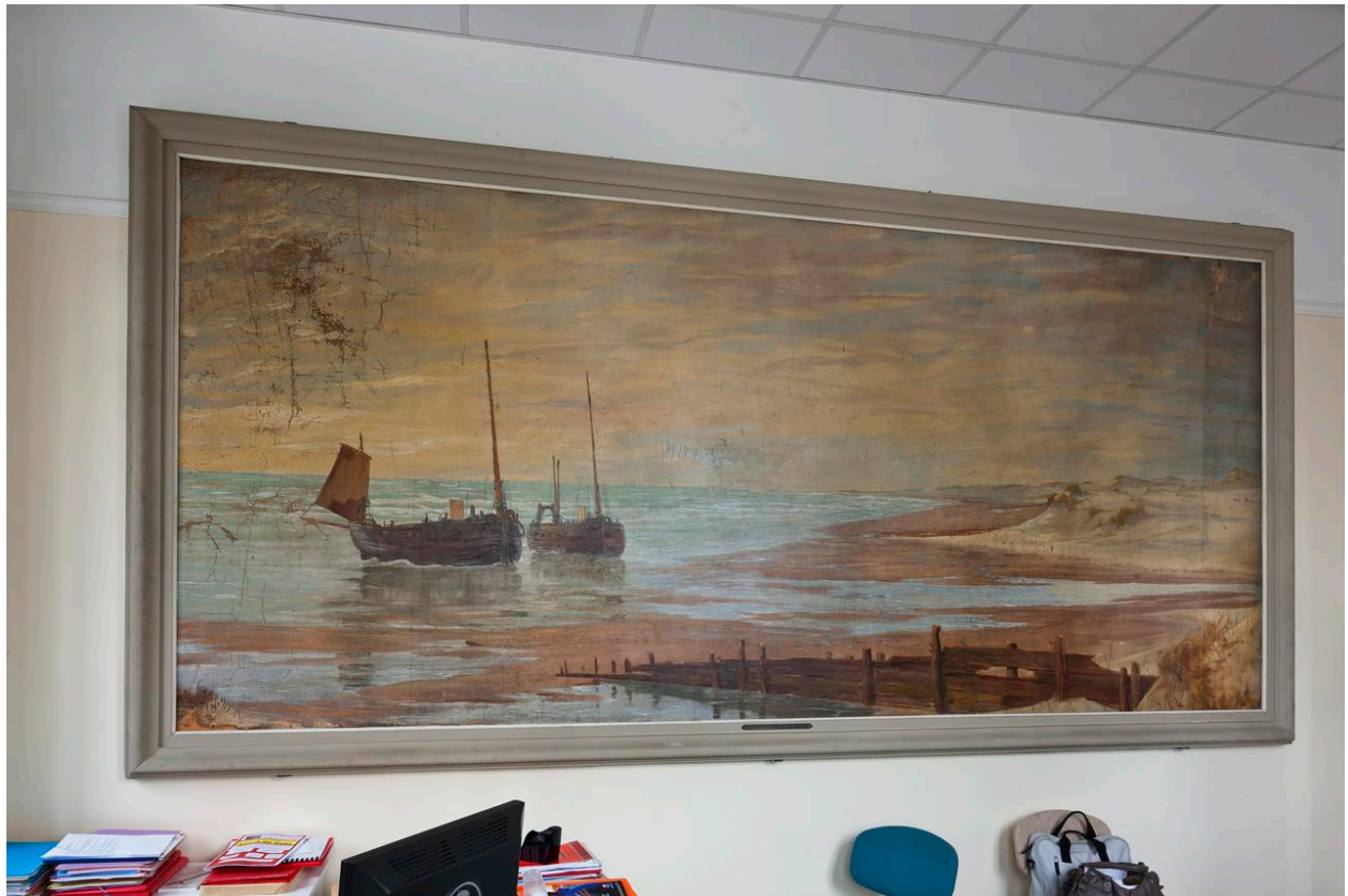
Bateaux en mer.