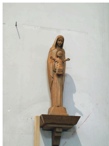
Vierge à l'Enfant IVR31_20126201525NUCA