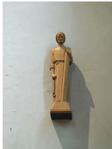
Saint Joseph