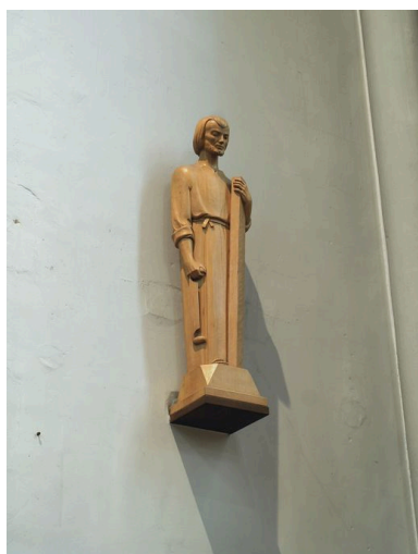
Saint Joseph IVR31_20126201523NUCA