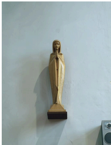
Vierge IVR31_20126201520NUCA