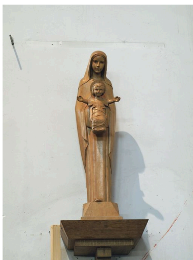
Vierge à l'Enfant