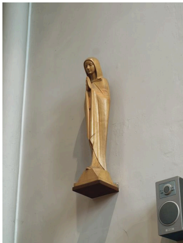
Vierge IVR31_20126201521NUCA