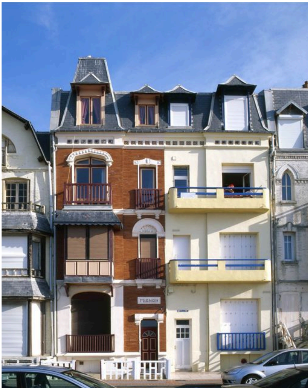
Vue d'ensemble depuis l'esplanade.