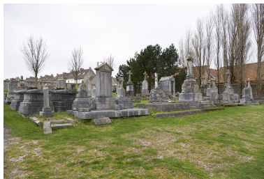
Vue d'une division du cimetière de Capécure. IVR32_20246200101NUCA