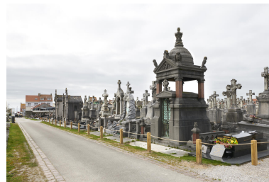
Vue d'une division du cimetière Saint-Pierre. IVR32_20246200079NUCA