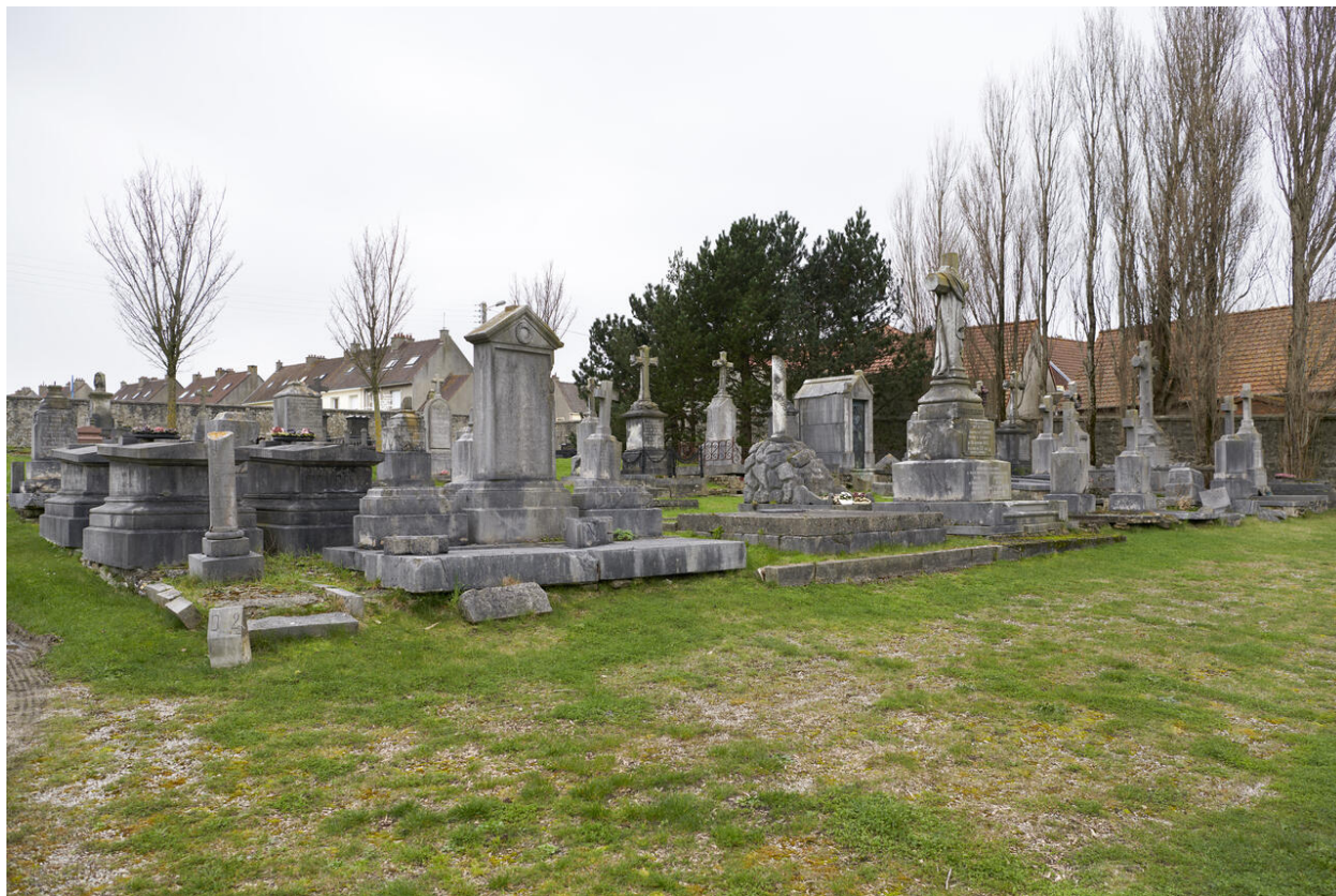
Vue d'une division du cimetière de Capécure.