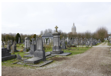
Vue générale du cimetière de l'Est, partie Nord (division 18). IVR32_20246200061NUCA