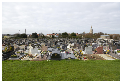
Vue générale du cimetière de l'Est, partie sud. IVR32_20246200055NUCA