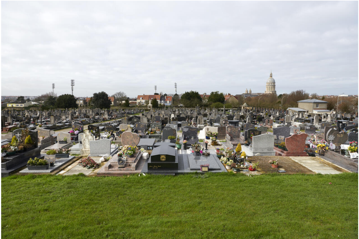
Vue générale du cimetière de l'Est, partie sud.