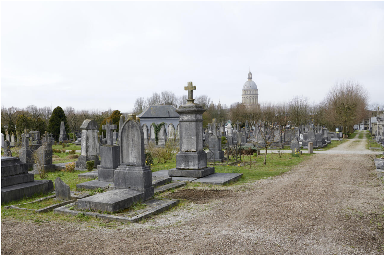
Vue générale du cimetière de l'Est, partie Nord (division 18).