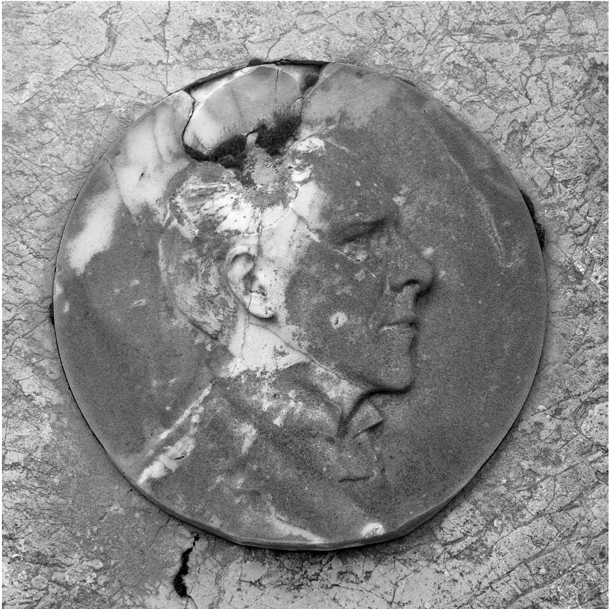
Bas-relief, médaillon : portrait.