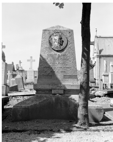
Vue générale. IVR31_19816203416X