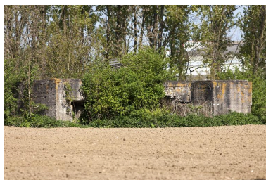
Vue rapprochée vers le nord