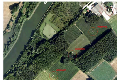
Position de l'édifice (IA59004871) sur une orthophotographie de 2009 IVR32_20175900533NUCA