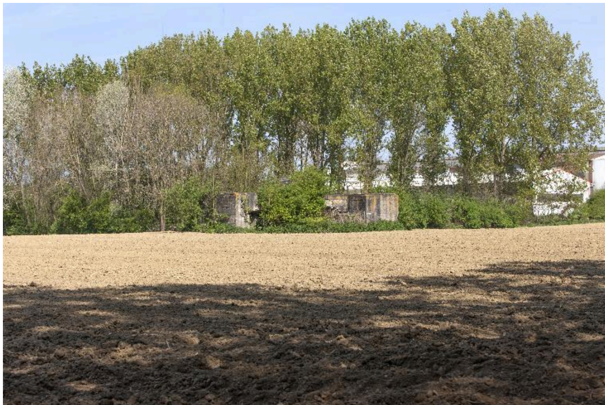
Vue générale vers le nord