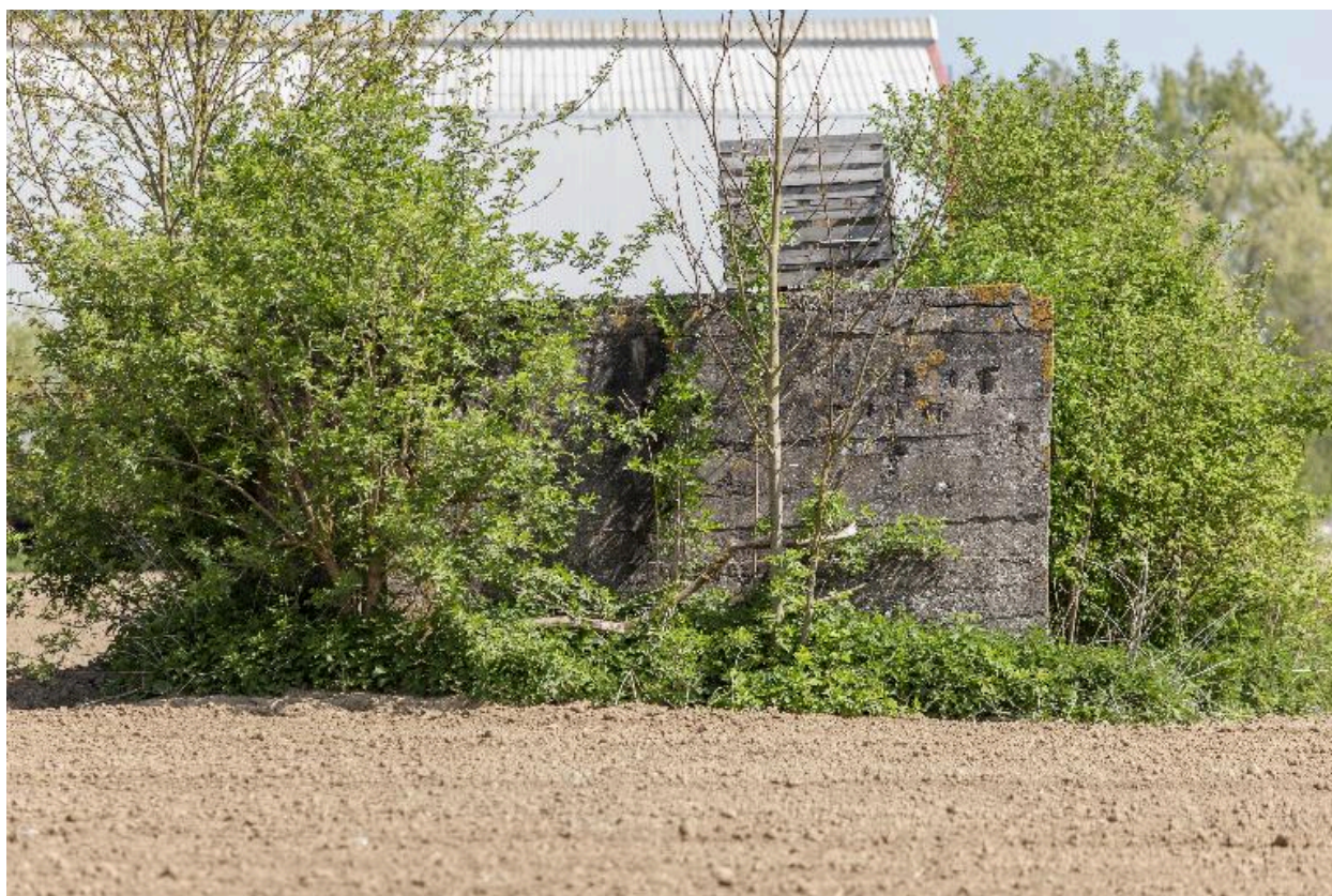
Vue latérale, vers le nord-est