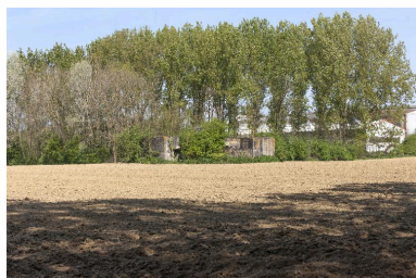
Vue générale vers le nord IVR31_20145904805NUCA