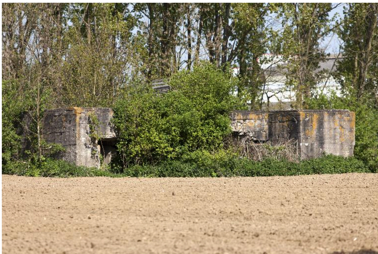
Vue rapprochée vers le nord