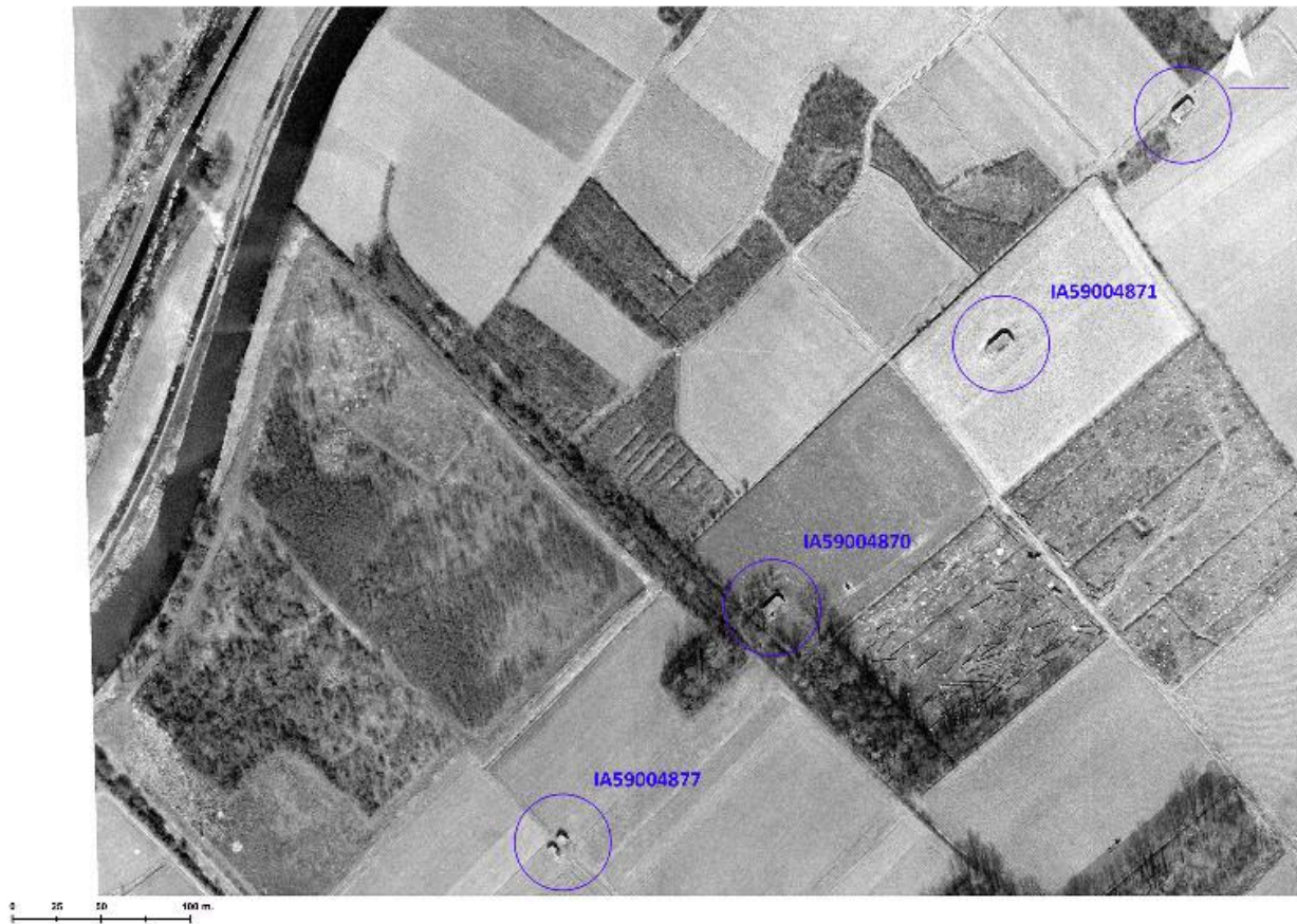
Position de l'édifice (IA59004871) sur photographie aérienne du 13 mars 1965 (IGN, Geoportail).