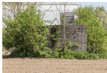
Vue latérale, vers le nord-est IVR31_20145904807NUCA