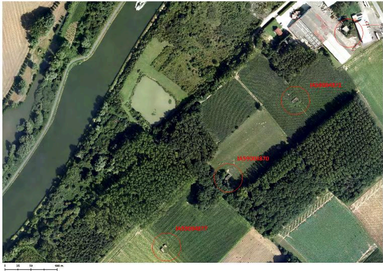
Position de l'édifice (IA59004871) sur une orthophotographie de 2009