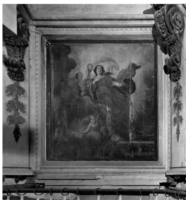
Vue du tableau principal. IVR22_20160200168NUC2