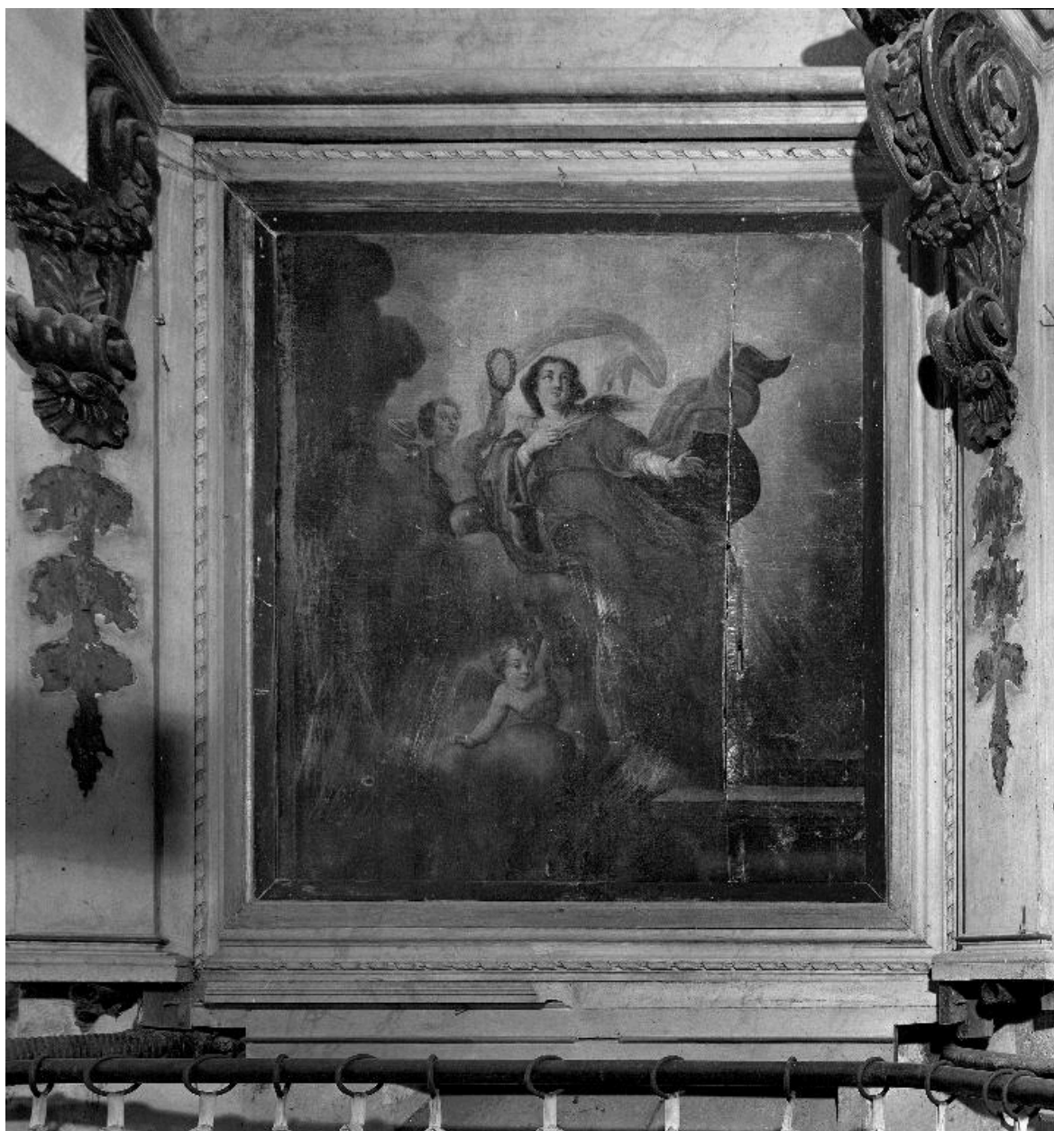
Vue du tableau principal.