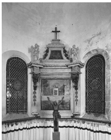
Vue générale du retable et de ses deux tableaux. IVR22_19920203040V