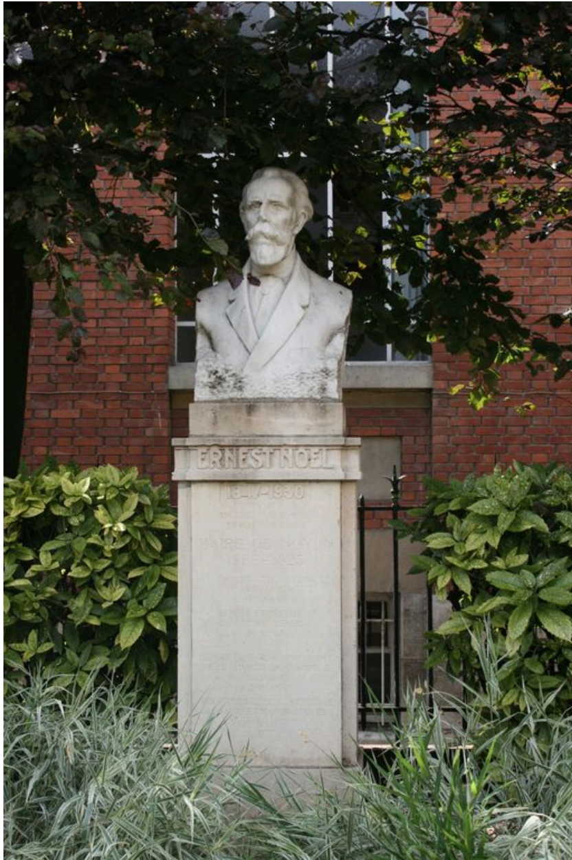
Vue générale du monument.