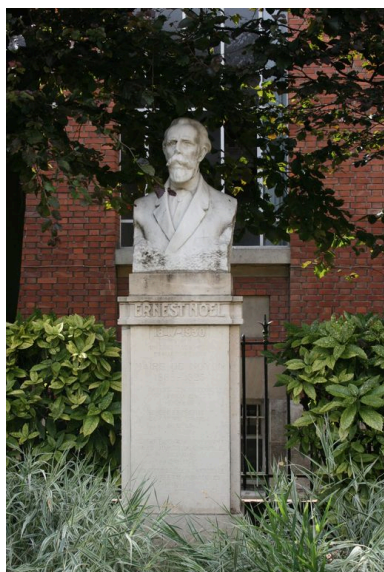
Vue générale du monument. IVR22_20096000141NUCA