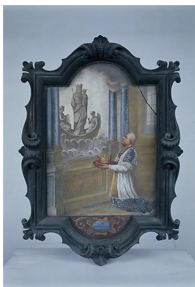
Vue d'ensemble. IVR31_19876201189XA