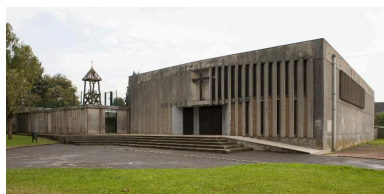
Élévation antérieure et vue extérieure du cloître.