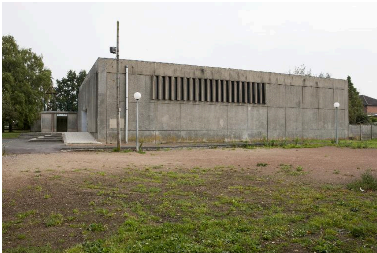
Côté droit de l'église.