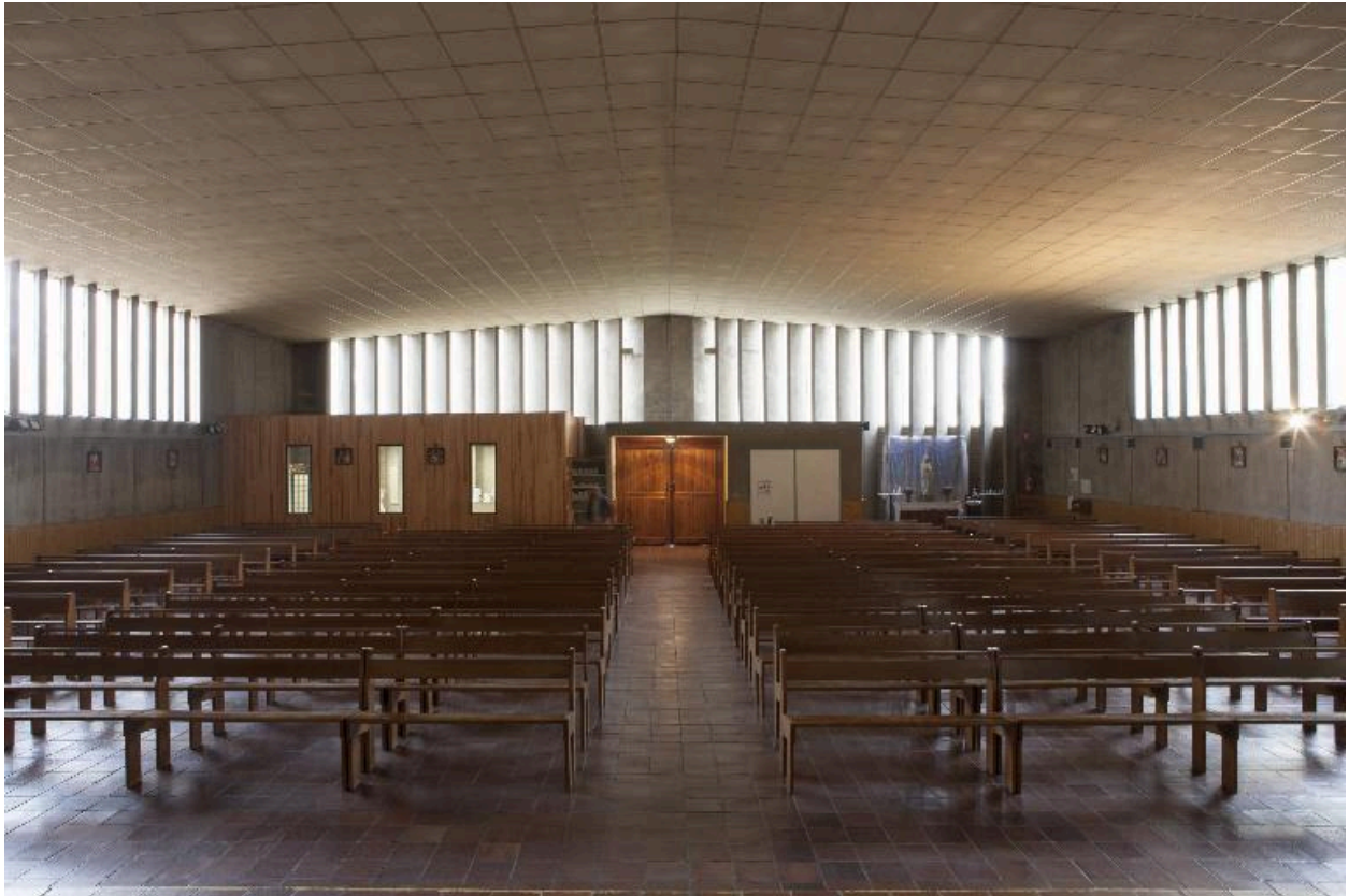
Vue générale depuis le chœur.