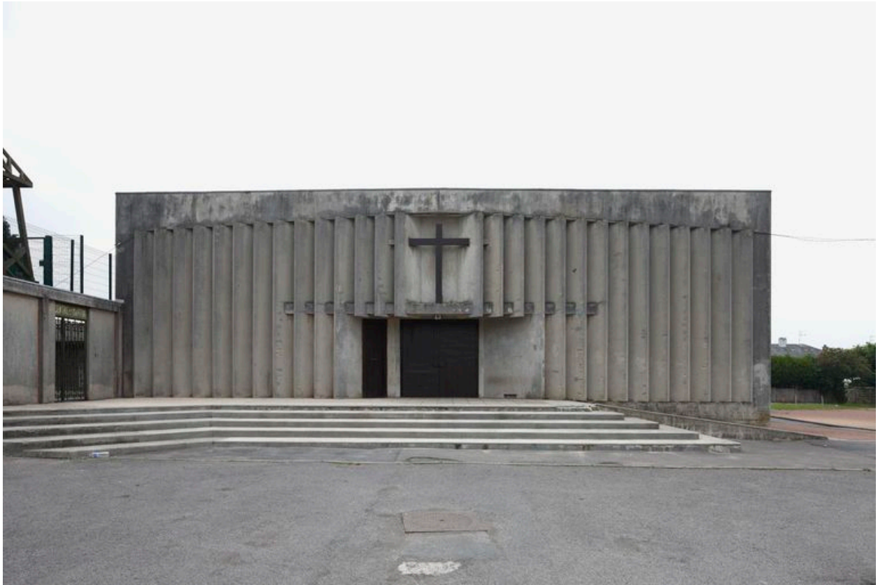
Vue générale de la façade.