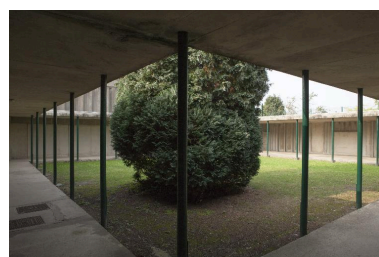
Cloître. IVR31_20155900180NUCA