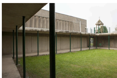
Cloître. IVR31_20155900178NUCA