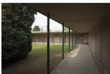
Cloître. IVR31_20155900179NUCA