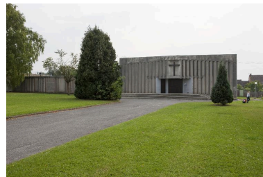
Élévation antérieure. IVR31_20155900189NUCA