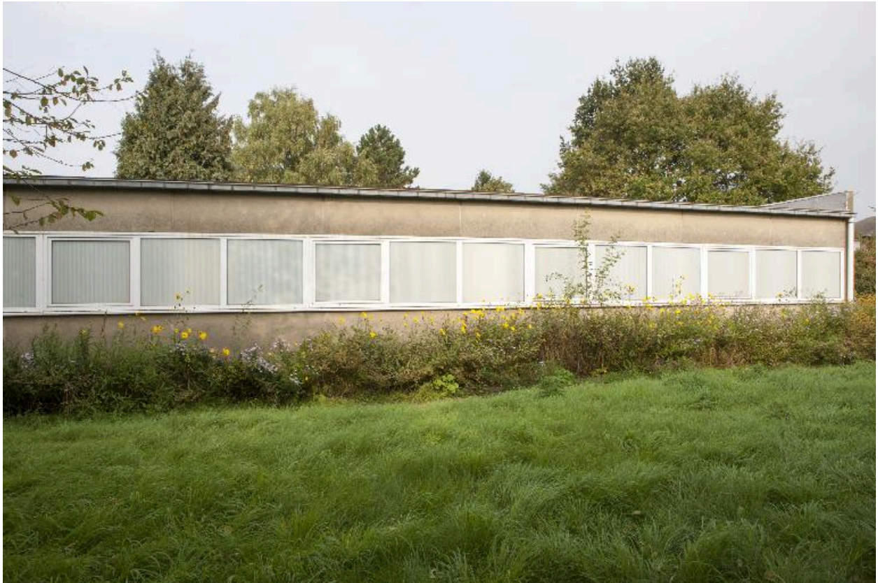
Vue des salles paroissiales à l'arrière de l'église.