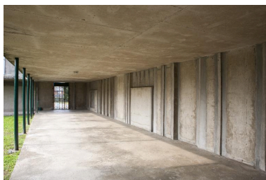
Cloître.