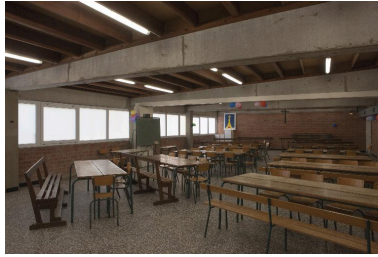
Salle paroissiale. IVR31_20155900181NUCA