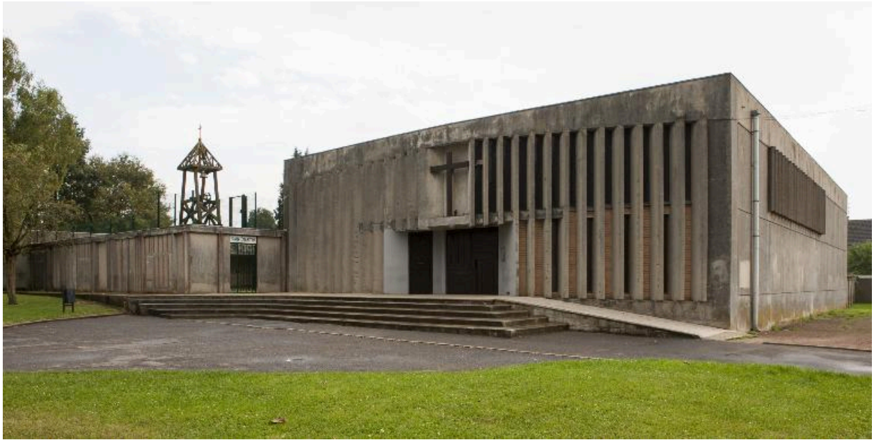
Élévation antérieure et vue extérieure du cloître.