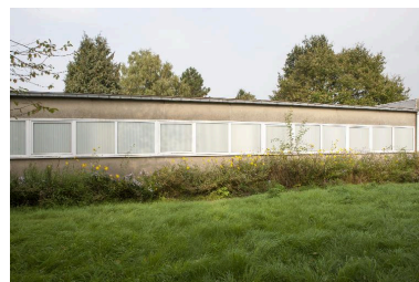
Vue des salles paroissiales à l'arrière de l'église.