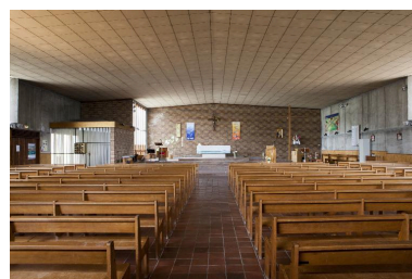
Vue générale vers le chœur.