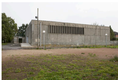
Côté droit de l'église. IVR31_20155900188NUCA