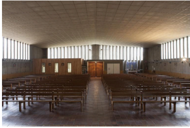
Vue générale depuis le chœur.