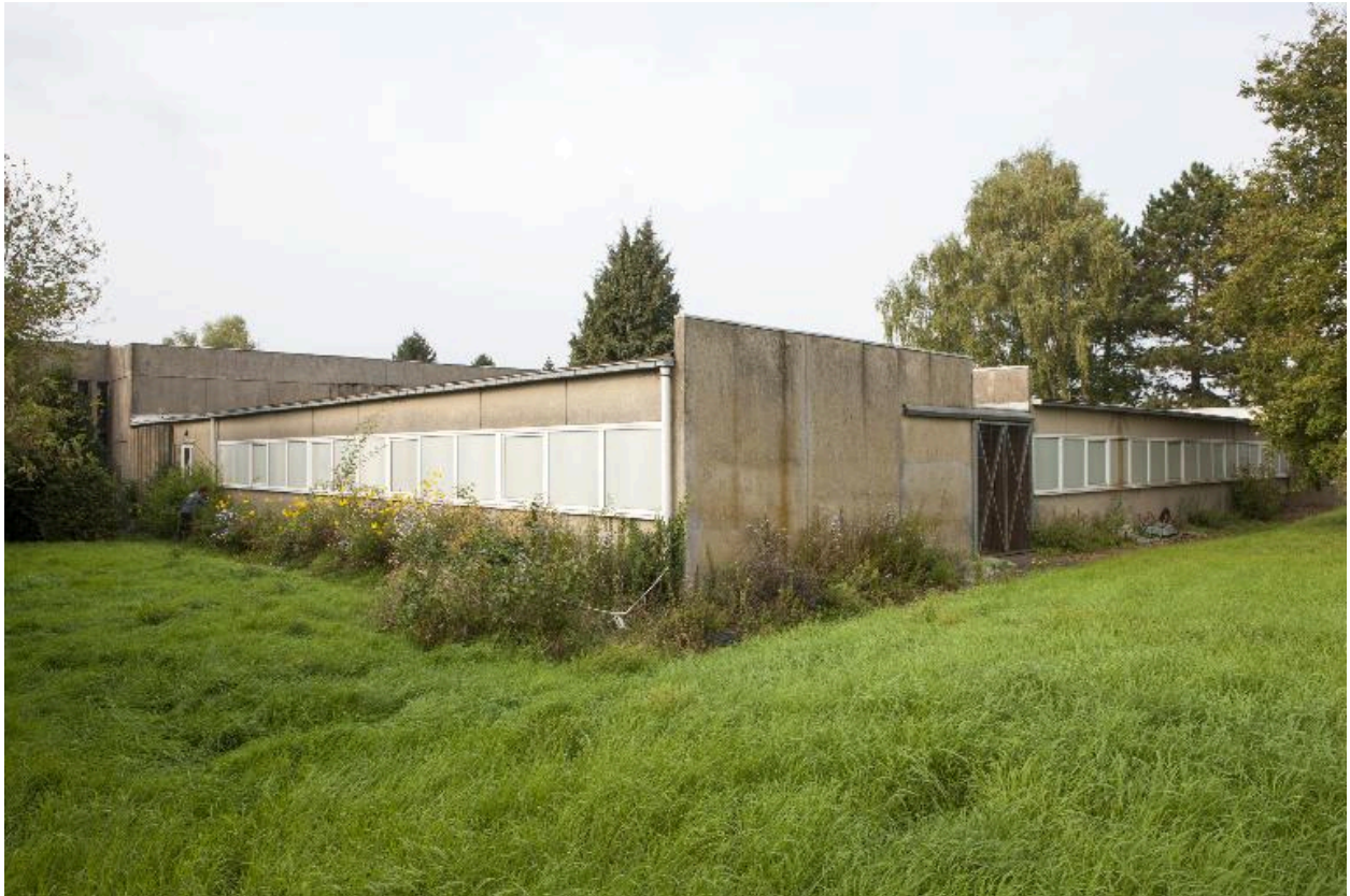
Vue arrière et latérale des salles paroissiales.