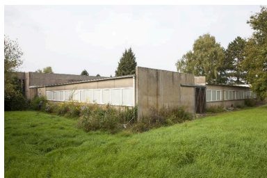
Vue arrière et latérale des salles paroissiales. IVR31_20155900187NUCA