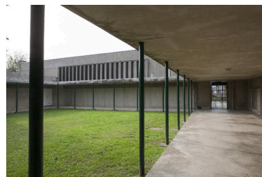
Cloître.