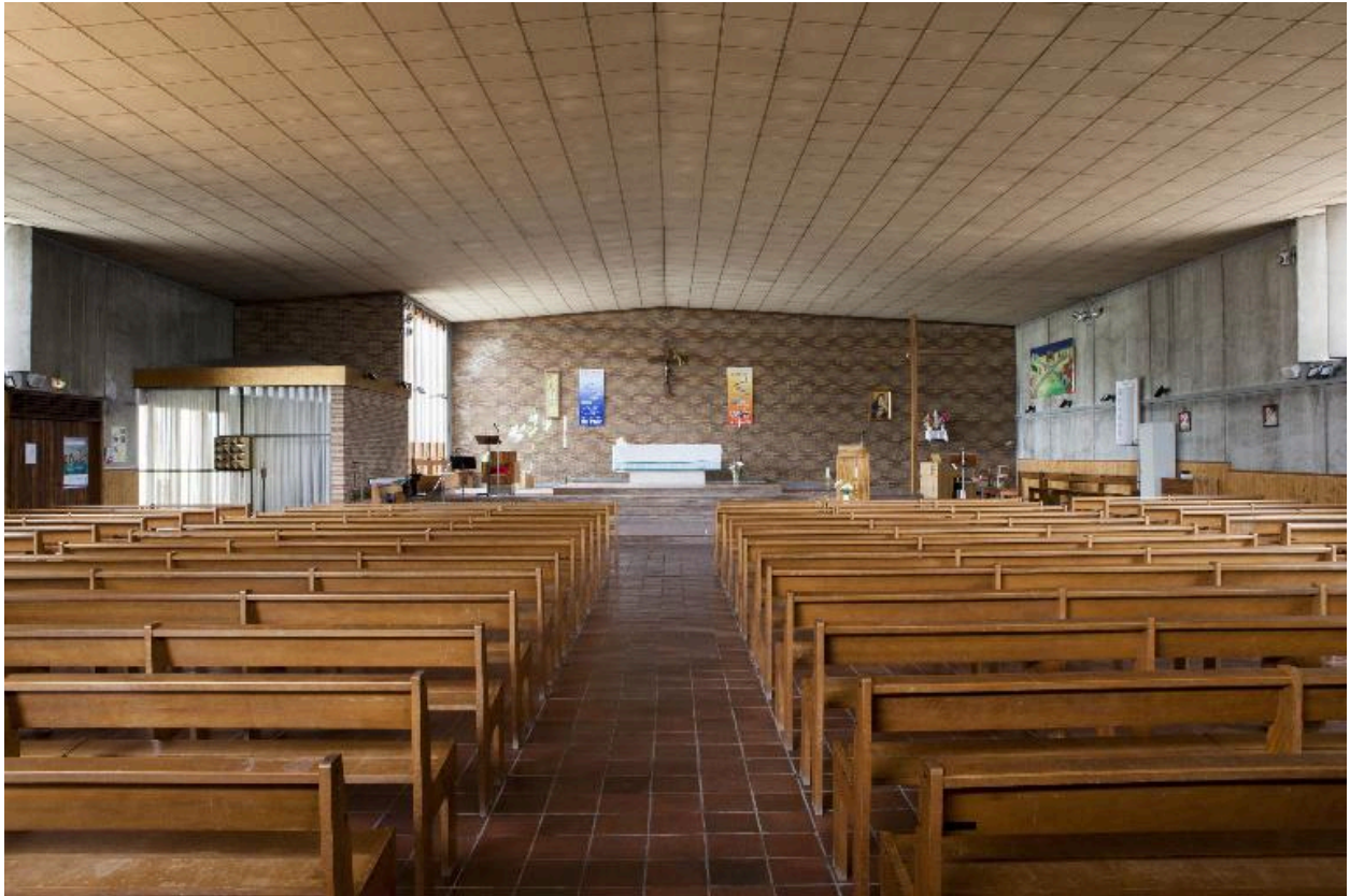
Vue générale vers le chœur.