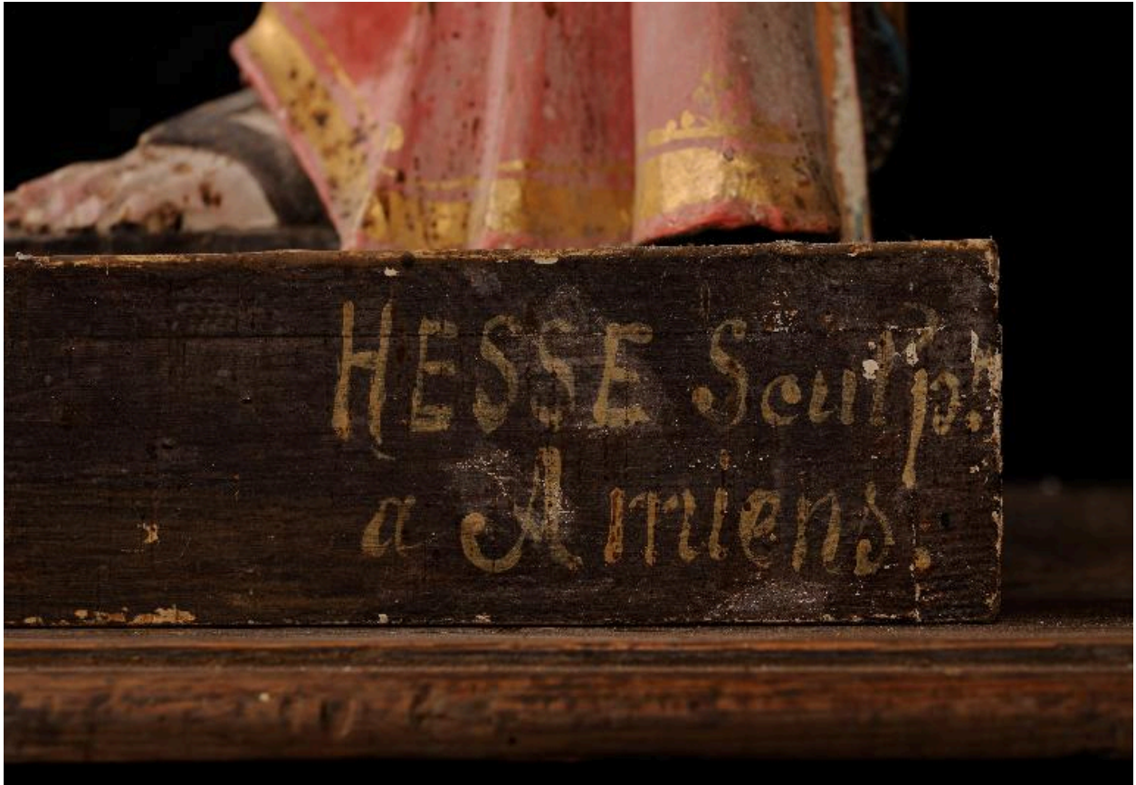
Détail du socle portant l'inscription : HESSE Sculp./a Amiens.