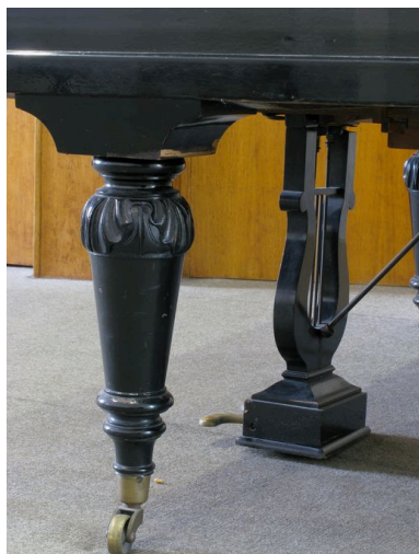
Vue de détail IVR31_20126201615NUCA