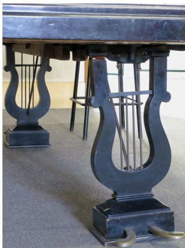
Vue de détail IVR31_20126201614NUCA