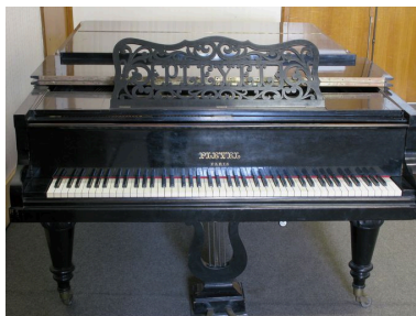
Vue générale IVR31_20126201610NUCA