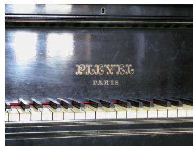
Vue de détail IVR31_20126201613NUCA