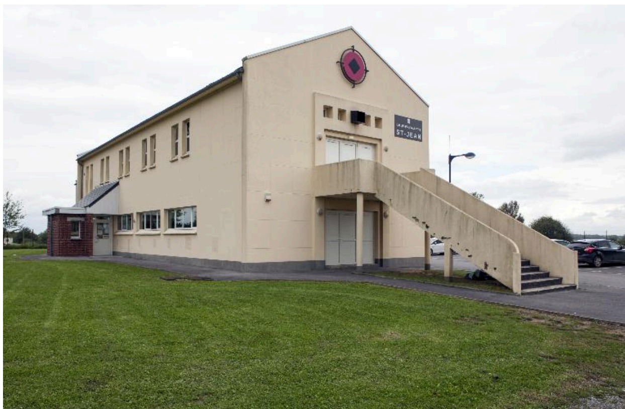
Élévation antérieure, trois quart gauche.