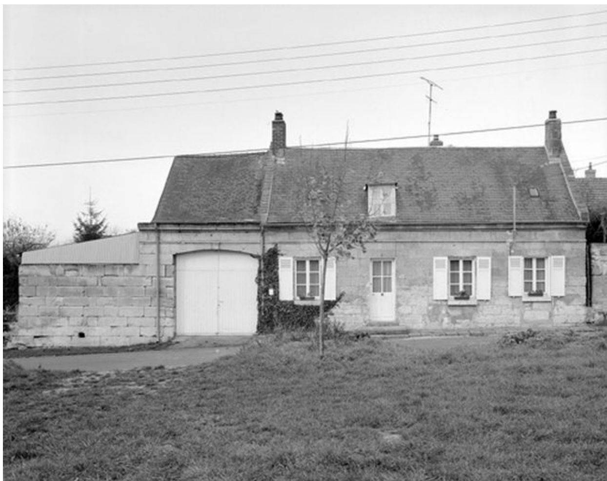
Logis. Vue générale.