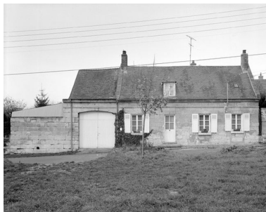
Logis. Vue générale. IVR22_19846001401V

Plan de situation. Extrait du plan cadastral de 1982, section A3 449.